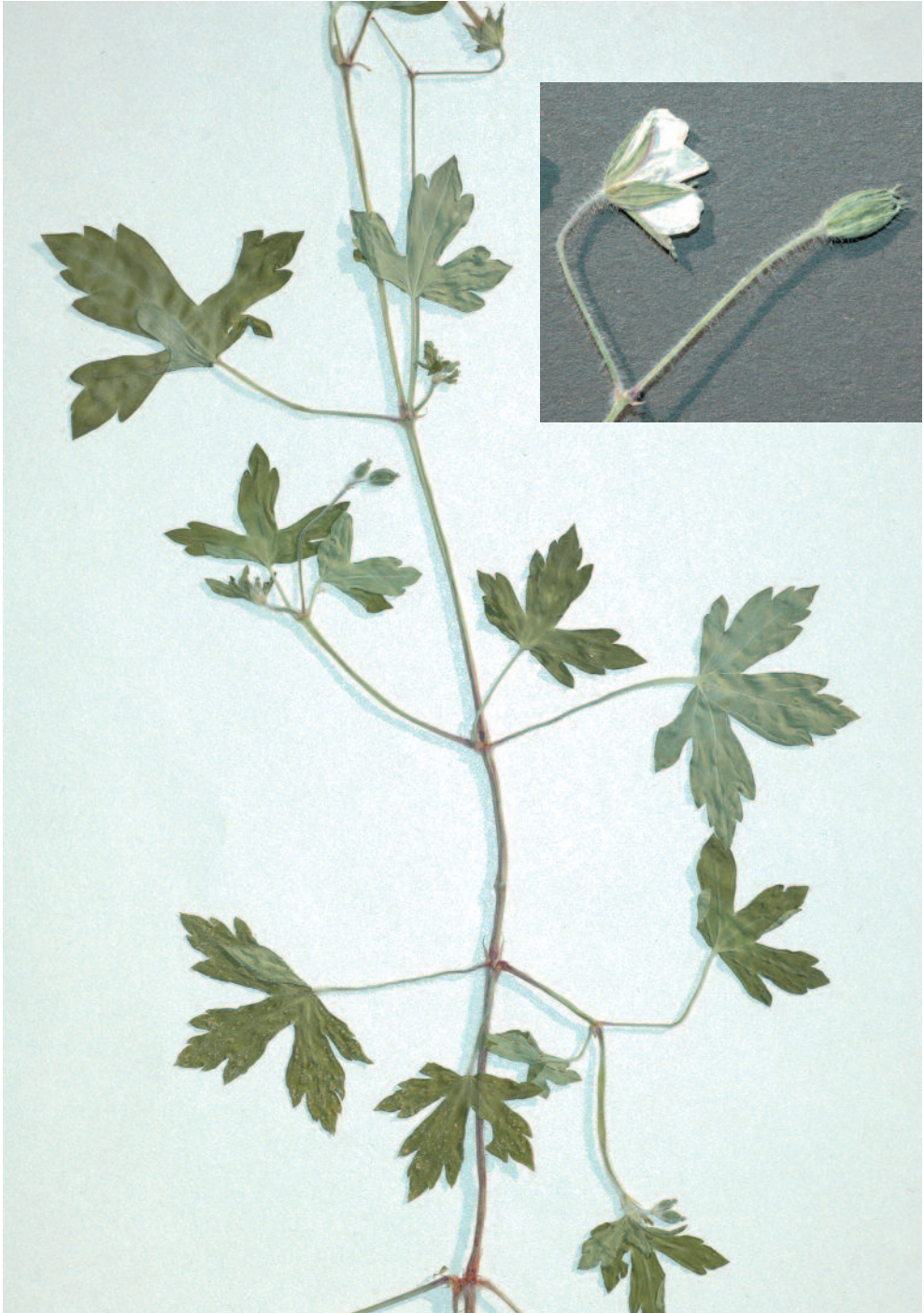
Abb. 4: Geranium thunbergii , Herbarbeleg von Mespelbrunn, das Insert zeigt einen Blütenstand.