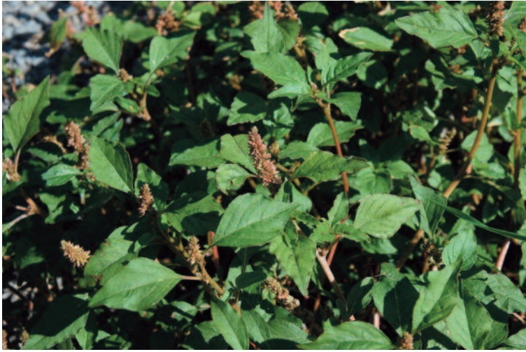
Abb. 1b: Üppig gewachsene Einzelpflanze von Amaranthus deflexus am Rand eines LKW-Abstellplatzes.