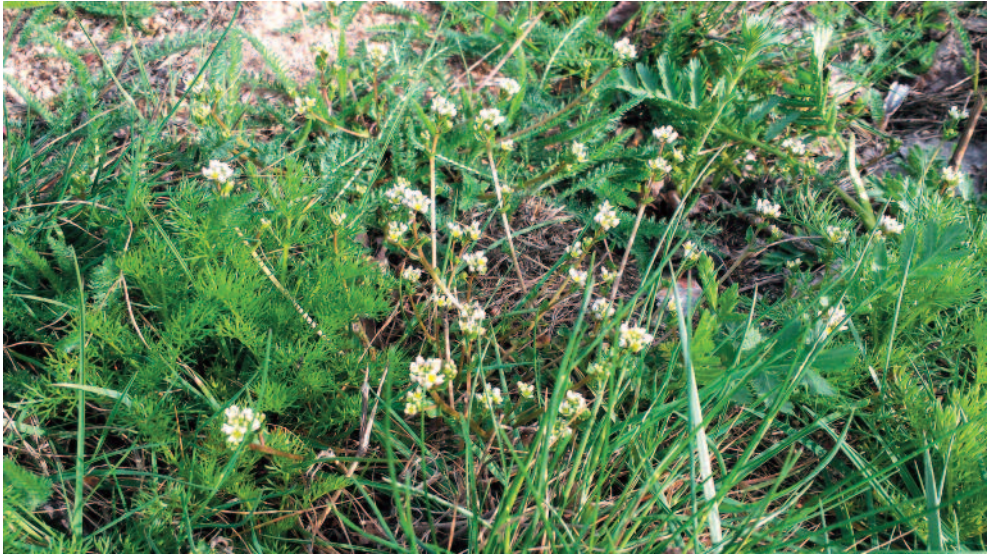
Abb. 2: Cochlearia danica , Schwarzenfeld, 15.04.2018.