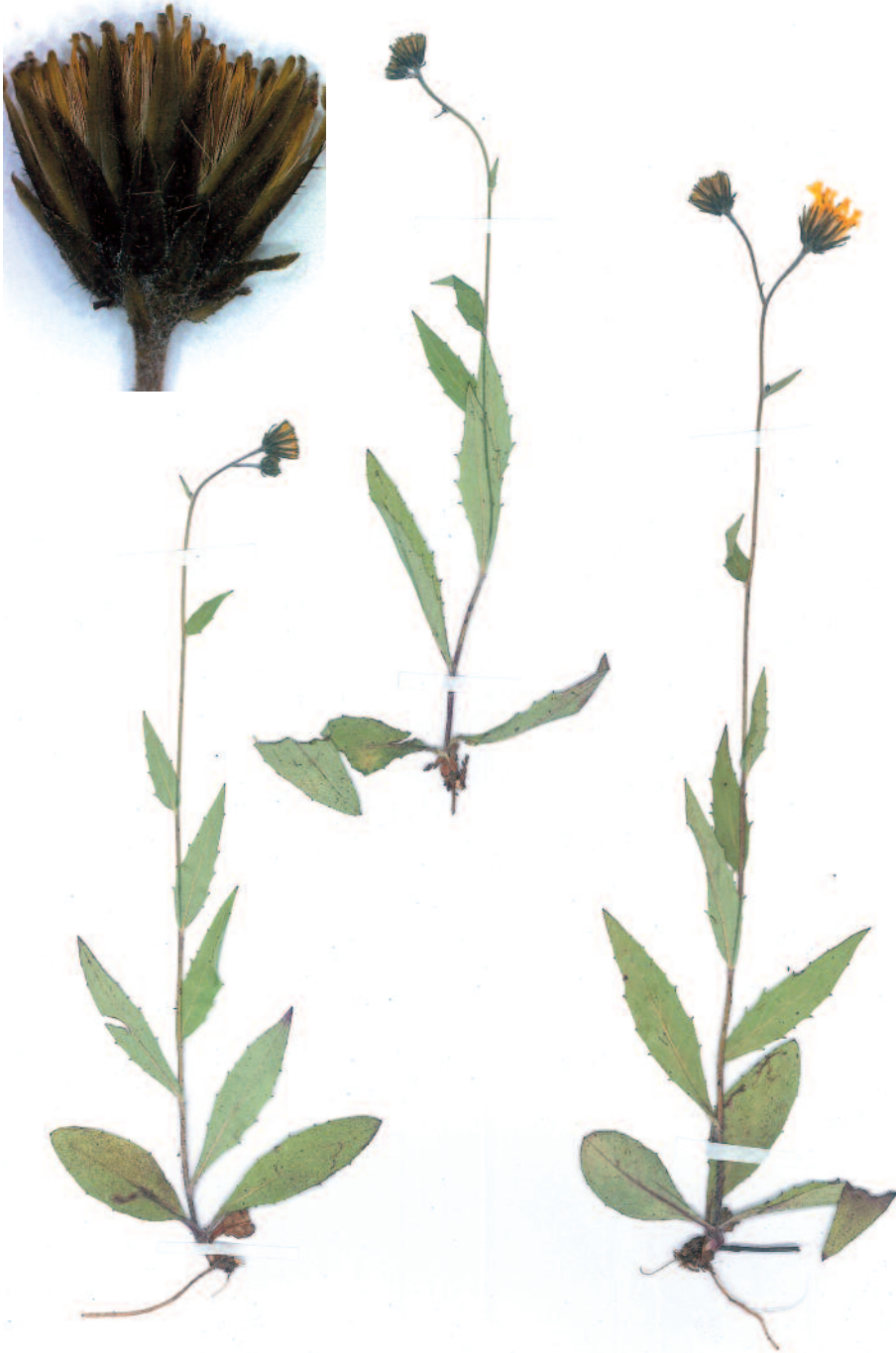
Abb. 6: Hieracium laevigatum subsp. megalolepis (Herb. Gottschlich-70559), Insert zeigt die Hülltracht.