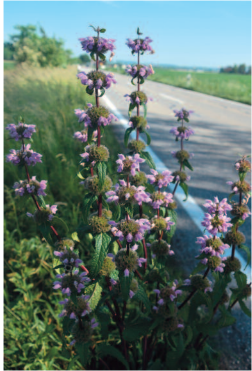
Abb. 11: Phlomoides tuberosa , Einzelpflanze am Straßenrand in Haid (Stadt Pocking) in Niederbayern.