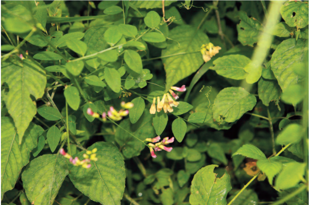
Abb. 15: Vicia dumetorum in einem Wald westlich Grassau, Chiemgauer Alpen.

Landkreis Traunstein, Gemeinde Nußdorf. Chiemgau, Moränenlandschaft E des Chiemsees, Kreuzbügel W Nußdorf. Waldrand eines Laubmischwaldes, 570 m. 47°54'14"N 12°35'6"E (WGS 84), MTB 8041/433, 23.07.2016, Beobachtung Stefan Kattari.