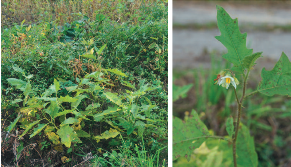
Abb. 13: Links: Wuchsort von Solanum carolinense , ein stark verunkrautetes Sojafeld, vor allem mit Gallinsoga ciliata . – Rechts: Habitus von Solanum carolinense 2017 in einem Sojafeld südlich Würding (Gemeinde Bad Füssing).

pommern und Nordrhein-Westfalen nachgewiesen (BUTTLER & al. 2018); in Baden-Württemberg liegt Etablierungstendenz vor. Aus Österreich ist sie aus Kärnten und der Steiermark bekannt (EBERWEIN & LITSCHER 2007, MELZER & OCEPEK 2011).