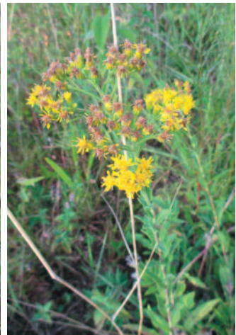
Abb. 10: Die Neuperlacher Grünfläche mit zahlreichen nordamerikanischen Pflanzenarten (zu sehen v.a. die Fruchststände von Ratibida pinnata ), darunter Pedicularis canadensis (hier bereits verblüht, links), Gentianella quinquefolia (Mitte) und Solidago rigida (rechts). Fotos: SIEGFRIED SPRINGER

es sollte lediglich mit gebietseigenem (autochthonem), am besten regionalem Saat- oder Mähgut begrünt werden, nicht aber mit Saatgut unbekannter oder gar gebietsfremder Herkunft. Die in Neuperlach gefundene Fläche beherbergt zahlreiche Neophyten, viele davon sind bisher noch nicht in Bayern oder Deutschland in Erscheinung getreten. Da es sich bei Pedicularis canadensis um einen ausdauernden Halbparasiten handelt, der auf bereits etablierten Wirtspflanzen wachsen muss, und der zudem noch 2-3 Jahre bis zur Blühreife benötigt, kann davon ausgegangen werden, dass dieses „nordamerikanische Straßengrün“ dort schon mindestens seit 2013 existiert. Einige der dort gefundenen Arten werden zwar gelegentlich als Zierpflanzen kultiviert (JÄGER et al. 2008), dennoch ist davon auszugehen, dass dieser Straßenstreifen (ge-