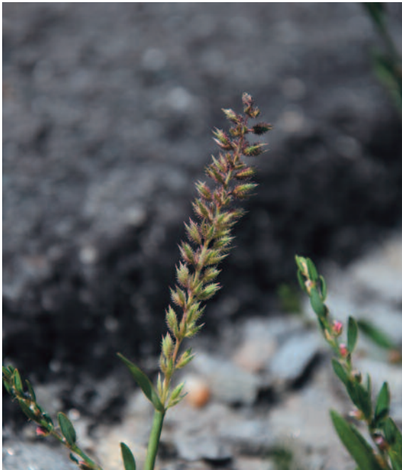
Abb. 14: Tragus racemosus , einzelnes Exemplar am Straßenrand der Bundesstraße 12 östlich Bergham (Gemeinde Haiming).

Das in Süd- und Südosteuropa häufige Traubige Klettengras befindet sich seit einigen Jahren in Mitteleuropa in deutlicher Ausbreitung. In Österreich war diese Art lange Zeit nur auf den pan-nonischen Raum im Osten des Landes beschränkt. Entlang von Bahnanlagen und Straßen hat sich das Klettengras jedoch deutlich nach Westen (und Nordwesten) ausgebreitet. Im Raum Linz tritt diese Art bereits häufig an der