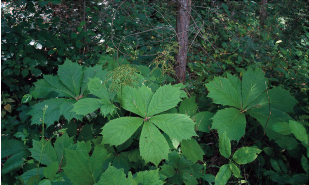
Abb. 12: Rodgersia podophylla – eine kleine Gruppe am Waldrand bei Grassach (Stadt Tittmoning) in Oberbayern, verursacht vermutlich durch Ausbringung von Gartenabfällen.

wahrscheinlich. Die Bestimmung der oberbayerischen Pflanzen erfolgte mit Hilfe des Schlüssels in JÄGER & al. (2008).