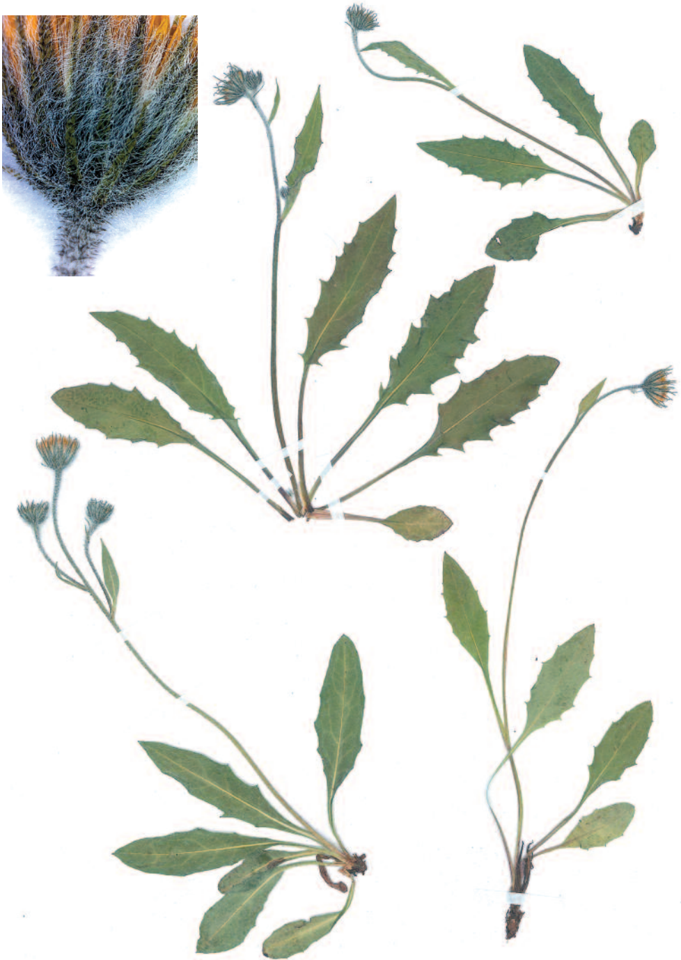
Abb. 7: Hieracium pallescens subsp. subgelmianum (Herb. Gottschlich-70010), Insert zeigt die Hülltracht.