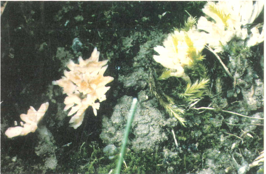
Abb. 1: Tremellodendropsis tuberosa am Standort: Stauchmoräne östlich Remplin, 28.IX.1993, FOTO: WENDLAND.

Während der Arbeitstagung der Arbeitsgemeinschaft Mykologie des Botanischen Vereins zu Hamburg Ende September 1993 in Teterow führte eine Exkursion zur Stauchmoräne östlich Remplin (Kreis Malchin). Ein Trockenrasen auf dem 'Bornberg' lockte mit einem überaus reichen Aspekt der Erdzunge Geoglossum cookeianum . Bei der Begehung fand ich eine Gruppe kleiner thelephoraartiger Pilze, die sich nach der mikroskopischen Bestimmung als Tremellodendropsis tuberosa (GREV.) CRAWF. entpuppten. Die Bestimmung mit JÜLICH (1984) erwies sich als nicht einfach. Im Habitus erinnern junge Exemplare an eine bleiche Thelephora . Reife Fruchtkörper hingegen werden zunehmend einer zarten, verzweigten Koralle ähnlich. In beiden Formenkreisen wird man den Pilz aber vergeblich suchen. Erst eine sorgfältige mikroskopische Untersuchung der Basidien kann auf die richtige Spur führen: die Einschnitte zwischen den Sterigmen vollreifer Basidien ziehen auffällig weit herab und wirken wie Anfangsstadien einer beginnenden Längsseptierung. Eine vollständige Längsseptierung tritt aber niemals auf. Tatsächlich handelt es sich hier um einen ungewöhnlichen Heterobasidiomyceten aus der Ordnung Tremellales (nach CORNER 1970 ein „missing link“ zwischen Homo- und Heterobasidiomyceten), der so gar nicht in das Bild eines Zitterpilzes paßt. Es ist daher durchaus möglich, daß Aufsammlungen dieses Pilzes als unbestimmbar verworfen wurden