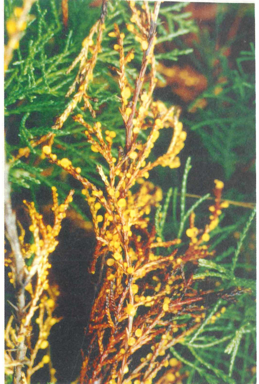
Häufig besiedelt Pithya cupressina abgestorbene Zweige und Nadeln an lichtoffenen, im äußeren Randbereich der Büsche befindlichen Stellen, hier an Juniperus x pfitzeriana 'Pfitzer'.

Sichtet man die Literatur, so erweist sich