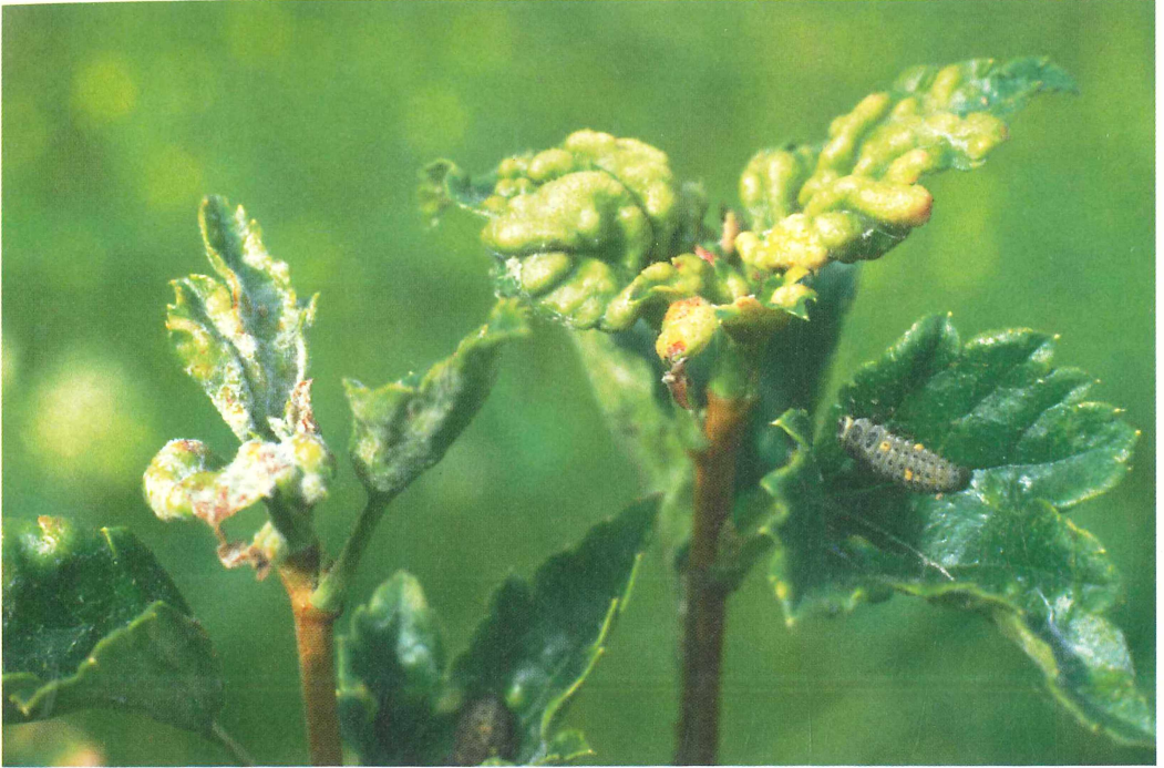
Abb. 1: Microsphaera grossulariae auf Ribes alpinum (Alpen-Johannisbeere). Bei unserem Fund trat der Pilz lediglich an jungen Blättern bzw. an Triebspitzen auf. Häufig waren Blattdeformationen und -verfärbungen festzustellen, die jedoch in erster Linie von Läusen und von diesen übertragenen Viren hervorgerufen wurden. Larven von Marienkäfern, die eifrig Läuse fraßen, erweiterten das Artenspektrum des Mikrohabitats Triebspitze (Leipzig, Gutenbergplatz, VIII 1999).

streut; ab 6 Funde = häufig (Einschätzung der Häufigkeit erfolgte unabhängig von der räumlichen Verteilung der Funde, d.h. im Extremfall liegen alle Fundorte im gleichen Stadtteil). Wurde der Pilz auf mehreren Wirten nachgewiesen, werden die am häufigsten befallenen Pflanzen zuerst genannt. Damit sollen Wirtspräferenzen im UG deutlich gemacht werden. Bei gleicher Häufigkeit wurde alphabetisch nach Wirtspflanzen geordnet. Angaben für häufige Wirte wurden aus Platzgründen zusammengefaßt.