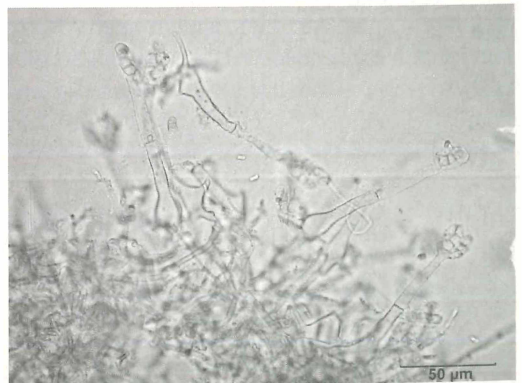
Abb. 4: Mehrere Basidiophoren von Krieglsteinera lasiosphaeriae (Foto: T. RÖDEL).