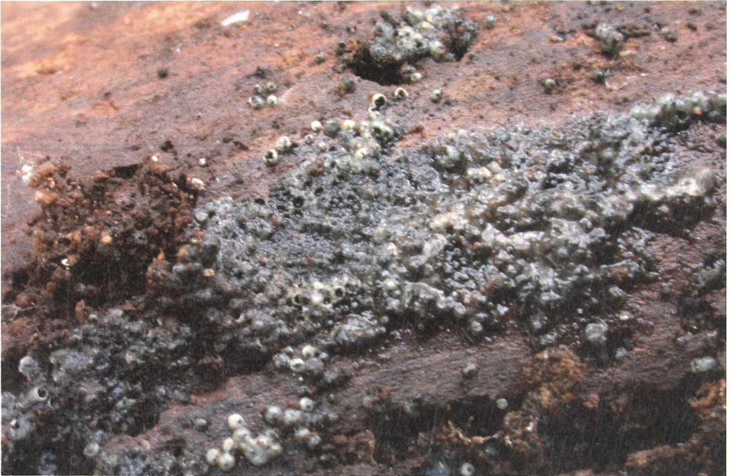
Abb. 1: Teilweise kollabierte Fruchtkörper von Lasiosphaeria ovina auf der Unterseite eines Fagus -Astes. Die Kolonie des Ascomyceten ist mit Krieglsteineria lasiosphaeriae infiziert und von einer dünnen Schleimschicht überzogen (Foto: T. RÖDEL).

Die Sporen sind ellipsoid. Ihre Größe beträgt 4 – 5 x 2 – 2,5 µm (Abb. 2d). Sie entstehen direkt an den Basidienzellen. Sterigmen werden nicht gebildet.