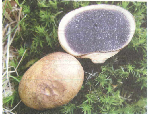
Abb. 5: Sclerderma cepa besitzt eine ziemlich dicke Peridie, die auf Druck weinrötlich verfärbt.

Die Art ist in der Checklist von Sachsen (HARDTKE & OTTO 1998) nicht verzeichnet. Der Verbreitungsatlas von G. KRIEGLSTEINER (1993) weist für die alten Bundesländer lediglich 4 Funde aus. Hinzu kommen zumindest 2 weitere, von L. KRIEGLSTEINER (2005) publizierte aus dem Schwarzwald. Pezoloma ciliifera ist bei Letztgenanntem detailliert beschrieben, so dass es hier sicherlich keiner weiteren Merkmalsangaben bedarf.