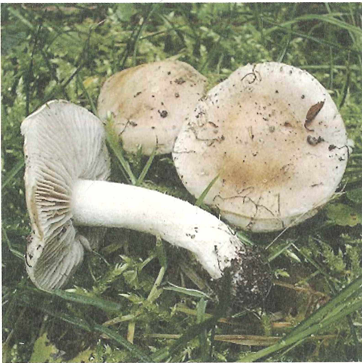
Abb. 1: Die Lamellen von Hebeloma vejense sind gleichmäßig gefärbt, zeigen somit weder Guttationstropfen noch Flecken.

Als mir dann die Arbeit von VESTERHOLT (2005) zur Verfügung stand, geriet die dort neu beschriebene Art Hebeloma vejense VESTERH.