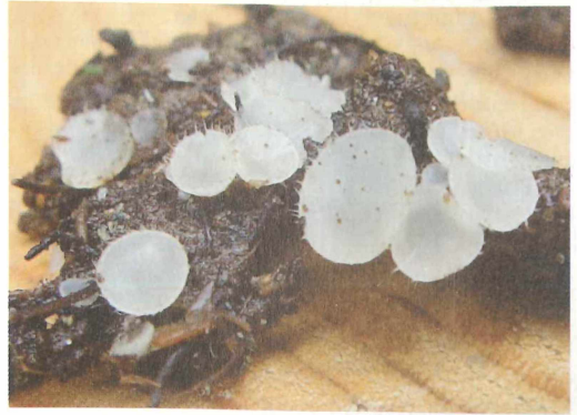
Abb. 4: Pezoloma ciliifera besitzt deutliche haarartige Bildungen am Apothecienrand.

MTB 5539/22, Trieb, auf Amanita rubescens , 500-515 m NN, 03.09.2005, leg. C. MORGNER, det. C. MORGNER