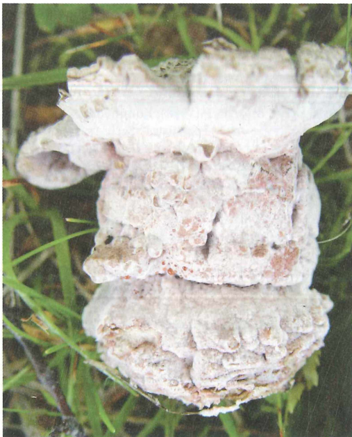
Abb. 3: Von Mycogone rosea parasitierter Fruchtkörper eines Perlpilzes.