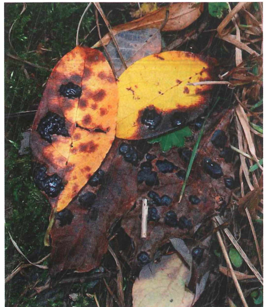
Abb. 2: Rhytisma salicinum auf Salix caprea im NSG Gimmlitztal.

In Sachsen sind bisher 13 Fundnachweise bekannt geworden (Funde jüngerer Datums vgl. Abb. 1 ). Die Erstangabe stammt von ALBERTINI & SCHWEINIZ, die die Art um 1805 in der Umgebung von Niesky auf Salix fanden. Die nächste Angabe ist erst wieder 1882 aus dem Elbsandsteingebirge zu verzeichnen. KRIEGER fand die Art im Bielatal auf Salix aurita . Wie die Verbreitungskarte zeigt, liegen die Vorkommen in Sachsen sowohl im Gebirge als auch im Tiefland. Eine gewisse Häufung der Funde ist im Elbsandsteingebirge zu erkennen. Die tiefsten Vorkommen liegen in der Lausitzer Heidelandschaft bei Königswartha (MTB 4652) und in der Leipziger Tieflandbucht bei Werben (MTB 4839). Der höchste Fundort ist Hermsdorf/Osterzgebirge im NSG Gimmlitztal mit 710 m NN. Dort kommt die Art auf einer frei stehenden alten Sal-Weide vor. Von einer montanen Verbreitung der