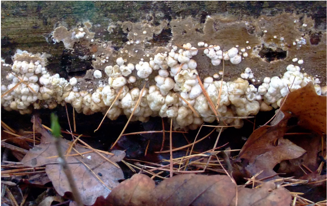
Abb. 1: Der Dickhäutige Kellerschwamm – Coniophora puteana – an einem liegenden Lärchenstamm. Die weißlichen, gallähnlichen Gebilde werden durch einen Befall mit Nodulisporium cecidiogenes hervorgerufen.

Nordrhein-Westfalen: Brüggen, NSG Brachter Wald (MTB 4702/2) 10.01.2012; Mönchengladbach, Volksgarten (MTB 4804/2), 10.09.2004; Mönchengladbach Zoppenbroicher Park (MTB 4804/2), 05.10.2015; alle drei Funde leg. & det. Hans Bender.