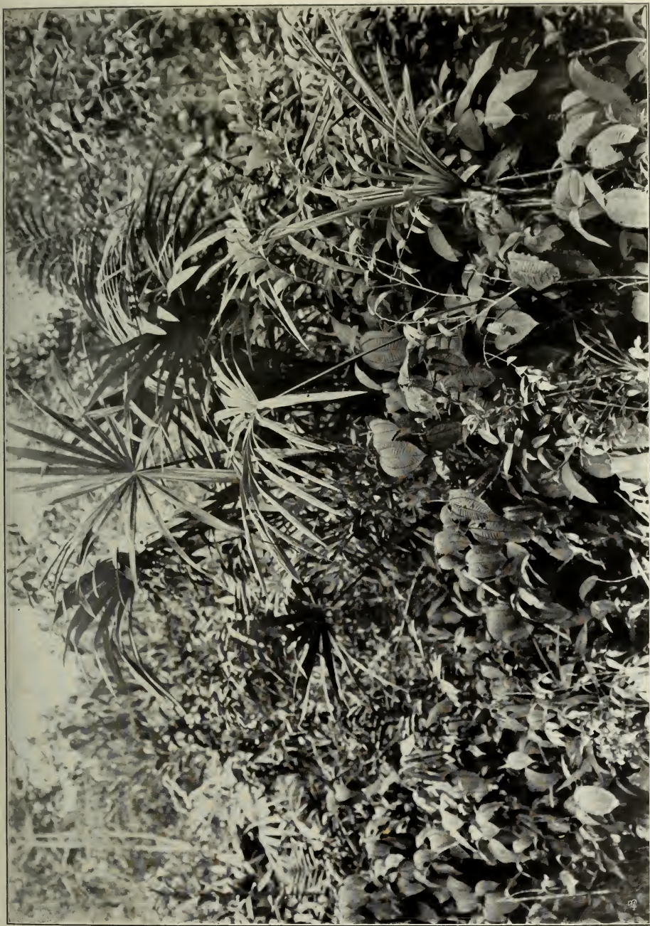
Unterholz im Walde, auf Sandboden bei Manáos, mit Carludovica sp., Miconia Schwackei Cogn. und Mabea sp.