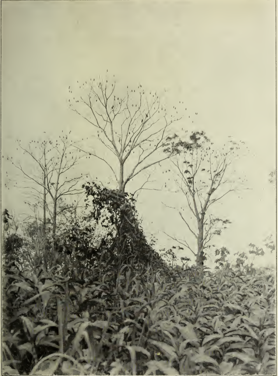
Bombax aquaticum K. Sch. im Neuland des Amazonenstromes bei Leticia in Peru.