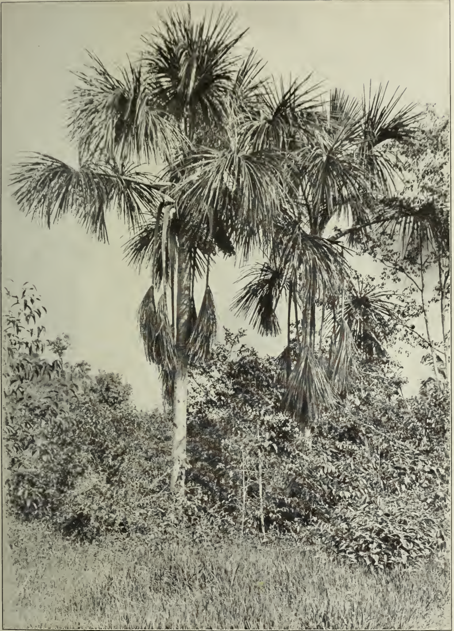
Mauritia flexuosa L. f. bei Manáos.