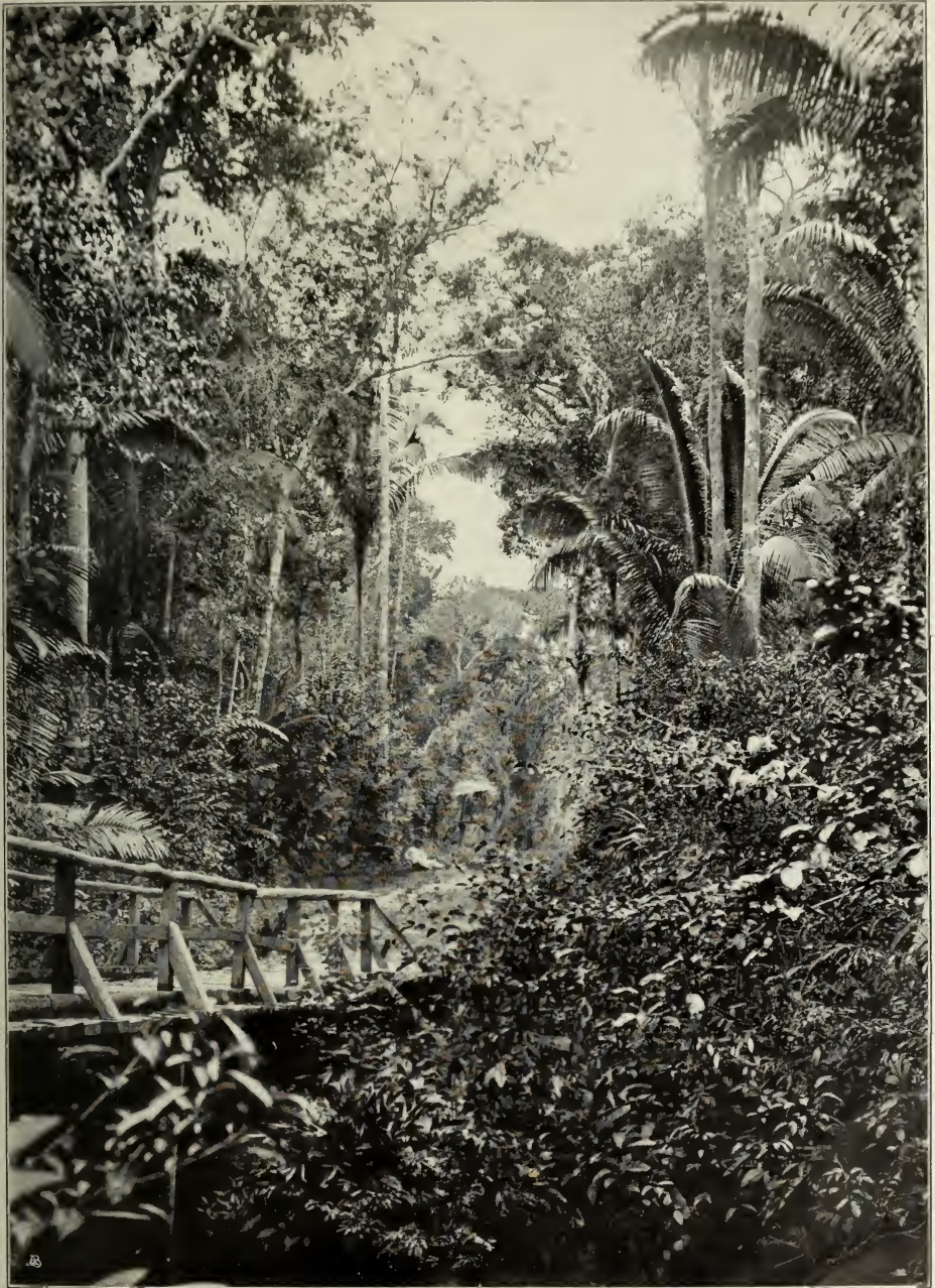
Feuchter Wald der Terra firme in der Kolonie Campo Salles unweit Manáos, am Bache Tacca Sprucei Bth. und im Walde Maximiliana Maripa Dr.