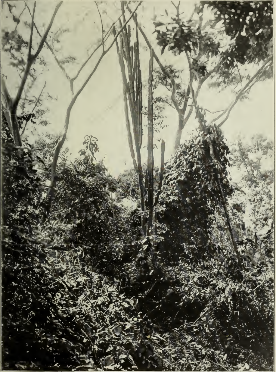
Xerophiler Wald (Trockenwald) bei Tarapoto in Peru mit Cereus trigonodendron K. Sch. n. sp.