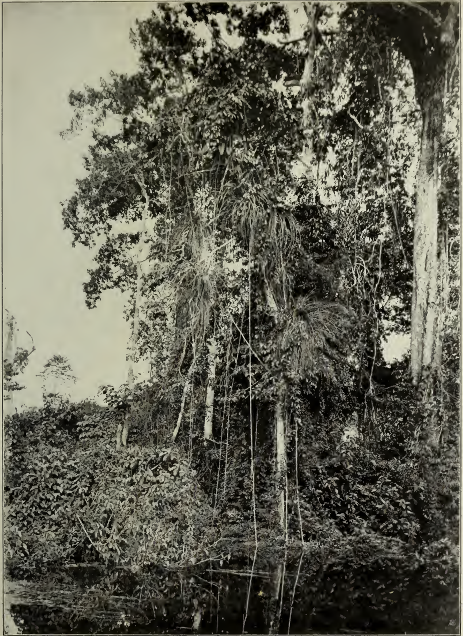
Blumengärten der Ameisen im Überschwemmungswald (Jarapó) bei Iquitos in Peru; besonders mit Streptocalyx angustifolius Mez bewachsen.