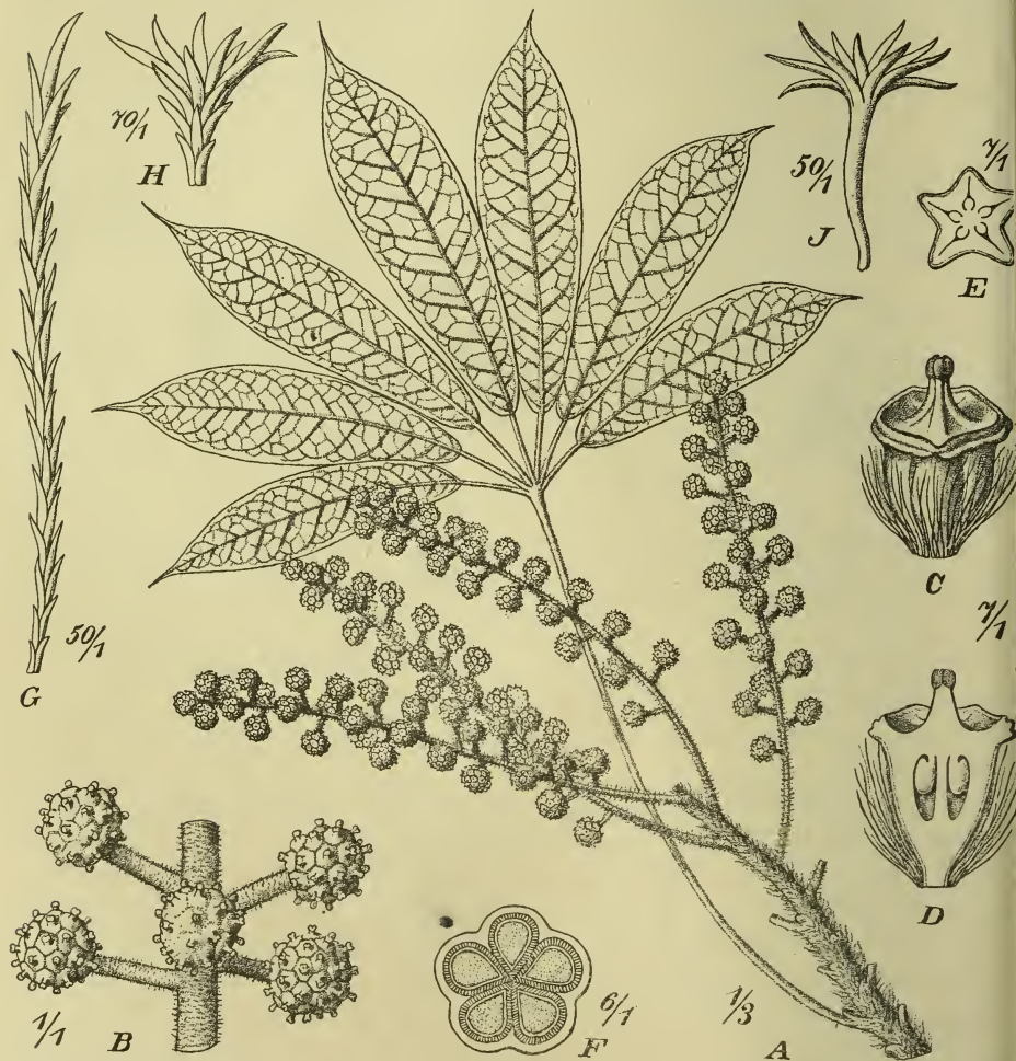
Fig. 4. Schefflera setulosa Harms. A Blütenstand mit Blatt, B Teil des Blütenstandes mit abgeblühten Köpfchen, C Blüte ohne Blumenblätter, D im Längsschnitt, E Fruchtknoten im Querschnitt, F Frucht im Querschnitt, G, H, J Haare vom Fruchtknoten, Köpfchenstiel und Blatt.

10. Sch. setulosa Harms n. sp. — Frutex comosus, ramulis apice dense vel densissime setuloso-hispidis (setulis longis molliusculis subsericeis), serius subglabrescentibus; folia ampliuscula digitata, petiolo basi setuloso