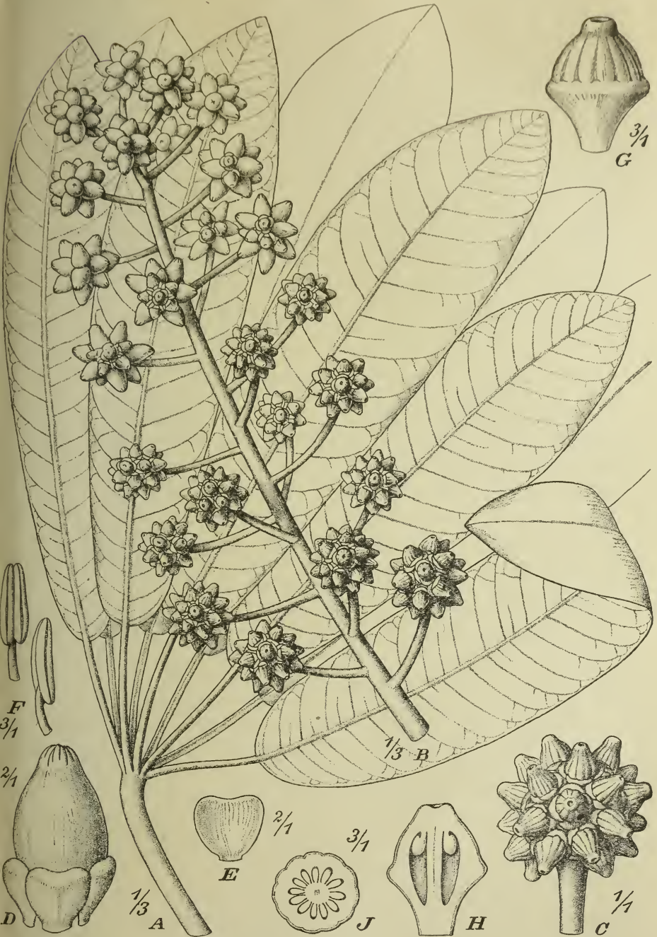
Fig. 2. Schefflera megalantha Harms. A Blatt, B Blütenstand, C Köpfchen, D Blüte mit Brakteen, E Braktee, F Staubblätter, G Pistill, H Fruchtknoten im Längsschnitt, J im Querschnitt.