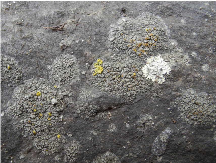
Abb. 2: Caloplaca xerica , Basalt-Stützmauer bei Lorch. – Caloplaca xerica at supporting wall of basalt near Lorch (Rheingau, Hesse).