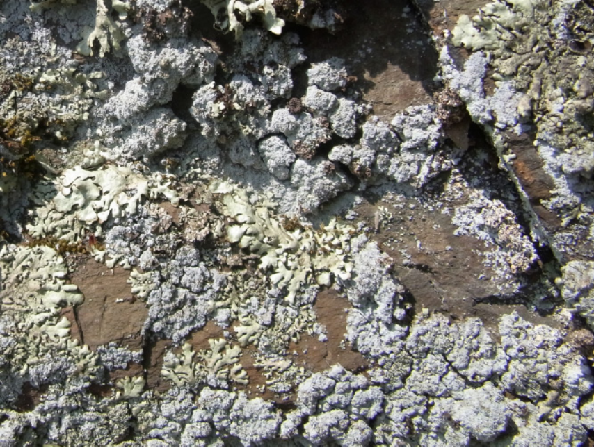
Abb. 3: Lepraria borealis , exponierte Weinbergmauer bei Lorchhausen. – Lepraria borealis at exposed wall in wine yard at Lorchhausen (Rheingau, Hesse).