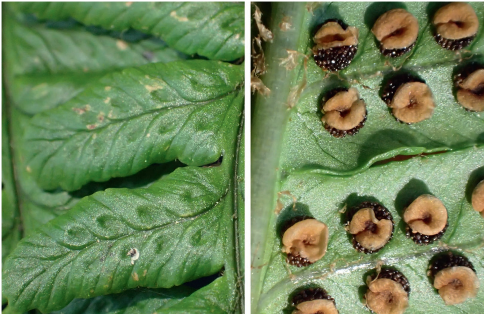
Abb. 35/233: Dryopteris affinis subsp. punctata . Makrofotos der Ober- und Unterseite der Fiederchen mit charakteristischen „Dellen“ und derben Indusien; Neunkirchner Höhe.

Neu für Hessen! Die Verwandtschaft von Dryopteris affinis bereitet erhebliche Bestimmungsprobleme. Die Form der Fiederchen, das derbe Indusium und die deltenartigen Mulden auf der Gegenseite der Sori (Blattoberseite) gelten aber als sehr charakteristisch für die hier mitgeteilte Unterart. Sie war in Deutschland bisher nur im Allgäu gefunden worden (Freigang & Zenner 2007, Ber. Bot. Arbeitsgem. Südwestdeutschland 4, 37–64). Im Odenwald kommen also alle aus Deutschland bekannten und gültig benannten Formen vor. Manche sind allerdings nur aus dem badischen Teil sicher nachgewiesen ( D. cambrensis , D. lacunosa : beide bei Heidelberg). Auch D. pseudodisjuncta ist sehr selten (Melibocus, Reisenbacher Grund). Die typische Unterart ( D. affinis subsp. affinis ) ist im Odenwald ebenfalls nicht häufig, aber weiter verbreitet, wobei der Verbreitungsschwerpunkt im Süden (Neckartal und Seitentäler) liegt. Öfters zu finden ist dagegen D. borrieri .