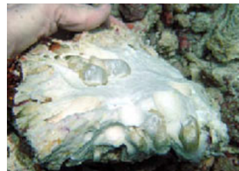
Abb. 2. Korallenbruchstück mit Parapholas quadrizonata .