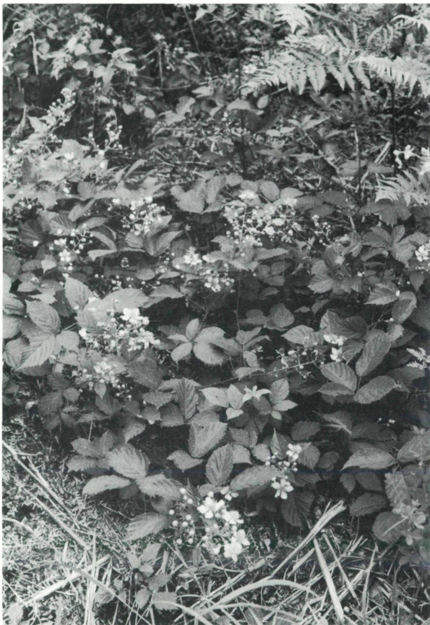
Abb. 3: Waldsaum-Vergesellschaftung mit Rubus juennensis LEUTE & MAURER. Herkunft: Typus-Lokalität.