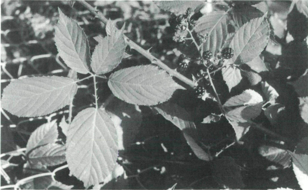
Abb. 4: Fruchtendes Exemplar von Rubus juennensis LEUTE & MAURER in einem Grazer Garten. Kultiviert aus Samen der Umgebung von Rückersdorf in Kärnten.

Rubus juennensis fällt insbesondere durch die großen, kräftig roten Blüten und durch die länglich-verkehrt eiförmigen Schöblingsendblättchen auf. Er unterscheidet sich von Rubus villicaulis KOEHLER ex WEIHE & NEES vor allem durch den nur zerstreut behaarten Schöbling und die länglich-verkehrt eiförmigen Schöblingsendblättchen sowie durch die geraden dünnen Stacheln im Blütenstand und die Farbe der Blüten; von dem aus Frankreich beschriebenen Rubus macrophyloides GENEVIER durch breitere Schöblingsendblättchen, größeren Blütenstand und behaarte Fruchtknoten.