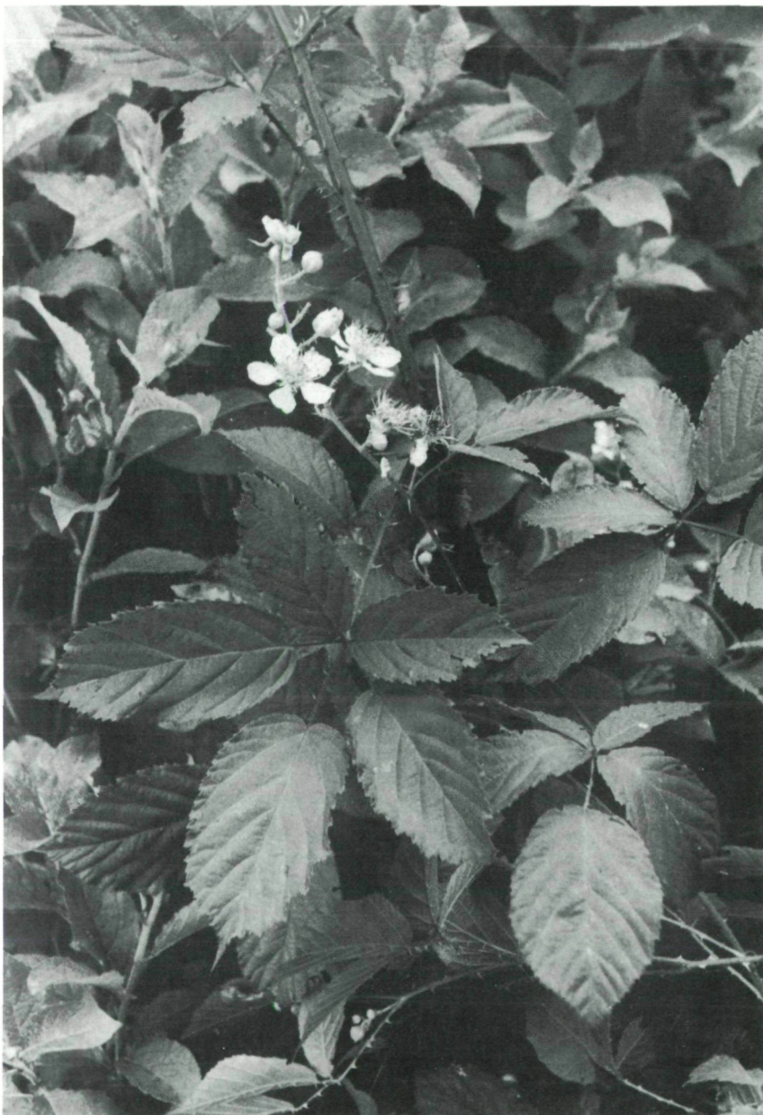
Abb. 2: Rubus juennensis LEUTE & MAURER, blühende Pflanze. Herkunft: Typus-Lokalität.