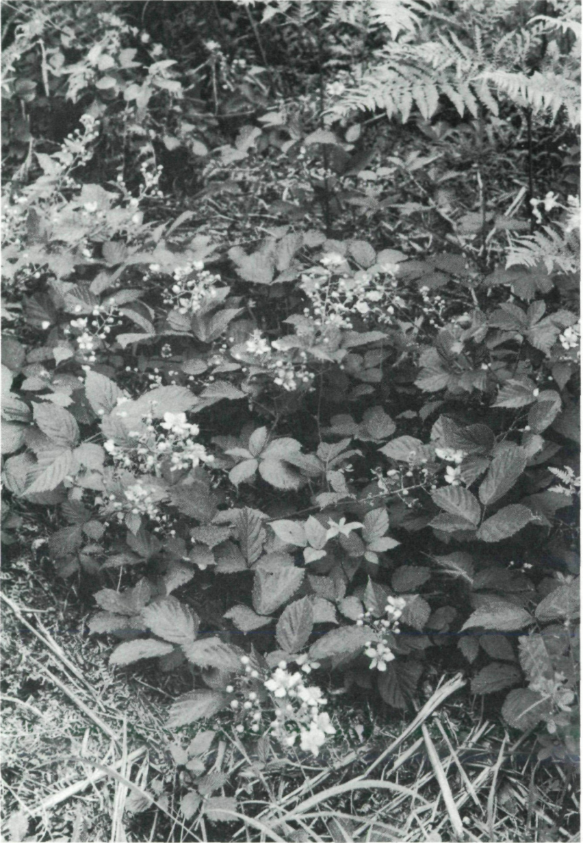
Abb. 3: Waldsaum-Vergesellschaftung mit Rubus juennensis LEUTE & MAURER. Herkunft: Typus-Lokalität.