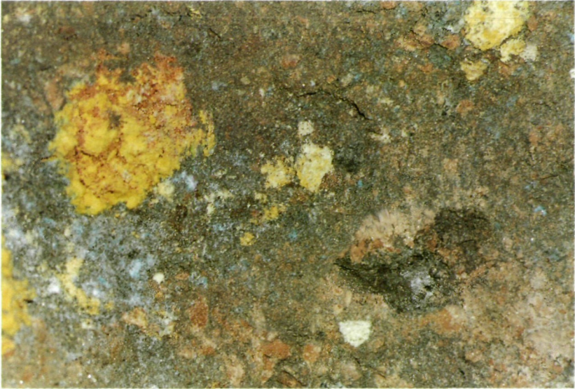
Abb. 2: Profildarstellung vom verwitternden Abraummateriale im Kiesbergbau Lading: Der graue Pyrit-Grus umschließt Aggregate von gelbem Hydronium-Jarosit, blauem Siderotil und rosarotem Römerit.

chen waren Ansammlungen von winzigen Blättchen mit rhomboidischem oder gestrecktem, sechsseitigem Umriß und bis 1 Zentimeter groß (MEIXNER, 1940). – Römerit kommt hier aber auch in weitaus größeren Ausmaßen vor. Der Pyrit, der im gegenwärtigen Zerfallsstadium als grauschwarzer Grushügel zum Vorort hin meterhoch die Sohle bedeckt, wurde vom Autor für eine fotografische Aufnahme exakt abgegraben, um dem interessierten Leser ein Vertikalprofil zu vermitteln (Abb. 2). Der Römerit macht dabei einen beachtlichen Teil dieses Verwitterungsbereiches aus: Manche der fleischfarbenen, kristallinen Blöcke überschreiten das Kubikdezimetermaß, und die in der Mitte der Abbildung 1 präsente Kuppe (1 Meter Basisbreite) birgt einen mächtigen Römerit-Kern. Damals wurde der Römerit chemisch und optisch festgestellt; nun liegt auch ein Röntgenbefund vor.