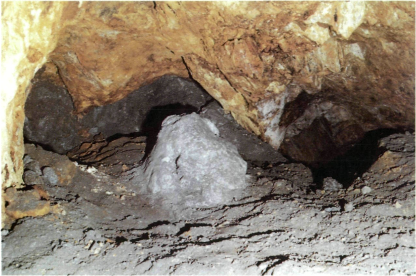
Abb. 1: Feldort im Kiesbergbau Lading: Der obere Bereich entspricht CANAVALS Beobachtungen vor der Jahrhundertwende. Auf der Stollensohle liegt das Abraummaterial, hauptsächlich Pyrit; er ist weitgehend zu Grus zersetzt. Die graue Kuppe in Bildmitte führt Eisensulfate, in ihrem Kern insbesondere den Römerit. Aufnahme: M. PUTTNER

durchhörterte und dann Kiese antraf. Als CANAVAL den Bau im November 1895 befuhr, betrug die Streckenlänge 25 Meter. Am Feldort fand er im ockerigen Gneis mit Limonit vermischte Kiese vor, die nach oben hin ganz in Limonit, der Vitriolnester enthielt, übergingen (Abb. 1). Die Vererzung war 1,5 Meter mächtig und das Verflähen des Gneises im Hangenden 70^\circ nach 14^h5^\circ . Bei den Kiesen handelte es sich vorwiegend um eine ausgewitterte, löcherige Pyrit-Masse mit weinroten Granatkörnern, Glimmer und Quarzstücken. Chalkopyrit, der am Lading bereichsweise auftritt, war damals in den Gangproben nicht feststellbar. Limonit-Analysen im Laboratorium der k.k. geologischen Reichsanstalt ergaben aber Kupferanteile von 0,75 bis 19,73% und eine Probe in Karlshof sogar 24,30%. Die Mineralisation dieses Schurfbaues wird weiters mit Allophan, Andesin, Biotit, Cuprit, Magnesit, Graphit, Malachit, Muskowit, Orthoklas, Plagioklas, Pyrrhotin, Rutil, Titanit und Zirkon angegeben (CANAVAL, 1900).