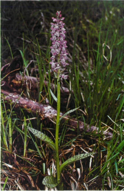
Abb. 1: Dactylorbiza x juennensis, Habitus, 23. 6. 1996.