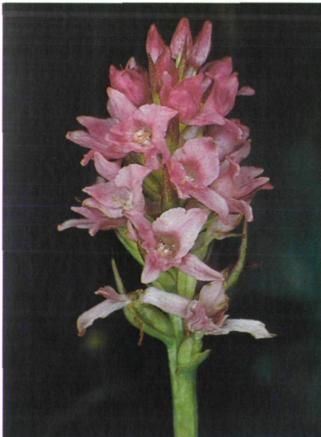
Abb. 7: X Gymnigritella abelii, Jauken, 21. 7. 1995.

Die seltene Gattungshybride X Gymnigritella abelii ( Gymnadenia odoratissima x Nigritella rubra ) wurde in Kärnten erstmals im Jahre 1898 im Gebiet der Lienzer Dolomiten (Rudnickofel bzw. Rosengarten E vom Hochstadel, Quadrant 9243/1) und im Jahre 1901 im Gebiet der Gailtaler Alpen (Jauken,