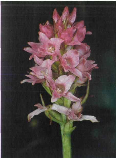
Abb. 7: X Gymnigritella abelii, Jauken, 21. 7. 1995.

Die seltene Gattungshybride X Gymnigritella abelii ( Gymnadenia odoratissima \times Nigritella rubra ) wurde in Kärnten erstmals im Jahre 1898 im Gebiet der Lienzer Dolomiten (Rudnickofel bzw. Rosengarten E vom Hochstadel, Quadrant 9243/1) und im Jahre 1901 im Gebiet der Gailtaler Alpen (Jauken,