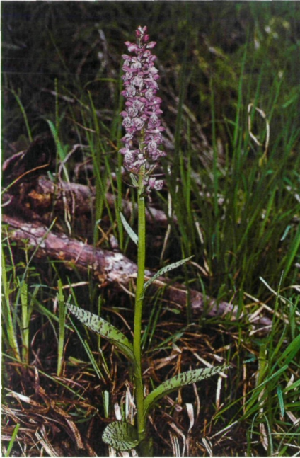
Abb. 1: Dactylorbiza x juennensis, Habitus, 23. 6. 1996.