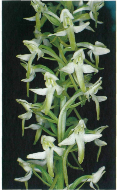
Abb. 4: Platanthera x hybrida, Theißenegg, 16. 6. 1993.