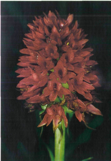
Abb. 6: Nigritella x wettsteiniana, Nockgebiet, 27. 7. 1995.