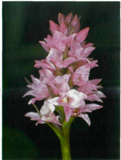
Abb. 8: X Gymnigritella godferyana, Mussen, 17. 7. 1995.