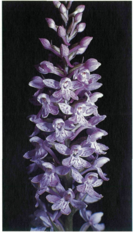
Abb 5: X Dactyloдения gracilis, Obir, 1. 7. 1995.