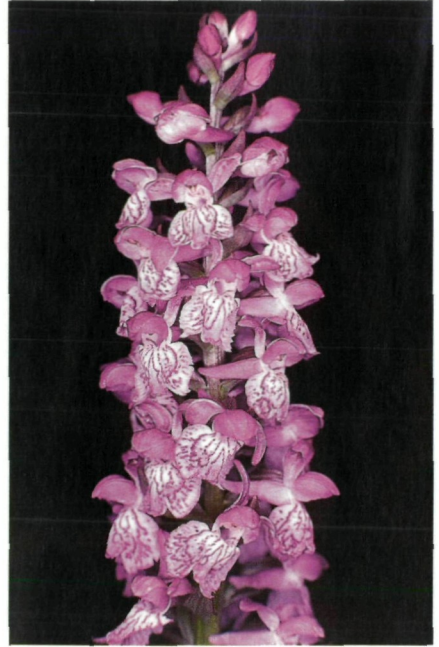
Abb. 2: Dactylorbiza x juennensis, Blütenstand, 23. 6. 1996.