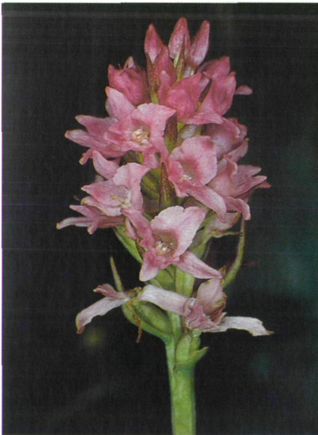
Abb. 7: X Gymnigritella abelii, Jauken, 21. 7. 1995.

Die seltene Gattungshybride X Gymnigritella abelii ( Gymnadenia odoratissima X Nigritella rubra ) wurde in Kärnten erstmals im Jahre 1898 im Gebiet der Lienzer Dolomiten (Rudnickofel bzw. Rosengarten E vom Hochstadel, Quadrant 9243/1) und im Jahre 1901 im Gebiet der Gailtaler Alpen (Jauken,