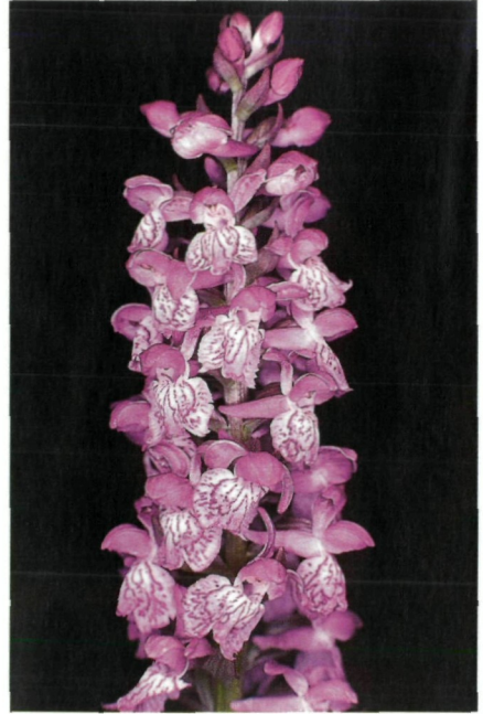
Abb. 2: Dactylorbiza x juennensis, Blütenstand, 23. 6. 1996.