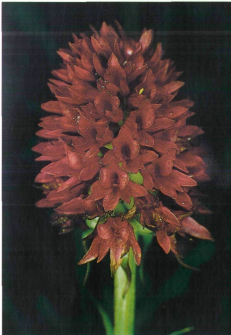
Abb. 6: Nigritella x wettsteiniana, Nockgebiet, 27. 7. 1995.