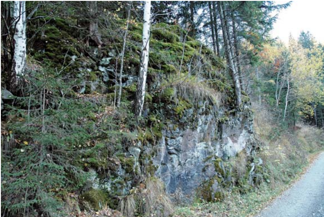
Abb. 4: Tieflagenvorkommen von Primula villosa auf einer Felswand oberhalb der Straße im Haidenbachgraben.

Die nahezu senkrechte, z. T. leicht getrepte Felswand liegt im Haidenbachgraben direkt an der Straße Richtung Mooswald 3,35 km SSE des Ortes Haidenbach bzw. ca. 100 m westlich der ersten Straßenkehre. Primula villosa wächst hier – wie am Felsblock in Wiederschwing – vorwiegend in Felsspalten, aber wie schon erwähnt auch auf Moospölstern (vorwiegend Hylocomium splendens ) und kleinen Felsabsätzen, an denen sich Kolluvialerde sammelt, einige Meter oberhalb der Straße (Abb. 4).