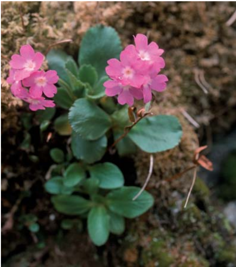
Abb. 2: Primula villosa am Felsblock im Tal- boden bei Wieder- schwung (Gemeinde Patergassen, Gurktal). Mai 2004.

Dieses bemerkenswerte, isolierte Vorkommen von Primula villosa (slow. Kuštravi jeglič) liegt in den östlichen Steiner Alpen (Kamniške