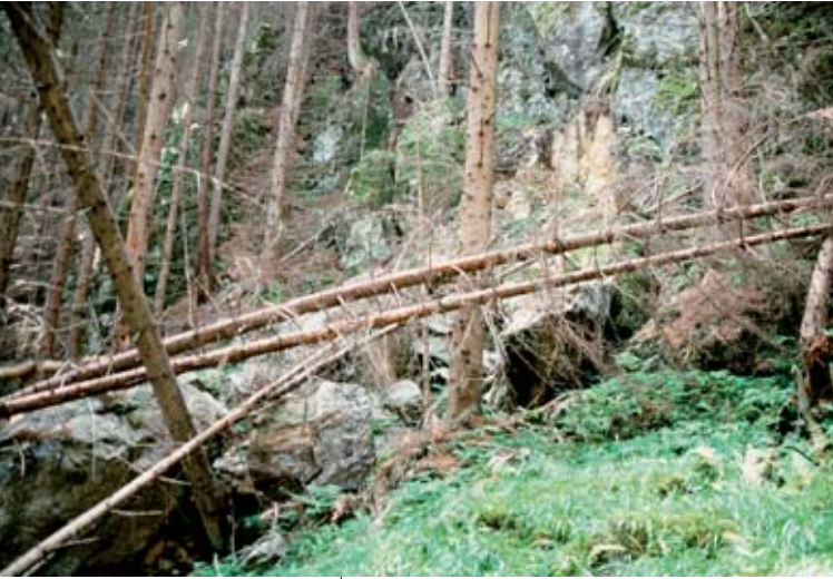
Abb. 3: Steilhang oberhalb des Vorkommens von Primula villosa östlich von Wiederschwing. Etl. Felsblöcke eines rezenten Berg- sturzes werden von geknickten Bäumen aufgehalten.

ist, der aus den benachbarten Nockbergen im Würm-Glazial vom Gurkgletscher abgelagert wurde.