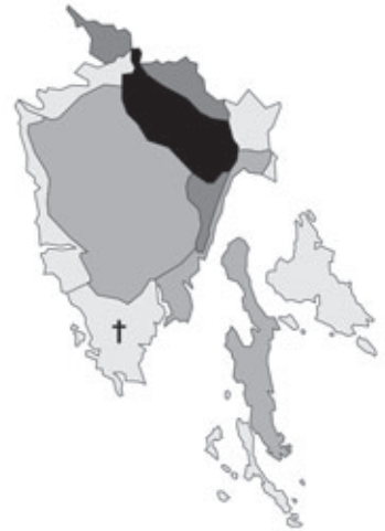
Abb. 53: Verbreitung von Genista sagittalis in Istrien; Angaben zur Häufigkeit: hellgrau = kein Vorkommen, grau = selten, dunkelgrau = zerstreut, schwarz = häufig. † ausgestorben.

Picris hieracioides Linnaeus: Auf Mauern bei Triest gemein; 10.08.1879; leg. Fritsch iun. (GZU).- Opcina, Nadelwald ...; 15.07.