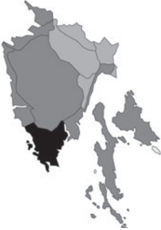
Abb. 43: Verbreitung von Dorycnium herbaceum subsp. herbaceum in Istrien; Angaben zur Häufigkeit: hellgrau = kein Vorkommen, grau = selten, dunkelgrau = zerstreut, schwarz = häufig.