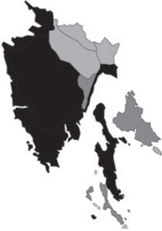
Abb. 63: Verbreitung von Hippocrepis emerus in Istrien; Angaben zur Häufigkeit: hellgrau = kein Vorkommen, grau = selten, dunkelgrau = zerstreut, schwarz = häufig.