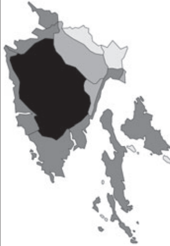
Abb. 74: Verbreitung von Lathyrus aphaca in Istrien; Angaben zur Häufigkeit: hellgrau = kein Vorkommen, grau = selten, dunkelgrau = zerstreut, schwarz = häufig.