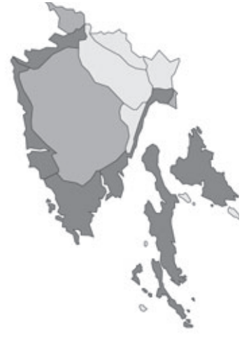
Abb. 75: Verbreitung von Lathyrus cicera in Istrien; Angaben zur Häufigkeit: hellgrau = kein Vorkommen, grau = selten, dunkelgrau = zerstreut, schwarz = häufig.