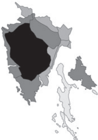
Abb. 60: Verbreitung von Genista tinctoria subsp. tinctoria in Istrien; Angaben zur Häufigkeit: hellgrau = kein Vorkommen, grau = selten, dunkelgrau = zerstreut, schwarz = häufig.

Istrien, Monte Slavnik; 03.06.1896; leg. K. Untchj (GZU).- Prosecco; Karstwiese; 21.04.1898; Herb. Palla (GZU).- Istria, Bersec, in rupibus calcareis litoris; Monte Maggiore, in prato sub Mala Uzka; 16.05.1898; 20.05.1899; leg. Evers (GZU), 2 Belege.- Carso tergestinus, in pratis montis Spaccato; 18.04.1902; leg. Evers (GZU).- Monte Maggiore; 26.05.1902; leg. Vončina (GZU-047338).- Aurisina; 13.04.[19]04; leg. Evers (GZU).- Karstheiden, Spac.; 05.05.1907; leg. F. Stolba (GZU).- Ober Klutsch an der Spac Straße; 25.04.1909; leg. F. Stolba (GZU).- Triest, Abhänge am Wege Opčina – Prosecco; 21.04.1912; leg. Vončina (GZU-047339, GZU-047340).- Triest, Furrweg Opčine – Prosecco, sonnige Abhänge; 21.04.1912; leg. Vončina (GZU-047352).- Istrien, Monte Maggiore; Bergwiesen; 05.[1]913; leg. Arbesser (GZU029501).- Karst, Tschitschenboden, Slavnik, auf Alpenwiese, zka 950 m; 21.05.1962; leg. Heske (GZU-053541).- Jugoslawia, Slovenia, Primorsko, mt. Slavnik, in graminosis, solo calcareo, cca 800 m s.m., 0449/4; 13.05.1975; leg. E. Mayer, V. Ravnik, J. Suhač & D. Trpin (GZU).- Umgebung von Triest, Karst, gegen Val Rosandra; 28.04.1985; leg. J. Poelt (GZU).- Kroatien, Istrien, an der Ostküste bei Brestova nahe der Fähre nach Cres in einer Karstheide; 31.04.1995; leg. H. Melzer (GZU-214165).