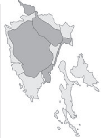
Abb. 87: Verbreitung von Lathyrus pannonicus subsp. collinus in Istrien; Angaben zur Häufigkeit: hellgrau = kein Vorkommen, grau = selten, dunkelgrau = zerstreut, schwarz = häufig.