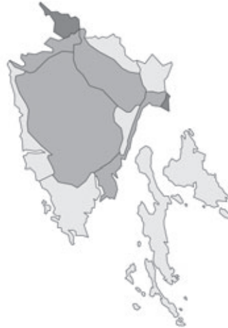
Abb. 86: Verbreitung von Lathyrus pannonicus in Istrien; Angaben zur Häufigkeit: hellgrau = kein Vorkommen, grau = selten, dunkelgrau = zerstreut, schwarz = häufig.