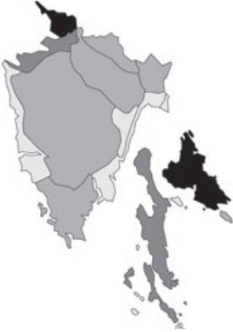
Abb. 15: Verbreitung von Astragalus monspessulanus subsp. illyricus in Istrien; Angaben zur Häufigkeit: hellgrau = kein Vorkommen, grau = selten, dunkelgrau = zerstreut, schwarz = häufig.