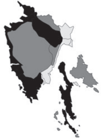
Abb. 5: Verbreitung von Anthyllis vulneraria in Istrien; Angaben zur Häufigkeit: hellgrau = kein Vorkommen, grau = selten, dunkelgrau = zerstreut, schwarz = häufig.

Cladium mariscus (Linnaeus) J.B.E.Pohl: Kroatien, Istrien, Quarner Bucht, otok Krk/isola Veglia/Insel Vögls, NE Njivice, NW-Ufer vom Omišaljskog jezero/Castelmuschio-See, N 45°10,508',