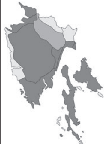
Abb. 30: Verbreitung von Colutea arborescens in Istrien; Angaben zur Häufigkeit: hellgrau = kein Vorkommen, grau = selten, dunkelgrau = zerstreut, schwarz = häufig.