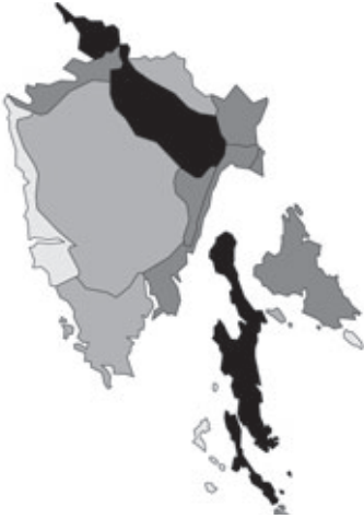
Abb. 55: Verbreitung von Genista sylvestris in Istrien; Angaben zur Häufigkeit: hellgrau = kein Vorkommen, grau = selten, dunkelgrau = zerstreut, schwarz = häufig.