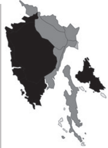
Abb. 81: Verbreitung von Lathyrus latifolius in Istrien; Angaben zur Häufigkeit: hellgrau = kein Vorkommen, grau = selten, dunkelgrau = zerstreut, schwarz = häufig.