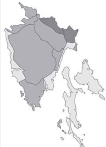
Abb. 82: Verbreitung von Lathyrus linifolius var. montanus in Istrien; Angaben zur Häufigkeit: hellgrau = kein Vorkommen, grau = selten, dunkelgrau = zerstreut, schwarz = häufig.