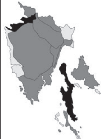
Abb. 42: Verbreitung von Dorycnium germanicum in Istrien; Angaben zur Häufigkeit: hellgrau = kein Vorkommen, grau = selten, dunkelgrau = zerstreut, schwarz = häufig.