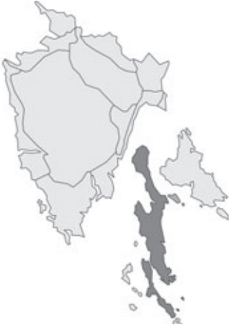
Abb. 27: Verbreitung von Chamaecytisus spinescens in Istrien; Angaben zur Häufigkeit: hellgrau = kein Vorkommen, grau = selten, dunkelgrau = zerstreut, schwarz = häufig.