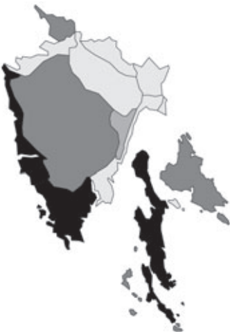
Abb. 8: Verbreitung von Anthyllis vulneraria subsp. rubriflora in Istrien; Angaben zur Häufigkeit: hellgrau = kein Vorkommen, grau = selten, dunkelgrau = zerstreut, schwarz = häufig.

E 14°33,425', 10 m alt.; Seeufer; 01.05.2007; leg. W. Mucher sen. & W. Starmühler (je 1 Dublette an GZU und WHB).