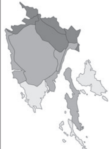
Abb. 98: Verbreitung von Lathyrus vernus in Istrien; Angaben zur Häufigkeit: hellgrau = kein Vorkommen, grau = selten, dunkelgrau = zerstreut, schwarz = häufig.