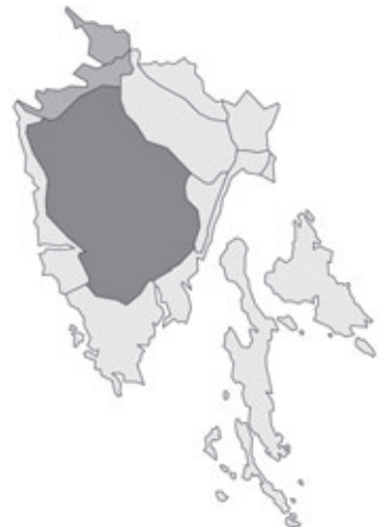
Abb. 70: Verbreitung von Laburnum anagyroides subsp. alschingeri in Istrien; Angaben zur Häufigkeit: hellgrau = kein Vorkommen, grau = selten, dunkelgrau = zerstreut, schwarz = häufig.