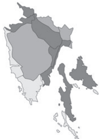
Abb. 54: Verbreitung von Genista sericea in Istrien; Angaben zur Häufigkeit: hellgrau = kein Vorkommen, grau = selten, dunkelgrau = zerstreut, schwarz = häufig.