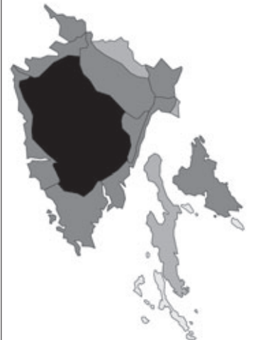
Abb. 58: Verbreitung von Genista tinctoria in Istrien; Angaben zur Häufigkeit: hellgrau = kein Vorkommen, grau = selten, dunkelgrau = zerstreut, schwarz = häufig.