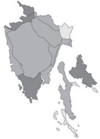
Abb. 13: Verbreitung von Astragalus glycyphyllos in Istrien; Angaben zur Häufigkeit: hellgrau = kein Vorkommen, grau = selten, dunkelgrau = zerstreut, schwarz = häufig.

Zannichellia palustris Linnaeus subsp. palustris: Kroatien, Istrien, Insel Cres/Cherso, E Cres/Cherso, Gipfelregion des