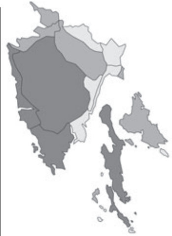
Abb. 93: Verbreitung von Lathyrus setifolius in Istrien; Angaben zur Häufigkeit: hellgrau = kein Vorkommen, grau = selten, dunkelgrau = zerstreut, schwarz = häufig.