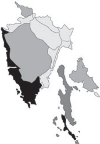
Abb. 44: Verbreitung von Dorycnium hirsutum in Istrien; Angaben zur Häufigkeit: hellgrau = kein Vorkommen, grau = selten, dunkelgrau = zerstreut, schwarz = häufig.