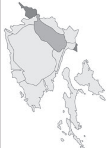
Abb. 88: Verbreitung von Lathyrus pannonicus subsp. varius in Istrien; Angaben zur Häufigkeit: hellgrau = kein Vorkommen, grau = selten, dunkelgrau = zerstreut, schwarz = häufig.