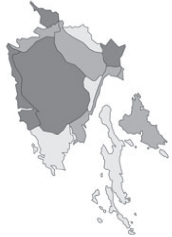
Abb. 69: Verbreitung von Laburnum anagyroides in Istrien; Angaben zur Häufigkeit: hellgrau = kein Vorkommen, grau = selten, dunkelgrau = zerstreut, schwarz = häufig.

Dysphania botrys (Linnaeus) Mosyakin & Clemants: Flora von Kroatien, Istrien, oberhalb Rijeka bei Cavle; Ruderalfläche, Erdaufschüttung; 28.08.2006; leg. K.-G. Bernhardt (WHB-46731).- Flora von Italien, Istrien, nach Basovizza, ruderaler Straßenrand, N 45°37.759', E 013°53.568', 470 m NN; 31.08.2006; leg. K.-G. Bernhardt (WHB-46733).