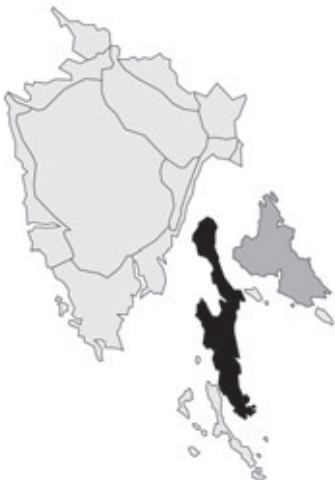
Abb. 56: Verbreitung von Genista sylvestris subsp. dalmatica in Istrien; Angaben zur Häufigkeit: hellgrau = kein Vorkommen, grau = selten, dunkelgrau = zerstreut, schwarz = häufig.

[19]06; leg. F. Stolba (GZU).- S. Rocco; 15.06.1909; leg. F. Stolba (GZU).- Trieste, zw. Obelisco und Prosecco; 05.09.[19]55; Herb. J. Eggler (GZU-100606).