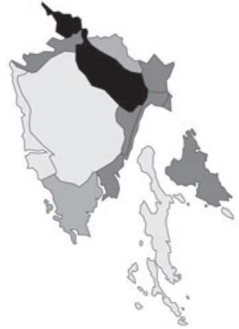
Abb. 57: Verbreitung von Genista sylvestris subsp. sylvestris in Istrien; Angaben zur Häufigkeit: hellgrau = kein Vorkommen, grau = selten, dunkelgrau = zerstreut, schwarz = häufig.

Scorzonera austriaca Willdenow: In saxosis montis Spaccati Tergesto; - ; Herb. D.H. Hoppe (GZU063516).- M e Slavnik, Litorale; - ; Herb. F. Krašan (GZU).- Bei Triest; 05.; Herb. E. Josch (GZU).- Bei Triest; 05.[1]872; Herb. Huber und Dieltl (GZU-076746).- Flora von