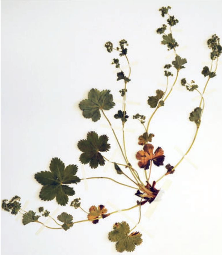
Abb. 3: A. weberi , Holotypus.

raro pilo instructa, eorum longitudo = 45–70 % longitudinis urceoli et 50–110 % longitudinis sepalorum, eorum latitudo = 17–60 % latitudinis sepalorum. Sepala semiovata ad triangula, acuta ad obtusiuscula, eorum relatio longitudo : latitudo = 0,8–1,5(–1,7), eorum longitudo 56–100 % longitudinis urceoli. Sepala glabra, raro in apice pilis singulis instructa. Achaenium 0,2–0,7 mm (= 13–40 % longitudinis) discum superans, 1,5–1,7 mm longum, latissimum sub dimidio vel ad basim, obtusum ad obtusiusculum, glabrum, eius relatio longitudo : latitudo = 1,4–1,7.