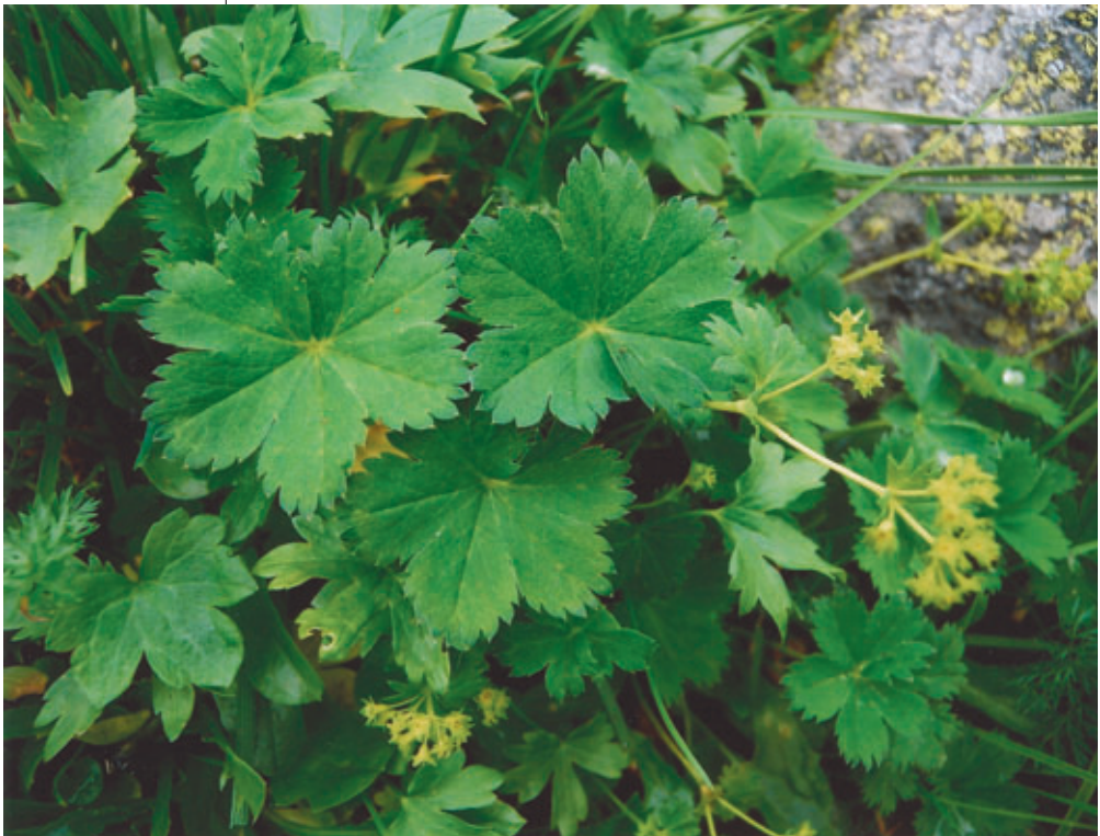
Abb. 2: A. weberi am natürlichen Standort (Typus- pflanze).