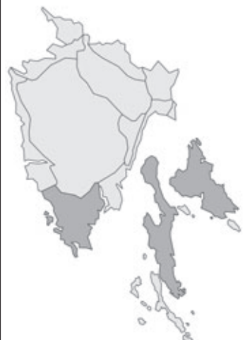
Abb. 102: Verbreitung von Najas marina in Istrien. Angaben zur Häufigkeit: hellgrau = kein Vorkommen, grau = selten, dunkelgrau = zerstreut, schwarz = häufig.