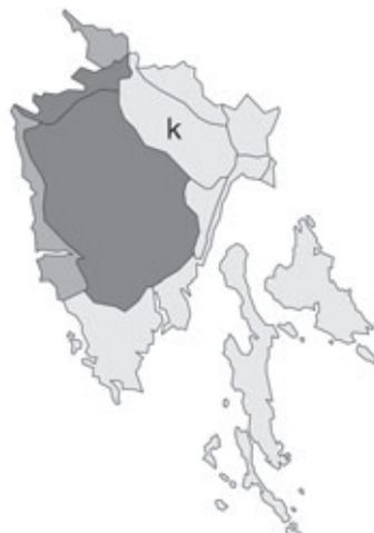
Abb. 117: Verbreitung von Leucojum aestivum subsp. aestivum in Istrien. Angaben zur Häufigkeit: hellgrau = kein Vorkommen, grau = selten, dunkelgrau = zerstreut, schwarz = häufig.