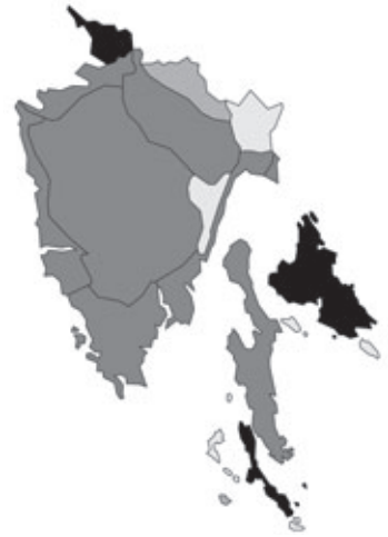
Abb. 59: Verbreitung von Geranium rotundifolium in Istrien. Angaben zur Häufigkeit: hellgrau = kein Vorkommen, grau = selten, dunkelgrau = zerstreut, schwarz = häufig.

Dictamnus albus Linnaeus: Kroatien, Istrien, Unutrašnja Istra/Istria interna/Inner-Istrien, ENE Poreč/Parenzo, S Nova vas/Villanova