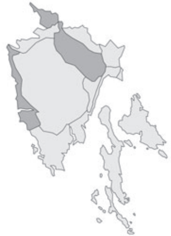
Abb. 79: Verbreitung von Gagea pratensis subsp. pratensis in Istrien. Angaben zur Häufigkeit: hellgrau = kein Vorkommen, grau = selten, dunkelgrau = zerstreut, schwarz = häufig.

Trifolium tenuiflorum M.Tenore: Kroatien, Istrien (Istria, Istra), West-Küste (Costa occidentale, Zapadna obala), S Parenzo (Poreč), Val Sessola (Zelena Laguna); Parkrasen; 11.05.2000; leg. P. Vergörer (je 1 Dublette an GZU und ZA).- Kroatien, Istrien (Istria, Istra), West-Küste (Costa occidentale, Zapadna obala), S Parenzo (Poreč), Plava Laguna, beim Hotel „Mediterran“; Trockenrasen; 05.1999; leg. P. Vergörer.- Kroatien, Istrien, West-Küste (Costa occidentale, Zapadna obala), S Parenzo (Poreč), bei Fontane (Funtana); Brache; 13.05.2000; leg. P. Vergörer (je 1 Dublette an GJO, GZU, WHB und ZA).- Kroatien,