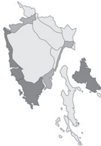
Abb. 100: Verbreitung von Albizia julibrissin var. julibrissin in Istrien. Angaben zur Häufigkeit: hellgrau = kein Vorkommen, grau = selten, dunkelgrau = zerstreut, schwarz = häufig.