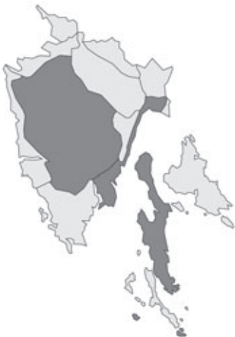
Abb. 62: Verbreitung von Pelargonium zonale in Istrien. Angaben zur Häufigkeit: hellgrau = kein Vorkommen, grau = selten, dunkelgrau = zerstreut, schwarz = häufig.

nach Košinožiči/Cosinosi/Cossinosich, 125 m alt.; Schibliksaum, Terra rossa; 09.05.2011; leg. P. Vergörer.- Kroatien, Istrien, Čićarija/Cicceria/Tschitschenboden, N Buzet/Pinguente, an der Straße von Martin/S. Martino/St. Martin nach Brest/Olmeto di Pinguente, etwa 2 km N Počikaj, N 45°26,588', E 13°58,264', 500 m alt.; Karstheide; 21.05.2011; leg. V. Mikoláš, W. Mucher sen. & W. Starmühler.