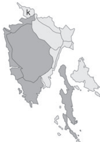
Abb. 128: Verbreitung von Sternbergia lutea subsp. lutea in Istrien. Angaben zur Häufigkeit: hellgrau = kein Vorkommen, grau = selten, dunkelgrau = zerstreut, schwarz = häufig.