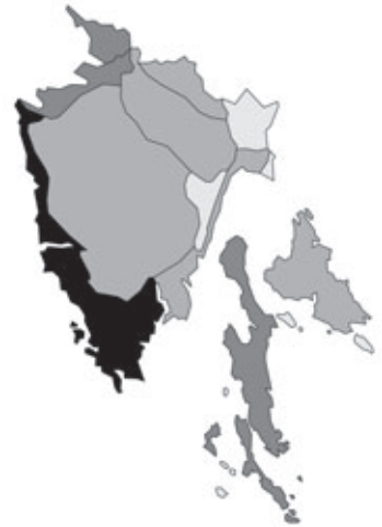
Abb. 47: Verbreitung von Geranium dissectum in Istrien. Angaben zur Häufigkeit: hellgrau = kein Vorkommen, grau = selten, dunkelgrau = zerstreut, schwarz = häufig.

Campanula portenschlagiana J.A.Schultes: Kroatien, Istrien, Zapadna obala/Costa occidentale/West-Küste, Rovinj/Rovigno/Rofein, bei der Kirche der Hl. Euphemia, N 45°05', E 13°40', 45 m alt.; kultiviert; 29.04.2006; leg. W. Starmühler (je 1 Dublette an GZU, WU und ZA).