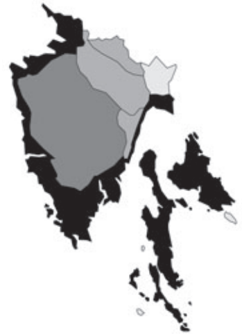
Abb. 11: Verbreitung von Asparagus acutifolius in Istrien. Angaben zur Häufigkeit: hellgrau = kein Vorkommen, grau = selten, dunkelgrau = zerstreut, schwarz = häufig.

Schoenus nigricans Linnaeus: Kroatien, Istrien, Quarner Bucht, otok Cres/isola Cherso/Insel Kherscher, Belej/Bellei; 30.04.1999; leg. B. Frajman (je 1 Dublette an GZU, IBF, WHB und ZA).- Kroatien, Istrien, Zapadna obala/Costa occidentale/West-Küste, N Poreč/Parenzo, beim Hotel "Materada", 3 m alt.; Küstenfelsen, Kalk; 30.04.2009; leg. P. Vergörer.