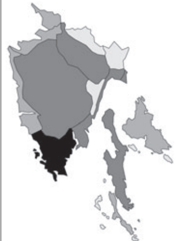
Abb. 48: Verbreitung von Geranium lucidum in Istrien. Angaben zur Häufigkeit: hellgrau = kein Vorkommen, grau = selten, dunkelgrau = zerstreut, schwarz = häufig.