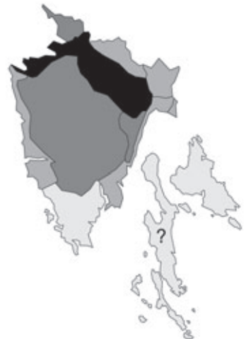
Abb. 60: Verbreitung von Geranium sanguineum in Istrien. Angaben zur Häufigkeit: hellgrau = kein Vorkommen, grau = selten, dunkelgrau = zerstreut, schwarz = häufig.