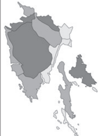
Abb. 4: Verbreitung von Alisma plantago-aquatica in Istrien. Angaben zur Häufigkeit: hellgrau = kein Vorkommen, grau = selten, dunkelgrau = zerstreut, schwarz = häufig.