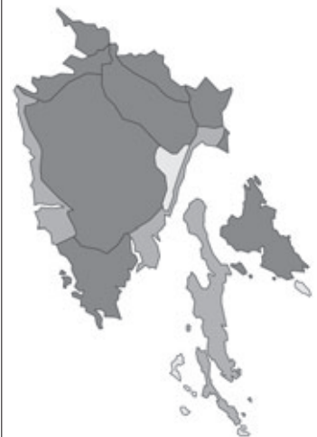
Abb. 32: Verbreitung von Euonymus europaeus in Istrien. Angaben zur Häufigkeit: hellgrau = kein Vorkommen, grau = selten, dunkelgrau = zerstreut, schwarz = häufig.