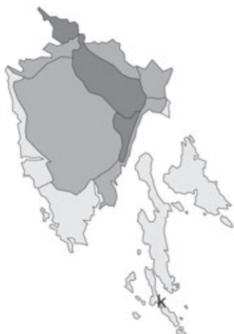
Abb. 82: Verbreitung von Lilium bulbiferum in Istrien. Angaben zur Häufigkeit: hellgrau = kein Vorkommen, grau = selten, dunkelgrau = zerstreut, schwarz = häufig.

Istrien, Zapadna obala/Costa occidentale/Westküste, S Poreč/Parenzo, Plava Laguna; Brache; 05.2001; leg. P. Vergörer (je 1 Dublette an GZU und ZA).- Kroatien, Istrien, Zapadna obala/Costa occidentale/Westküste, S Poreč/Parenzo, Plava Laguna/Val Tedole; Brache, Terra rossa; 05.2002; leg. P. Vergörer (je 1 Dublette an GJO, WU und Herb. D. Koriakov/Novosibirsk).- Kroatien, Istrien, Zapadna obala/Costa occidentale/Westküste, S Poreč/Parenzo, bei Mugeba/Monghebbo, 80 m alt.; Brache, Terra rossa; 10.06.2003; leg. P. Vergörer (je 1 Dublette an GZU und ZA).- Kroatien, Istrien, Zapadna obala/Costa occidentale/Westküste, S Poreč/Parenzo, Plava Laguna/Val Tedole, 35 m alt.; Brache; 25.04.2007; leg. P. Vergörer. – in STARMÜHLER 2010 (p. 498) als Trifolium striatum subsp. striatum .