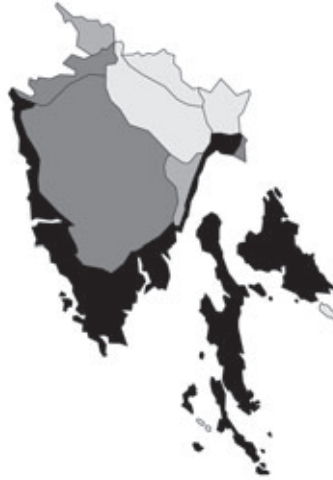
Abb. 105: Verbreitung von Smilax aspera var. aspera in Istrien. Angaben zur Häufigkeit: hellgrau = kein Vorkommen, grau = selten, dunkelgrau = zerstreut, schwarz = häufig.