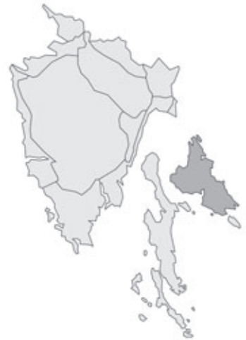
Abb. 31: Verbreitung von Callitriche truncata in Istrien. Angaben zur Häufigkeit: hellgrau = kein Vorkommen, grau = selten, dunkelgrau = zerstreut, schwarz = häufig.