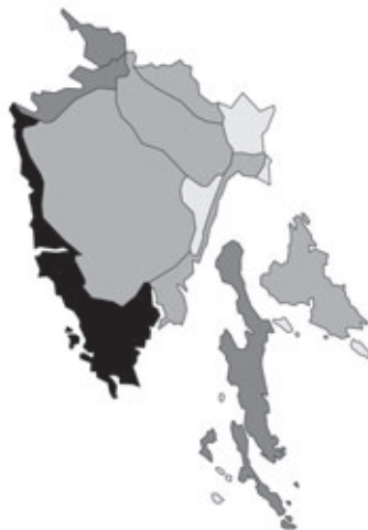
Abb. 47: Verbreitung von Geranium dissectum in Istrien. Angaben zur Häufigkeit: hellgrau = kein Vorkommen, grau = selten, dunkelgrau = zerstreut, schwarz = häufig.

Campanula portenschlagiana J.A.Schultes: Kroatien, Istrien, Zapadna obala/Costa occidentale/West-Küste, Rovinj/Rovigno/Rofein, bei der Kirche der Hl. Euphemia, N 45°05', E 13°40', 45 m alt.; kultiviert; 29.04.2006; leg. W. Starmühler (je 1 Dublette an GZU, WU und ZA).