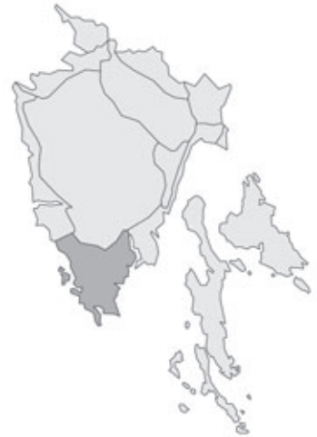
Abb. 95: Verbreitung von Nymphoides peltata in Istrien. Angaben zur Häufigkeit: hellgrau = kein Vorkommen, grau = selten, dunkelgrau = zerstreut, schwarz = häufig.