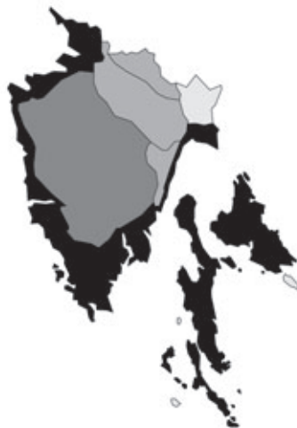
Abb. 11: Verbreitung von Asparagus acutifolius in Istrien. Angaben zur Häufigkeit: hellgrau = kein Vorkommen, grau = selten, dunkelgrau = zerstreut, schwarz = häufig.

Schoenus nigricans Linnaeus: Kroatien, Istrien, Quarner Bucht, otok Cres/isola Cherso/Insel Kherscher, Belej/Bellei; 30.04.1999; leg. B. Frajman (je 1 Dublette an GZU, IBF, WHB und ZA).- Kroatien, Istrien, Zapadna obala/Costa occidentale/West-Küste, N Poreč/Parenzo, beim Hotel "Materada", 3 m alt.; Küstenfelsen, Kalk; 30.04.2009; leg. P. Vergörer.