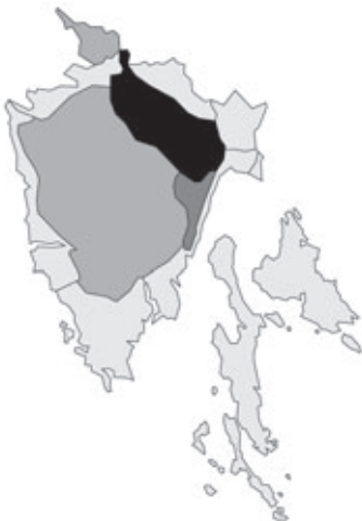
Abb. 86: Verbreitung von Lilium carnolicum in Istrien.

Angaben zur Häufigkeit: hellgrau = kein Vorkommen, grau = selten, dunkelgrau = zerstreut, schwarz = häufig.