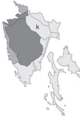
Abb. 117: Verbreitung von Leucojum aestivum subsp. aestivum in Istrien. Angaben zur Häufigkeit: hellgrau = kein Vorkommen, grau = selten, dunkelgrau = zerstreut, schwarz = häufig.