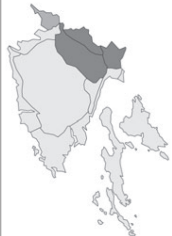
Abb. 92: Verbreitung von Veratrum album subsp. lobelianum in Istrien. Angaben zur Häufigkeit: hellgrau = kein Vorkommen, grau = selten, dunkelgrau = zerstreut, schwarz = häufig.