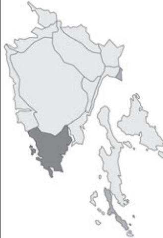
Abb. 106: Verbreitung von Smilax aspera var. mauritanica in Istrien. Angaben zur Häufigkeit: hellgrau = kein Vorkommen, grau = selten, dunkelgrau = zerstreut, schwarz = häufig.