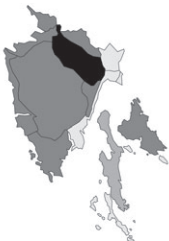
Abb. 10: Verbreitung von Anthericum ramosum in Istrien. Angaben zur Häufigkeit: hellgrau = kein Vorkommen, grau = selten, dunkelgrau = zerstreut, schwarz = häufig.

schenboden ist höchst zweifelhaft!), P. spicatum Linnaeus subsp. coeruleum R.Schultz; (7 Arten, 7 Taxa).