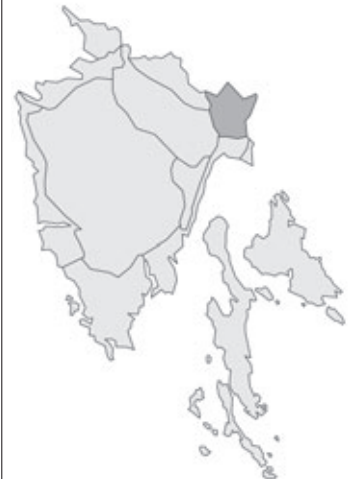
Abb. 84: Verbreitung von Lilium bulbiferum subsp. croceum in Istrien. Angaben zur Häufigkeit: hellgrau = kein Vorkommen, grau = selten, dunkelgrau = zerstreut, schwarz = häufig.