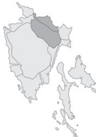
Abb. 39: Verbreitung von Elatine hexandra in Istrien. Angaben zur Häufigkeit: hellgrau = kein Vorkommen, grau = selten, dunkelgrau = zerstreut, schwarz = häufig.

Lilium martagon Linnaeus: Kroatien, Istrien, Tschitschenboden (Cicceria, Ćićarija), Veprinaz-Wald W St. Veit am Pflaumb (Fiume, Rijeka), am Weg vom Dorf Učka auf dem Poklon-Sattel zur Alpa Grande (Planik), 935 m alt.; Fagus sylvatica -Wald, 06.06.1996; leg. W. Starmühler.- Kroatien, Istrien (Istria, Istra), Tschitschenboden (Cicceria, Ćićarija), Veprinazer Wald WNW St. Veit am Pflaumb (Fiume, Rijeka), Gipfel der Alpa Grande (Planik), 1270-1276 m alt.; Fagus sylvatica -Waldrand, 06.06.1998; leg. W. Starmühler.- Kroatien, Istrien (Istria, Istra), Tschitschenboden (Cicceria, Ćićarija), Veprinazer Wald W St. Veit am Pflaumb (Fiume, Rijeka), N Vapriniz (Veprinaz, Veprinac), am Weg von Vedes (Vedež) auf den M. Orliac (Orljak), N 45°21,40', E 14°17,06', 650 m alt.; Laubmischwald mit Acer , Carpinus , Ostrya , Quercus und Tilia ; 26.06.1999; leg. H., U. & W. Starmühler (1 Dublette an GZU).- Kroatien, Istrien, Unutrašnja Istra/Istria interna/Inner-Istrien,