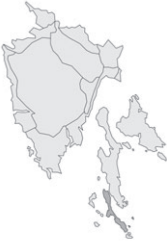
Abb. 13: Verbreitung von Asparagus densiflorus in Istrien. Angaben zur Häufigkeit: hellgrau = kein Vorkommen, grau = selten, dunkelgrau = zerstreut, schwarz = häufig.