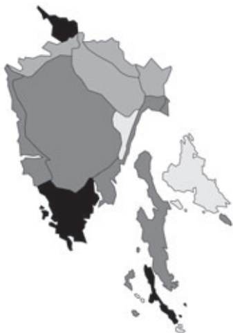
Abb. 50: Verbreitung von Geranium molle in Istrien. Angaben zur Häufigkeit: hellgrau = kein Vorkommen, grau = selten, dunkelgrau = zerstreut, schwarz = häufig.

Campanula pyramidalis Linnaeus: Kroatien, Istrien, Quarner Bucht, otok Krk/isola Veglia/Insel Vögl's, E-Küste, Vrbnik/Verbenico, N 45°04,500', E 14°40,400', 43 m alt.; Steinmauer; 16.06.2007; leg. U. & W. Starmühler.- Kroatien, Istrien, Unutrašnja Istra/Istria interna/Inner-Istrien, SE Buzet/Pinguente, Ročko polje/Polie di Rozzo/Rotzfeld, entlang der Eisenbahnstrecke, N 45°22'53,94'', E 14°04'28,62'', 385 m alt.; Fels; 30.07.2011; leg. W. Mucher sen. & W. Starmühler (je 1 Dublette an GJO, GZU, IBF, MBM, W und ZA).