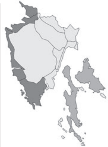
Abb. 107: Verbreitung von Cymodocea nodosa in Istrien. Angaben zur Häufigkeit: hellgrau = kein Vorkommen, grau = selten, dunkelgrau = zerstreut, schwarz = häufig.