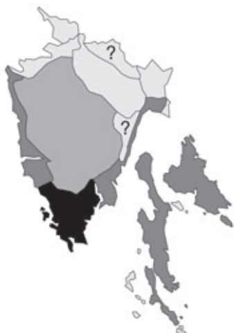
Abb. 38: Verbreitung von Colchicum neapolitanum in Istrien. Angaben zur Häufigkeit: hellgrau = kein Vorkommen, grau = selten, dunkelgrau = zerstreut, schwarz = häufig.

Cosina, E Rakitovec/Aquaviva dei Vena, W-Hang des Berges Kavčič/M. Caucizze, N 45°27,860', E 13°59,055', 672 m alt.; Karstheide; leg. V. Mikoláš, W. Mucher sen. & W. Starmühler (je 1 Dublette an GZU und LJU).