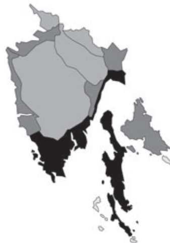
Abb. 55: Verbreitung von Geranium purpureum in Istrien. Angaben zur Häufigkeit: hellgrau = kein Vorkommen, grau = selten, dunkelgrau = zerstreut, schwarz = häufig.

Pastinaca sativa Linnaeus subsp. sativa var. sativa: Kroatien, Istrien, Unutrašnja Istra/Istria interna/Inner-Istrien, ENE Novigrad/