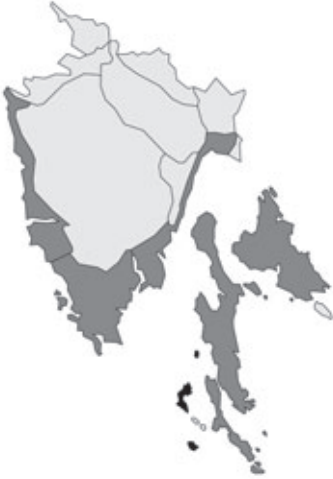
Abb. 21: Verbreitung von Asphodelus ramosus subsp. ramosus in Istrien.

Angaben zur Häufigkeit: hellgrau = kein Vorkommen, grau = selten, dunkelgrau = zerstreut, schwarz = häufig.