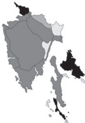
Abb. 59: Verbreitung von Geranium rotundifolium in Istrien. Angaben zur Häufigkeit: hellgrau = kein Vorkommen, grau = selten, dunkelgrau = zerstreut, schwarz = häufig.

Dictamnus albus Linnaeus: Kroatien, Istrien, Unutrašnja Istra/Istria interna/Inner-Istrien, ENE Poreč/Parenzo, S Nova vas/Villanova