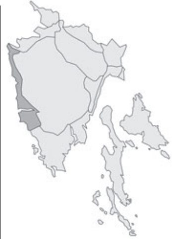
Abb. 101: Verbreitung von Albizia julibrissin var. mollis in Istrien. Angaben zur Häufigkeit: hellgrau = kein Vorkommen, grau = selten, dunkelgrau = zerstreut, schwarz = häufig.