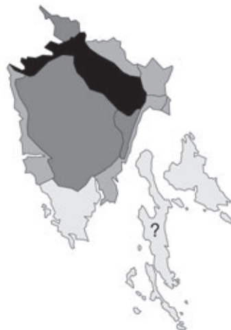
Abb. 60: Verbreitung von Geranium sanguineum in Istrien. Angaben zur Häufigkeit: hellgrau = kein Vorkommen, grau = selten, dunkelgrau = zerstreut, schwarz = häufig.