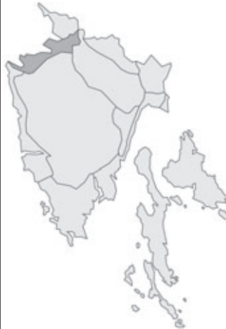
Abb. 118: Verbreitung von Leucojum vernalis in Istrien. Angaben zur Häufigkeit: hellgrau = kein Vorkommen, grau = selten, dunkelgrau = zerstreut, schwarz = häufig.