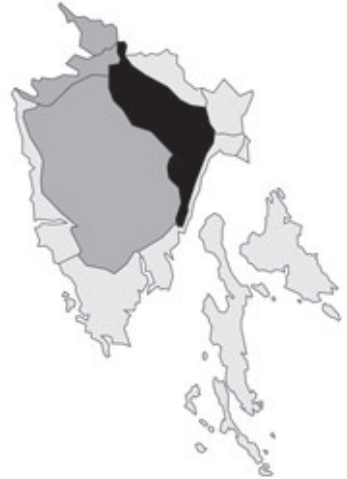
Abb. 125: Verbreitung von Narcissus radiiflorus in Istrien. Angaben zur Häufigkeit: hellgrau = kein Vorkommen, grau = selten, dunkelgrau = zerstreut, schwarz = häufig.