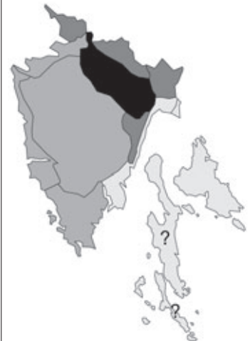
Abb. 36: Verbreitung von Colchicum autumnale in Istrien. Angaben zur Häufigkeit: hellgrau = kein Vorkommen, grau = selten, dunkelgrau = zerstreut, schwarz = häufig.