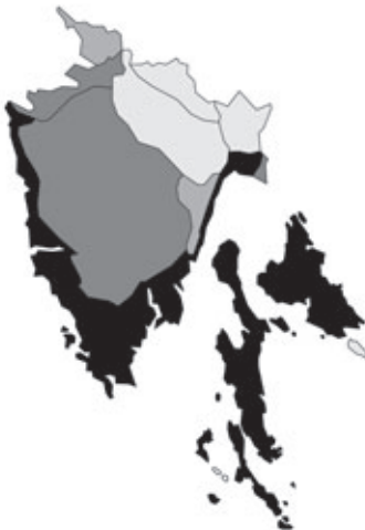
Abb. 104: Verbreitung von Smilax aspera in Istrien. Angaben zur Häufigkeit: hellgrau = kein Vorkommen, grau = selten, dunkelgrau = zerstreut, schwarz = häufig.