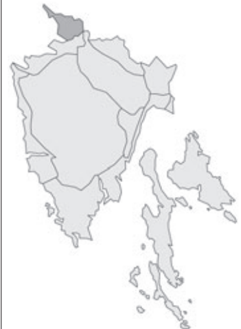
Abb. 68: Verbreitung von Elodea canadensis in Istrien. Angaben zur Häufigkeit: hellgrau = kein Vorkommen, grau = selten, dunkelgrau = zerstreut, schwarz = häufig.

Angaben zur Häufigkeit: hellgrau = kein Vorkommen, grau = selten, dunkelgrau = zerstreut, schwarz = häufig.