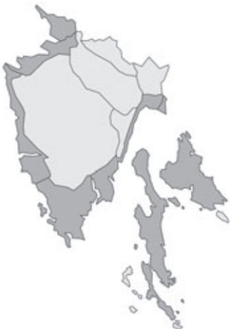
Abb. 14: Verbreitung von Asparagus maritimus in Istrien. Angaben zur Häufigkeit: hellgrau = kein Vorkommen, grau = selten, dunkelgrau = zerstreut, schwarz = häufig.

Scirpoides holoschoenus (Linnaeus) Soják subsp. australis (Linnaeus) Soják: Kroatien, Istrien, Zapadna obala/Costa occidentale/West-Küste, SSE Poreč/Parenzo, bei Mugeba/Monghebo, 50 m alt.; feuchter Graben, Terra rossa; 05.2002; leg. P. Vergörer (je 1 Dublette an GZU, MBM, W, WHB und ZA).- Kroatien, Istrien, Quarner Bucht, otok Krk/isola Veglia/Insel Vögl's, E Baška/Bescanuova, Velaluka-Bucht, beim Gasthaus, N 44°59,059', E 14°47,978', 3 m alt.; Strandwiese; 23.05.2010; leg. E. Schalk & W. Starmühler (je 1 Dublette an GJO, GZU, M, PE, WHB und ZA).