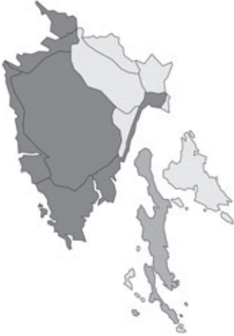
Abb. 33: Verbreitung von Euonymus japonicus in Istrien. Angaben zur Häufigkeit: hellgrau = kein Vorkommen, grau = selten, dunkelgrau = zerstreut, schwarz = häufig.