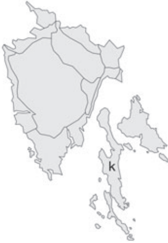
Abb. 97: Verbreitung von Acacia horrida in Istrien. Angaben zur Häufigkeit: hellgrau = kein Vorkommen, grau = selten, dunkelgrau = zerstreut, schwarz = häufig.