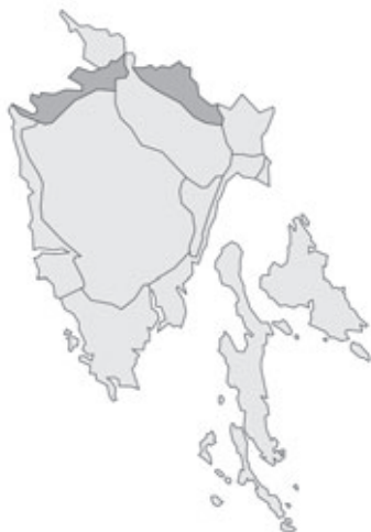
Abb. 29: Verbreitung von Callitriche palustris in Istrien. Angaben zur Häufigkeit: hellgrau = kein Vorkommen, grau = selten, dunkelgrau = zerstreut, schwarz = häufig.