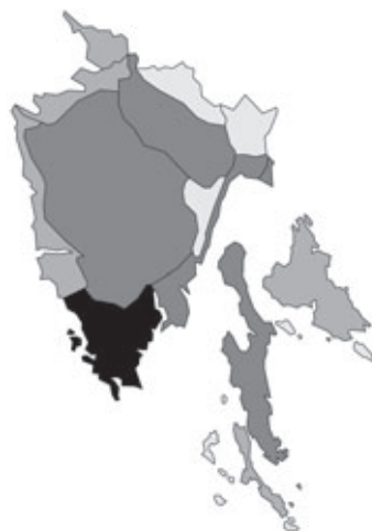
Abb. 48: Verbreitung von Geranium lucidum in Istrien. Angaben zur Häufigkeit: hellgrau = kein Vorkommen, grau = selten, dunkelgrau = zerstreut, schwarz = häufig.