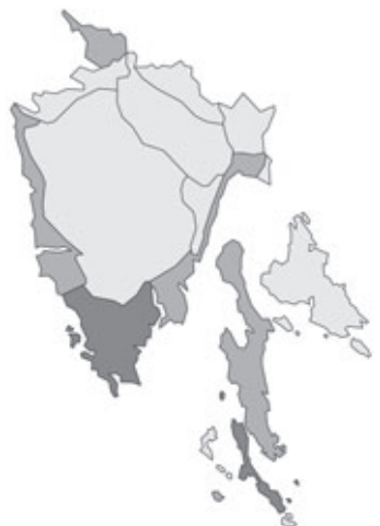
Abb. 126: Verbreitung von Narcissus tazetta subsp. italicus in Istrien. Angaben zur Häufigkeit: hellgrau = kein Vorkommen, grau = selten, dunkelgrau = zerstreut, schwarz = häufig.