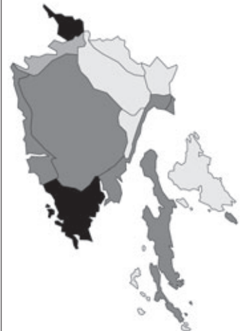
Abb. 52: Verbreitung von Geranium molle subsp. molle in Istrien. Angaben zur Häufigkeit: hellgrau = kein Vorkommen, grau = selten, dunkelgrau = zerstreut, schwarz = häufig.