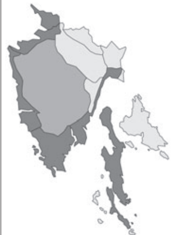
Abb. 44: Verbreitung von Erodium malacoides in Istrien. Angaben zur Häufigkeit: hellgrau = kein Vorkommen, grau = selten, dunkelgrau = zerstreut, schwarz = häufig.