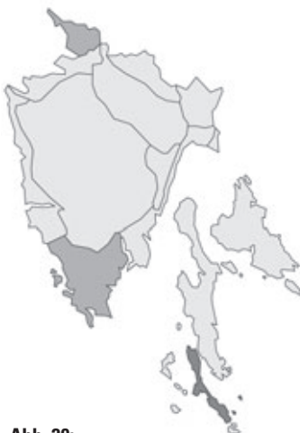
Abb. 20: Verbreitung von Asphodelus fistulosus s.str. in Istrien. Angaben zur Häufigkeit: hellgrau = kein Vorkommen, grau = selten, dunkelgrau = zerstreut, schwarz = häufig.