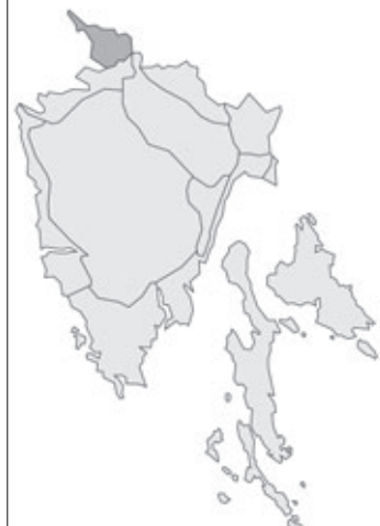
Abb. 120: Verbreitung von Narcissus jonquilla in Istrien. Angaben zur Häufigkeit: hellgrau = kein Vorkommen, grau = selten, dunkelgrau = zerstreut, schwarz = häufig.