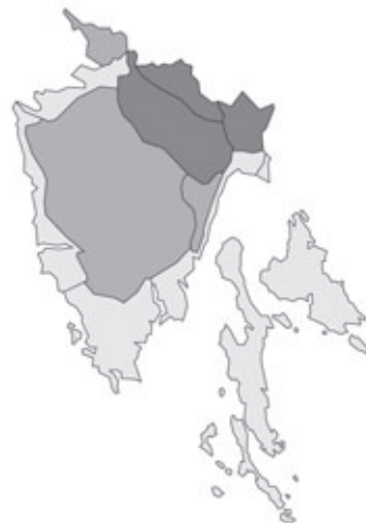
Abb. 19: Verbreitung von Asphodelus albus s.str. in Istrien. Angaben zur Häufigkeit: hellgrau = kein Vorkommen, grau = selten, dunkelgrau = zerstreut, schwarz = häufig.

Sorbus mayeri × S. pannonica: Kroatien, Istrien, Čičarija/Cicceria/Tschitschenboden, N Buzet/Pinguente, SE-Hang des Berges Žbevnica/M. Sbeunizza, N 45°27,405', E 14°00,918', 888 m alt.; Wald-