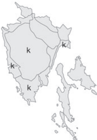
Abb. 22: Verbreitung von Caesalpinia gilliesii in Istrien.

Angaben zur Häufigkeit: hellgrau = kein Vorkommen, grau = selten, dunkelgrau = zerstreut, schwarz = häufig.