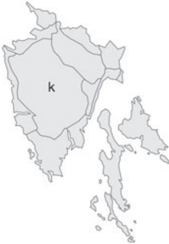
Abb. 115: Verbreitung von Agapanthus africanus in Istrien. Angaben zur Häufigkeit: hellgrau = kein Vorkommen, grau = selten, dunkelgrau = zerstreut, schwarz = häufig.