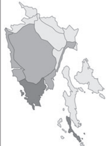
Abb. 96: Verbreitung von Acacia dealbata in Istrien. Angaben zur Häufigkeit: hellgrau = kein Vorkommen, grau = selten, dunkelgrau = zerstreut, schwarz = häufig.