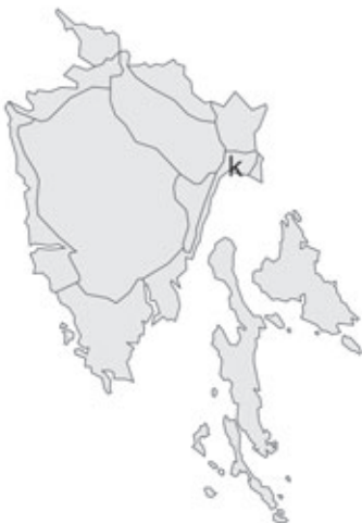
Abb. 98: Verbreitung von Acacia suaveolens in Istrien. Angaben zur Häufigkeit: hellgrau = kein Vorkommen, grau = selten, dunkelgrau = zerstreut, schwarz = häufig.