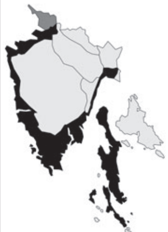
Abb. 114: Verbreitung von Zostera noltii in Istrien.

Angaben zur Häufigkeit: hellgrau = kein Vorkommen, grau = selten, dunkelgrau = zerstreut, schwarz = häufig.