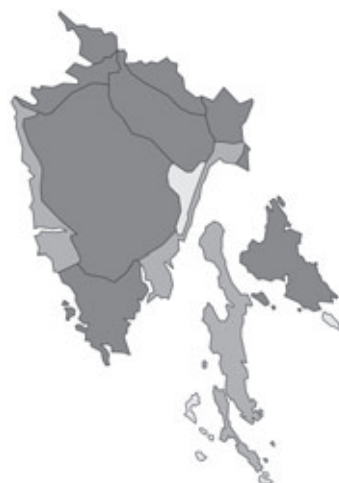
Abb. 32: Verbreitung von Euonymus europaeus in Istrien. Angaben zur Häufigkeit: hellgrau = kein Vorkommen, grau = selten, dunkelgrau = zerstreut, schwarz = häufig.