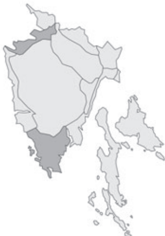
Abb. 45: Verbreitung von Erodium moschatum in Istrien. Angaben zur Häufigkeit: hellgrau = kein Vorkommen, grau = selten, dunkelgrau = zerstreut, schwarz = häufig.