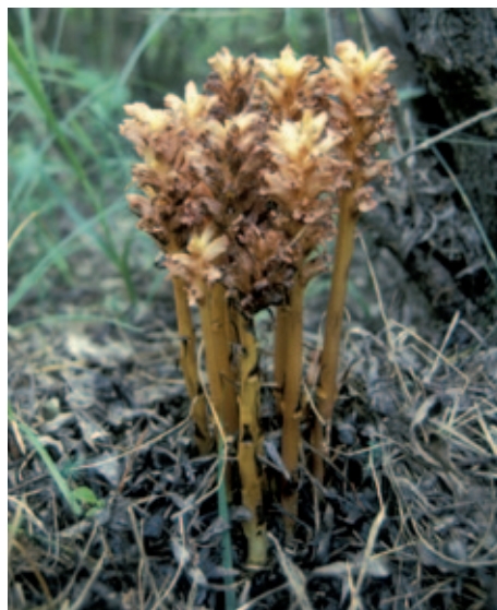
Abb. 16: Orobanche lucorum (Syn. O. berberidis ) wächst oft in kleineren Gruppen. Rosental, Drau-Au nördlich Gotschuchen bei St. Margarethen i. Ros. 4. Juli 1998.