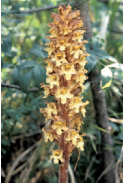
Abb. 3: Orobanche laserptii-sileris (Bergkümmel-Sommerwurz). Weichseltal bei Baden, Niederösterreich.