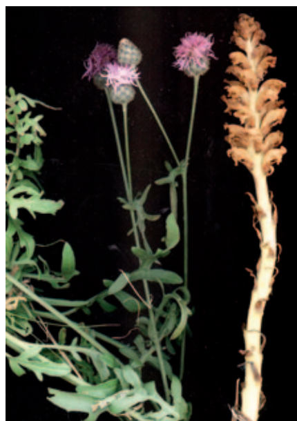
Abb. 13: Orobanche elatior (Groß-Sommerwurz) parasitiert auf Centaurea scabiosa . Im Mölltal wurde sie in einer sekundären Magerwiese auf einer südexponierten Straßenböschung in Apriach-Groß Kirchheim gesammelt und erstmals für Kärnten nachgewiesen. 23. Juli 2010. teste J. Zázvorka.

Verbreitung: alle Länder (FISCHER et al. 2008). In Kärnten relativ weit verbreitet: 12 Fundpunkte seit 1945, davon in 4 Quadranten in NW-Kärnten (Hohe Tauern) (HARTL et al. 1992: 259).