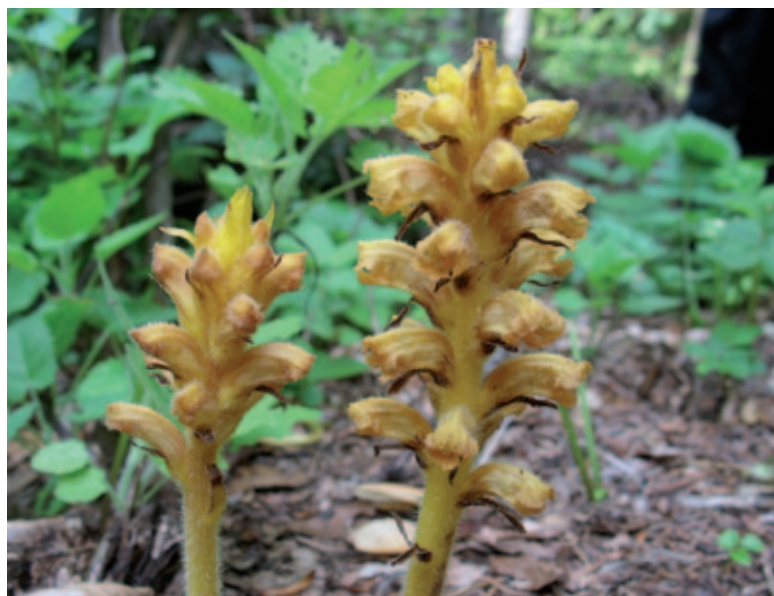
Abb. 18: Orobanche salviae , die Salbei-Sommerwurz, wurde u. a. in den St. Pauler Bergen zwischen Rabensteiner und Konzehalt in einem thermophilen Buchenwald und neuerdings in Feistritz im Rosental nachgewiesen. 29. Juni 2007.

• Feistritz i. Rosental, Straßenböschung östlich der ehem. Bären-Batterie-Fabrik, auf Salvia glutinosa (obs. und Fotobeleg 17. 7. 2013). Mehrere Pflanzen. Neu für Quadrant 9451/3. In der näheren Umgebung auch O. flava (auf Petasites paradoxus ). Am Rückweg von der Klagenfurter Hütte war die Straßenböschung mit sämtlichen zuvor beobachteten Sommerwurz-Arten und deren Wirtspflanzen sauberlich gemäht.