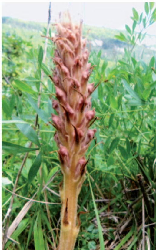
Abb. 2: Orobanche cf. laserpitii-sileris (Bergkümmel-Sommerwurz), noch nicht vollständig aufgeblüht. Etwa 2 Wochen später konnte keine einzige Bergkümmel-Sommerwurz mehr gefunden werden. 5. Juni 2012.

Anmerkung: auf den steilen, wärmebegünstigten Hängen nahe der Ringmauer in den Karnischen Alpen (westlich der Rattendorfer Alm) und auf der Schneiderwiese SW der Watschiger Alm sollte in Massenbeständen von Laserpitium siler (unterhalb/oberhalb des Bestandes von Eryngium alpinum ) in Zukunft verstärkt auf das mögliche Vorkommen von Orobanche laserpitii-sileris geachtet werden.