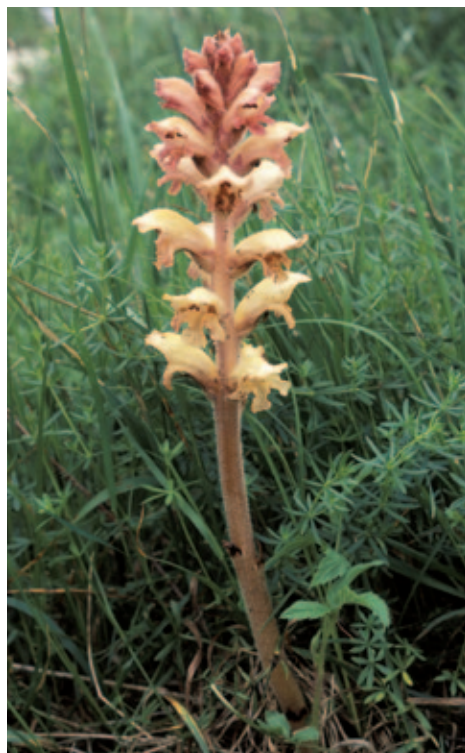
Abb. 11: Orobanche caryophyllacea (Labkraut-Sommerwurz) parasitiert meist auf Galium -Arten . NSG Hackelsberg bei Jois (Burgenland).

Wirte: auf Teucrium -Arten – besonders Teucrium chamaedrys und T. montanum – (KREUTZ 1995: 144, PUSCH 2009: 68). In Kärnten wurde O. teucrii vom Autor bisher nur auf Teucrium montanum beobachtet.