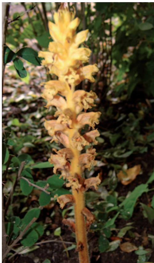
Abb. 17: Orobanche lucorum schmarotzt vor allem auf Ber- beritze ( Berberis vulgaris ).

Literaturangabe: auf Berberis und Rubus schmarotzend; Wald bei Gurnitz (PACHER 1884: 129).