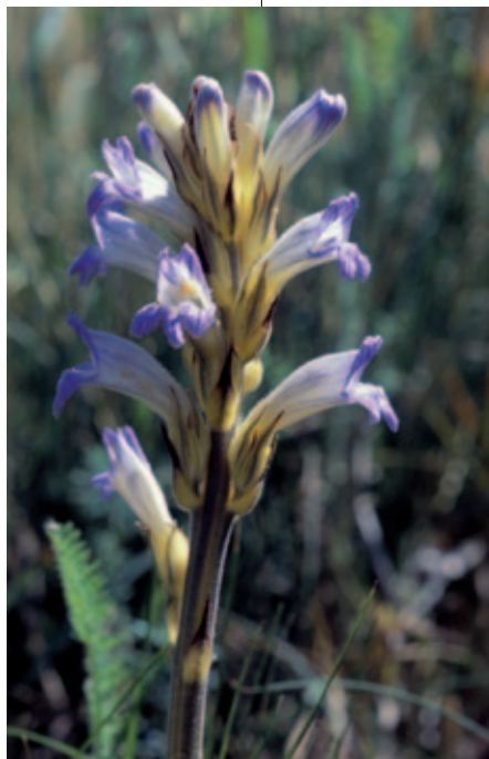
Abb. 9: Phelipanche purpurea (Syn. Orobanche purpurea ) Violett-Blauwürger, Violette Sommerwurz parasitiert in Kärnten vor allem auf Achillea millefolium . Das vorliegende Foto wurde im NSG Hackelsberg bei Jois (Burgenland) aufgenommen.

Gefährdung: Stark gefährdet: NIKLFELD & SCHRATT-EHRENDORFER (1999); FISCHER et al. (2008: 774). In Kärnten: Gefährdungsstufe 1 = vom Aussterben bedroht: KNIELY et al. (1995).