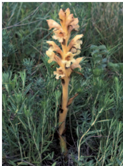
Abb. 12: Orobanche teucrii vom Ruster Hügel auf Teucrium montanum .