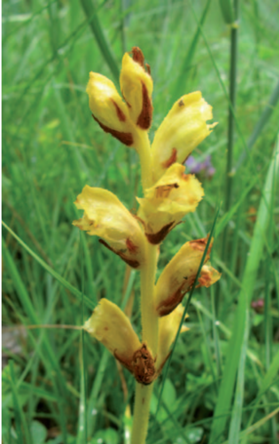
Abb. 19: Eine bisher nicht bestimmte gelb gefärbte Sippe einer Sommerwurz ( Orobancha spec.). Aufgenommen in einer Feuchtwiese im nördlichen Teil des Naturschutzgebietes Finkensteiner Moor südwestlich des Faaker Sees. 22. 6. 2007.