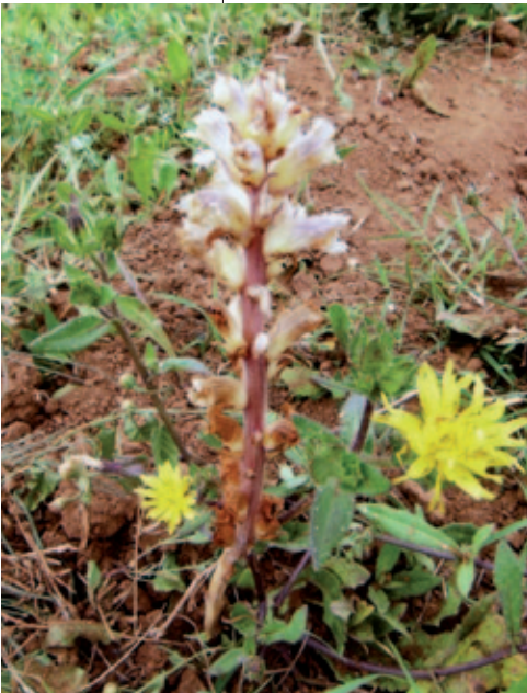
Abb. 10: Orobanche picridis parasitiert am häufigsten auf Picris hieracioides , selten auf Daucus carota . Istrien, Orsera/ Vrsar, Rasen (anthropogen), nahe des Hafens. 3. Juni 2011.

Da auf keinem der gesehenen Herbarbelege von O. picridis im KL ein Wirt notiert bzw. eine Pflanze ausgegraben worden ist und weder vom Schlossberg in Griffen noch von Wunderstätten Vorkommen von Picris hieracioides bekannt sind (vgl. HARTL et al. 1992; EBERWEIN 2005: 296), sollte an diesen Fundorten verstärkte Aufmerksamkeit auf das Vorkommen von O. picridis und ihrer möglichen Wirte gelegt werden. Daucus carota als Wirt kann auch in Kärnten derzeit nicht völlig ausgeschlossen werden.