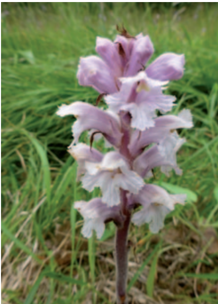
Abb. 4: Die äußerst seltene Sommerwurz Orobanche lutea var. porphyrea wurde erst in jüngster Zeit in der Weinitzen im Gebiet der Schütt entdeckt. 12. Juni 2013.