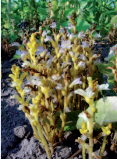
Abb. 7: Phelipanche ramosa (Syn. Orobanchae ramosa ) (Hanf-Blauwürger). Die in Österreich bereits als verschollen gegolten Sippe wurde vom Autor an zwei Stellen nachgewiesen. P. ramosa parasitiert v. a. auf verschiedenen Kulturpflanzen, z. B. auf Nicotiana tabacum .