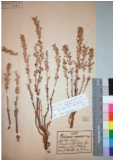
Abb. 8: Herbarbeleg von Phelipanche ramosa ( Phelipaea ramosa ) auf Hanf. Gesammelt in „Goritschitz nördl. v. Victring, 7. September 1890 leg. Sabidussi“. Die Art hat oft verzweigte, (ästige) Blütenstände.

Wirte: Schmarotzt vorwiegend auf Lamium -Arten. In Südeuropa hauptsächlich auf verschiedenen Kulturpflanzen (z. B. auf Nicotiana tabacum (Abb. 7), Cannabis sativa (Abb. 8), Solanum lycopersicum , S. tuberosum und Zea mays ) und kann dann große Schäden anrichten (KREUTZ 1995: 44). Seit der Aufgabe des Hanfanbaues heute nur noch in Tabakfeldern; adventiv (meist in gärtnerischen Kulturen) auch auf Kohlrabi ( Brassica oleracea ) sowie anderen Kultur- und Zierpflanzen, wie z. B. Armoracia rusticana , Pelargonium , Datura stramonium , Tropaeolum , Zinnia und Chrysanthemum (PUSCH 2009: 19).