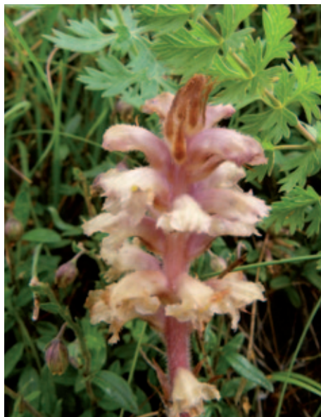
Abb. 15: Im Mölltal wächst O. alsatica subsp. libanotidis (Syn. Orobanche bartlingii ), die Heilwurz-Sommerwurz oder Bartling-Sommerwurz in einem Halbtrockenrasen oberhalb der Apriacher Stockmühlen nahe Heiligenblut. 10. Juli 2012.

Verbreitung in Kärnten: zwei rezente Fundorte (9448/1 und 2) an der unteren Gail sowie sieben weitere Funde vor 1900. Vor allem in W-Kärnten (vgl. Karte in HARTL et al. 1992).