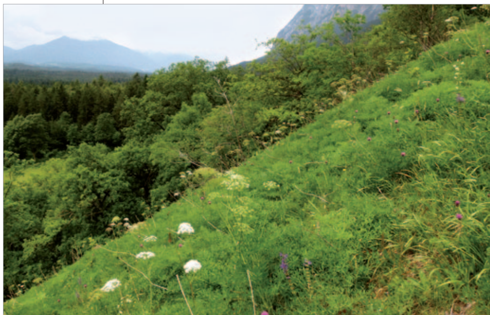
Abb. 1: Die „Weinitzen“ im Bergsturzgebiet der Villacher Alpe (Dobratsch). Blick gegen Westen. Der z. T. steil geneigte Hang ist mit einzelnen Stiel-Eichen bestockt. Die Krautschicht wird von Laserpitium siler dominiert. Cirsium pannonicum und Veronica teucrium kommen hier vereinzelt, Ophys insectifera und Orobanche laserpitii-sileris sehr selten vor. 6. Juni 2011.

Östlich der Ortschaft Oberschütt bei Arnoldstein konnte die in Österreich sehr seltene (FISCHER et al. 2008:773) und für Kärnten neue Sommerwurz-Art O. laserpitii-sileris auf der Weinitzen nachgewiesen werden (KG Federaun, N 46°34'29,4'', E 13°45'53,6'', 576 m ü. A., Quadrant der Florenkartierung: 9448/2). Die Bergkümmel-Sommerwurz wurde am 6. Juni 2011 während einer gezielten Suche erstmals auf dem SSW exponierten Hang, der in der Krautschicht nahezu ausschließlich von Laserpitium siler bewachsen ist (Abb. 1), fotografiert, und ein Exemplar gesammelt (vgl. FRANZ W. R. & LEUTE G. H. 2013).