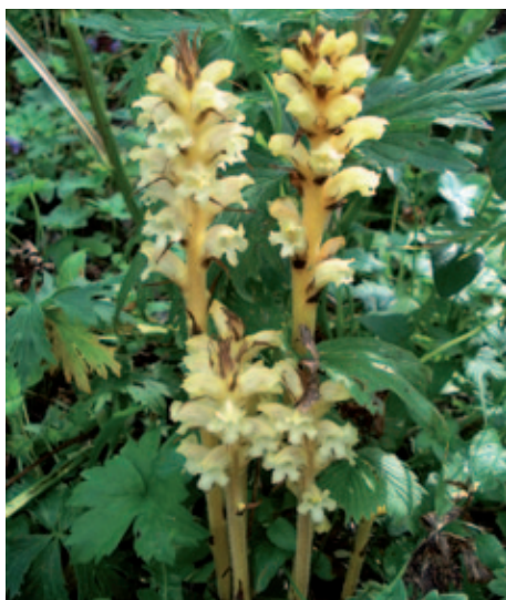
Abb. 6: Orobanch lycoctoni schmarotzt nur auf Aconitum lycoctonum oder auf A. lupicida . Die Eisenhut-Sommerwurz wurde 2012 im Wolayer-Tal und 2013 auch im Naturschutzgebiet „Wolayersee und Umgebung“ zwischen Unterer und Oberer Valentinalm gefunden.