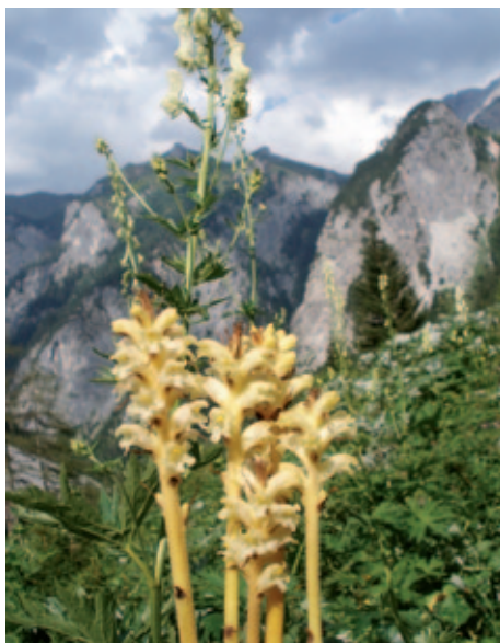
Abb. 5: Erst kürzlich konnte die Eisenhut Sommerwurz ( Orobanch lycoctoni ) in Österreich (Kärnten/Steiermark) nachgewiesen werden (SCHÖNSWETTER et al. in Druck). Die Art wächst im Wolayer-Tal u. a. in einer Kalkschutt-Hochstaudenflur. 9. Juli 2012.

Standort: meist auf sandigen Äckern, besonders in Hackkulturen, an Straßenrändern in Unkrautgesellschaften und ruderal beeinflussten Wiesen. Basenreiche, oft kalkhaltige, sandige oder lehmige Böden (KREUTZ 1995: 44). In Kärnten wurde P. ramosa am Ufer des Feistritz-baches östlich Dellach im Drautal auf humusarmer Protorendsina über feingrusigem Karbonatgestein beobachtet sowie in einem Magerrasen in Rottenstein (Drautal) gesammelt (siehe Herbarbeleg).