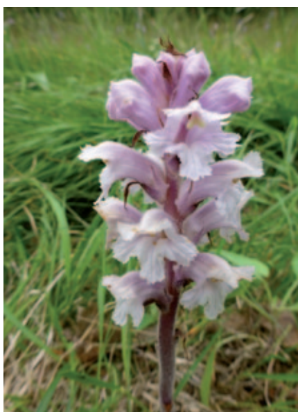
Abb. 4: Die äußerst seltene Sommerwurz Orobanche lutea var. porphyrea wurde erst in jüngster Zeit in der Weinitzen im Gebiet der Schütt entdeckt. 12. Juni 2013.