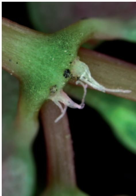
Abb. 8: Cyathien von Euphorbia humifusa : links mit gespreizten Griffeln, rechts mit Staubblatt.

Euphorbia maculata tritt nicht nur in Europa, sondern in noch viel stärkerem Maße in ihrer Heimat Nordamerika als lästige Ruderalpflanze in Erscheinung. Unzählige US-amerikanische Webseiten beschäftigen sich mit schädlichen Auswirkungen der Pflanzen und