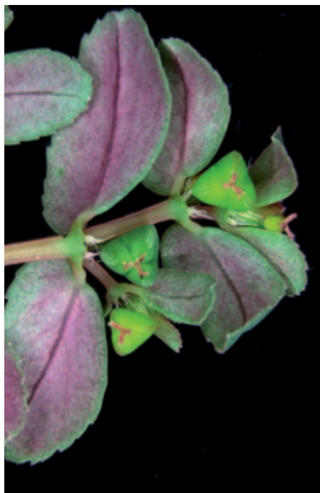
Abb. 7: Kahle Blattunter- seiten und Früchte von Euphorbia humifusa .

Trotz zahlreicher Funde und Zitierungen wird Euphorbia maculata manchmal auch in jüngster Literatur noch als selten bezeichnet, z. B. bei FISCHER et al. (2008). MELZER (1967, 1968) nennt sie vor bald 50 Jahren mehrfach auf Bahnanlagen in der Steiermark und Kärnten, z. B. bei Greifenburg und Tainach-Stein. In den folgenden Jahren wurde die Art auf den Friedhöfen der Städte Klagenfurt und St. Veit an der Glan sowie im Botanischen Garten Klagenfurt entdeckt. Bis