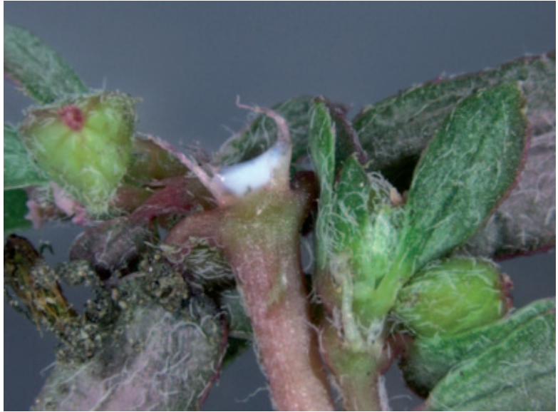
Abb. 1: Der bei Verletzungen austretende giftige Milchsaft ist typisch für Euphorbia -Arten und der Grund, weshalb man sie Wolfsmilch nennt.