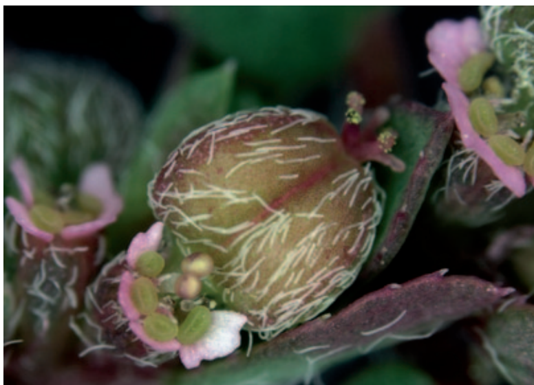
Abb. 4: Euphorbia maculata : Frucht, hellgrüne Drüsen mit rosa Anhängseln.

Allgemein betrachtet brauchen beide Arten offenen Boden und scheinen sich auch in Europa an kiesigen Wegen, Friedhöfen, Bahnanlagen und Steingärten (z. B. in botanischen Gärten) am wohlsten zu fühlen. OBERDORFER (2001) beschreibt sie als typisch für Trittgemeinschaften,