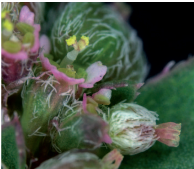
Abb. 5: Cyathien von Euphorbia maculata : links mit Staubblatt, rechts mit junger, behaarter Frucht.

In London wurde Euphorbia maculata mindestens seit dem Jahr 1660 in einem botanischen Garten kultiviert (HEGI 1924). Dennoch spielt die Art auf den Britischen Inseln bisher noch keine signifikante Rolle als invasiver Neophyt (STACE 1997). Auch auf dem europäischen Festland wurde sie schon nachweislich vor über 300 Jahren in botanischen Gärten kultiviert, z. B. in Amsterdam im Jahr 1689 (THELLUNG 1917). Vor weit über 100 Jahren schaffte Euphorbia maculata den Sprung aus der Kultur in die Wege, Plätze und Pflasterritzen dieser Gärten und schließlich in die umliegenden Stadtgebiete. Im deutschen Rheinland tritt sie bereits 1877 an Ruderalstellen auf (HEGI 1924). Über die Situation in Deutschland geben HÜGIN & HÜGIN (1997) eine gute Übersicht.