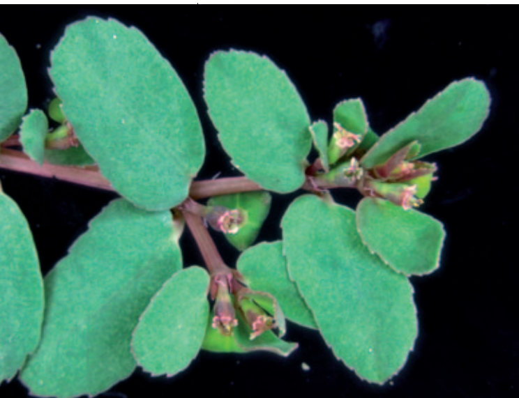
Abb. 6: Euphorbia humifusa trägt keine Blattflecken.

tirol, Euphorbia maculata jedoch immer noch nicht (FRITSCH 1909). Diese Angabe deckt sich mit DALLA TORRE et SARNTHEIN (1909), die Euphorbia humifusa als ein in der Stadt Meran auftretendes „Unkraut in Gärten und an Wegrändern stellenweise in zahlloser Menge“ bezeichnen. In der dritten Auflage von FRITSCH (1922) werden schließlich beide Arten