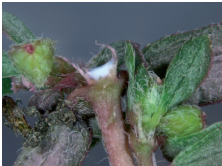
Abb. 1: Der bei Verletzungen austretende giftige Milchsaft ist typisch für Euphorbia -Arten und der Grund, weshalb man sie Wolfsmilch nennt.