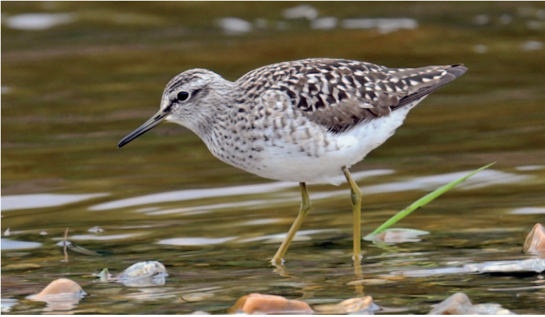
Abb. 6: Wird das Flutungs- areal ein Hotspot für durchziehende Vogelarten, wie z. B. zahlreiche Watvogelarten? Bereits im Sommer 2016, also noch bei den Bauarbeiten, konnten auf den frisch entstandenen Lacken vermehrt Limikolen wie der Bruchwasserläufer beobachtet werden!