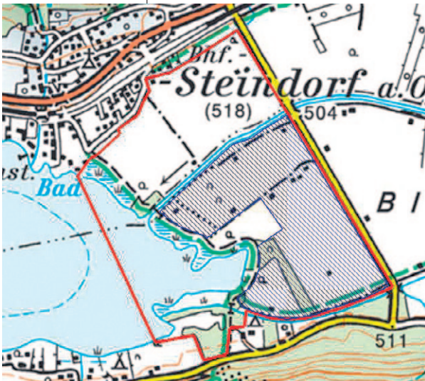
Abb. 2: Der Untersuchungs- bereich bei Steindorf (rote Linie) beinhaltet das Europaschutz- gebiet Tiebelmün- dung und angren- zende Flächen (blaue Schraffie- rung). Das geplante Flutungsareal (74,9 ha) befindet sich im östlichen, mit einem Damm (strichlierte Linie) vom See getrennten Bereich des Untersuchungs- gebietes.

Entwicklung ihrer Bestände kann ein guter Rückschluss auf die gesamte Biozönose (Gemeinschaft von Organismen verschiedener Arten in einem abgrenzbaren Lebensraum) gewonnen werden (z. B. TEMPLE & WIENS 1989).