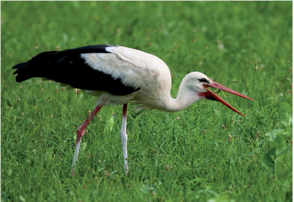
Abb. 7: Bereits 2016 baute ein Weißstorch-Paar einen Horst nahe der Tiebelmündung, zu einer Brut kam es allerdings nicht. Kann die Flutung die Nahrungsbasis für eine dauerhafte Ansiedelung maßgeblich unterstützen?

Das geplante Flutungsprojekt führt zu einer fundamentalen Veränderung der Landschaft und des Naturhaushaltes im Untersuchungsgebiet. Ein ehemals entwässertes und nachfolgend agrarisch genutztes Moor-