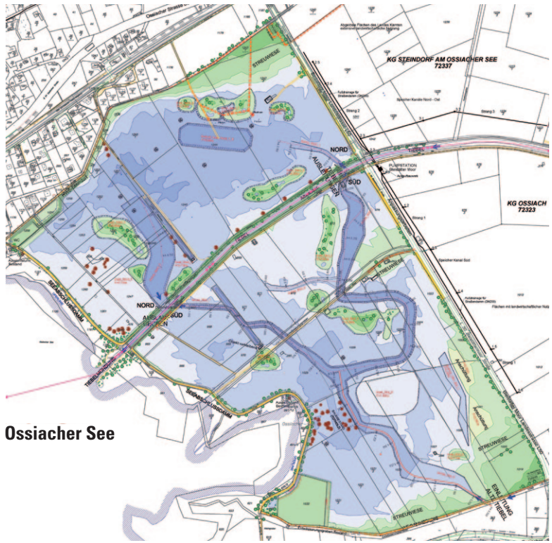
Abb. 1 a und b: Angestrebte Entwicklung im Rahmen der Bleistätter Moor-Flutung. (a) Ausführungsplan (Grafik: P. Krameter, Wasserverband Ossiacher See) und (b) Visualisierung (Ingenieurbüro Bolt). Alle in (b) östlich (im Bild links) des Damms (durch die helle Linie des Schotterwegs erkennbar) gelegene Gebiete sind heute noch trocken: Stand Sommer 2016!

gesehen, nach wie vor intensive Landwirtschaft betrieben wird, wurde im Westen von der Kärntner Landesregierung per 23. Dezember 2010 das Europaschutzgebiet (ESG) Tiebelmündung (LGBl. Nr. 94/2010 idF 28/2012) verordnet. Dieses umfasst 62,5 ha, welche durch einen Damm grob in zwei Teilareale, einen westlich gelegenen Seeteil (mit Offenwasser, Binsen, Schilf etc.) und einen östlich gelegenen Offenlandteil (mit Brachflächen, Wiesen, Weiden und Äckern), getrennt sind. Kleinere Schwarz-Erlenbestände kommen beiderseits des Damms vor. Alle diese Flächen umfasst mit 289 ha das wesentlich größere Landschaftsschutzgebiet Ossiacher See-Ost (vgl. MOHL et al. 2008).