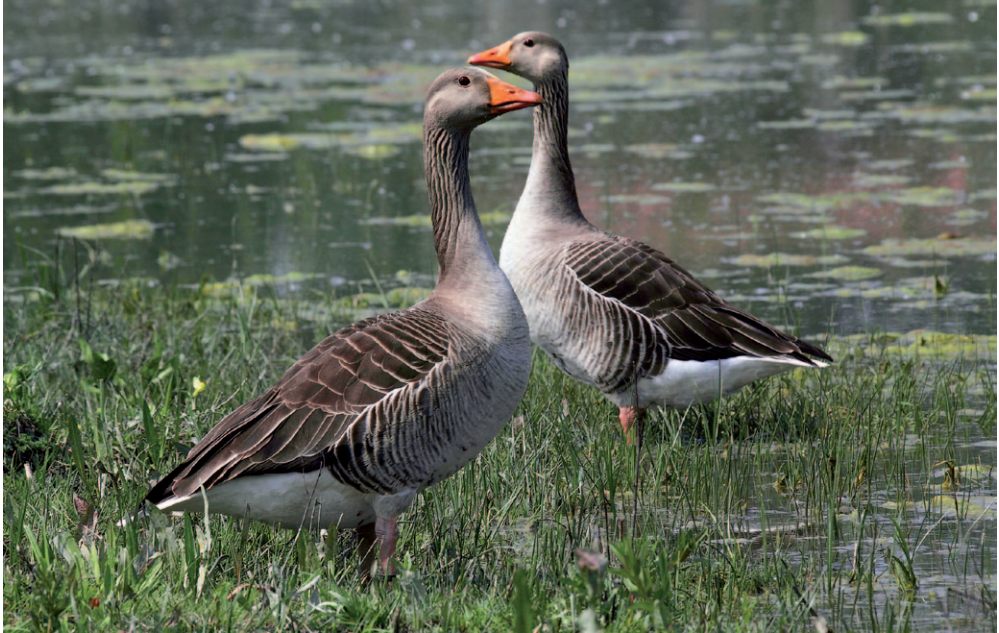
Abb. 8: Wird es durch die Flutung zur Ansie- delung ganz neuer Brutvogelarten, z. B. der Graugans, kommen?

gebiet wird wieder in ein Feuchtgebiet umgewandelt. Es ist zu erwarten, dass der Eingriff massive Änderungen in der Vogelwelt nach sich zieht, wobei aus naturschutzfachlicher Sicht von einer positiven Entwicklung auszugehen ist. Hier werden die Hypothesen aufgestellt, dass sich sowohl Arten- als auch Individuenzahlen signifikant erhöhen werden, und zwar bei Brutvögeln und Zugvögeln gleichermaßen. Namentlich die Gilde der Feuchtgebiets-Bewohner (typische Wasservögel, aber z. B. auch Wiesenlimikolen, im Schilf übernachtende Arten wie Stare, Schwalben, Stelzen etc.) wird von der Projektumsetzung substantiell profitieren.