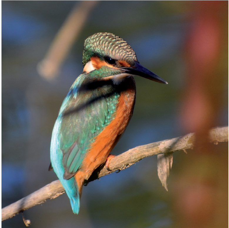
Abb. 5: 2016 brütete der Eisvogel nicht mehr in der Tiebelmündung, obwohl heuer landesweit ein besonders gutes Brutjahr war. Wird die Art durch die im Rahmen der Flutung herzustellenden Steilwände als Brutvogel zurückkehren?