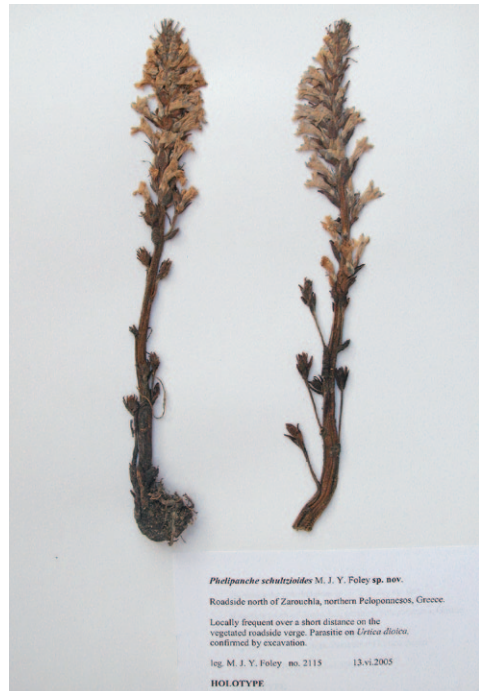
Abb. 6: Holotypus von Orbanche schultzioides (E00214873). Mit frdl. Genehmigung von M. J. Y. Foley.

(552) 19.04.1845 G 00330493 (Scan) als Phelipaea oxyloba (ebenfalls mit dem Vermerk „Typus“) mit etwas unterschiedlichen Beschriftungen und jeweils mehreren montierten Exemplaren. Das Material befindet sich generell in gutem Zustand. Darum legen wir auf dem Beleg Herb. Fl. Orientalis (G-Bois), Nummer G00330493 (n°SIB 359355/1) in der oberen Reihe die zweite Pflanze von links als Lectotypus für Phelipaea oxyloba Reuter (1847) fest (Abb. 2), die anderen Pflanzen sind alle Isolectotypen.