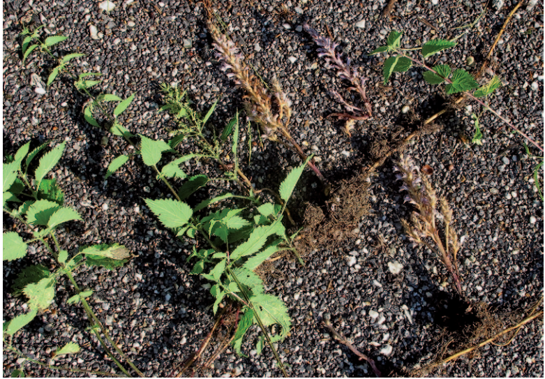
Abb. 19: Phelipanche schultzioides auf Urtica dioica aufgewachsen, Peloponnes, Arkadia, Parnon- Gebirge oberhalb Kastanitsa.