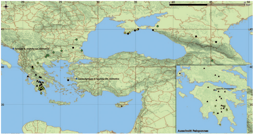
Karte 3: Verbreitung von Phelipanche dalmatica (blauer Stern – Syntypen und Lectotypus; gelbe Kreise – auf Euphorbia rigida ; schwarze Punkte – ohne Wirtsangabe; grüne Kreise – mit räumlicher Unschärfe und ohne Wirtsangabe; Kreuz – fragliche Vorkommen auf Zypern) und von Ph. schultzeoides (blaues Dreieck – Holotypus; schwarze Dreiecke – sonstige Angaben; gelbe Dreiecke – mutmaßliche Vorkommen auf der Krim. [Ausschnittsvergrößerung: Verbreitung beider Arten auf der Peloponnes und dem südlichen, griechischen Festland.]

Verbreitung: Phelipanche dalmatica besitzt nach bisherigem Kenntnisstand ein ostmediterranes, Areal von Dalmatien bis in die westliche Türkei und strahlt nach Nordosten bis zur Krim und in die nordöstliche Küstenregion des Schwarzen Meeres in Rußland sowie die Kaukasusregion aus. Angaben von Zypern sind nicht gesichert. Auf der Peloponnes – von der sie bislang nicht bekannt war – scheint sie auf die Kernregion der südlichen Peloponnes beschränkt zu sein, speziell auf die höheren Lagen des Parnon- und Taygetos-Gebirges. Wir kennen zudem zwei Vorkommen im Nord-Pindos (Timfi-Gebirge) und in der Region Nord Zentral (Vermion-Gebirge; Karte 3 ).