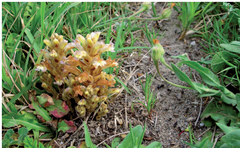
Abb. 13: Phelipanche hedypnoidis, auf Hedypnois rhagadioloides, Rhodos, NE Kiotari, nahe Glystra Beach (loc. class.).

Entsprechend diesen Erkenntnissen sollen die Pflanzen hier als neue Art beschrieben werden: