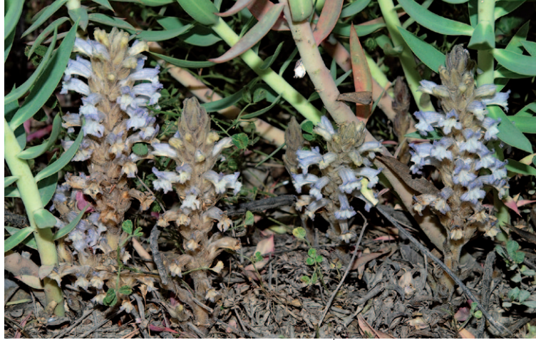
Abb. 15: Phelipanche dalmatica, auf Euphorbia rigida, Peloponnes, Arkadia, Parnon-Gebirge, Dipotamo nach Kastanitsa.