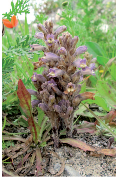
Abb. 11: Phelipanche hedypnoidis (dunkle Farbmorphe), auf Hedypnois rhagadioloides, Rhodos, NE Kiotari, nahe Glystra Beach (loc. class.).