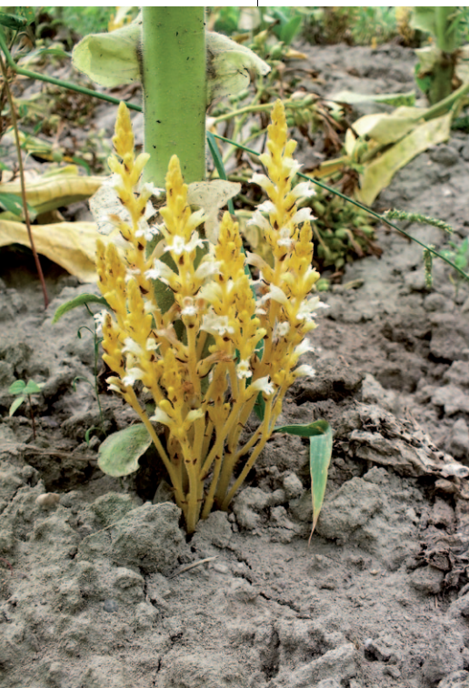
Abb. 22: Phelipanche ramosa, auf Nicotiana tabacum, Rheinland-Pfalz, Rheinabern.

himmelblaue, gewöhnlich nicht deutlich dunkler geaderte Krone, die sehr spitzen, stark zurückgekrümmten Lappen der Kronenunterlippe, die (fast) kahlen, nicht zerstreut bis sogar reich behaarten Staubbeutel und den Wirt Euphorbia rigida (vgl. jedoch die folgenden Ausführungen). Bemerkenswert sind die Unterschiede im Blütenstand: Dieser ist bei Ph. schultzioides besonders im unteren Bereich locker, die Blüten und – bei starkwüchsigen Pflanzen – die Seitenäste unter dem Blütenstand stehen tendenziell eher entfernt. Bei Ph. dalmatica sind die – seltener gebildeten – Seitenäste an der Basis des Blütenstandes sehr gedrängt eingefügt sowie deutlich kürzer als bei Ph. schultzioides . Unterschiede gibt es auch bei der Blütenstellung: Der Winkel zwischen der Blütenstandsachse und einer gedachten Mittellinie der Blüte beträgt bei Ph. schultzioides