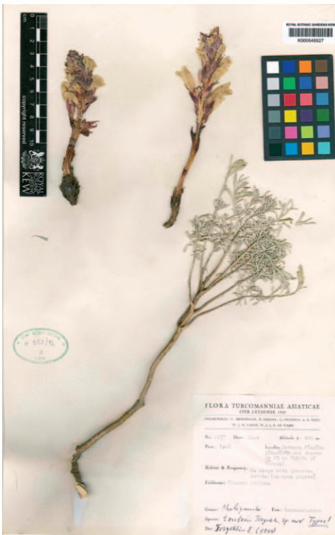
Abb. 7: Holotypus von Phelipanche tzevelevii (K00054527, designiert durch Teryokhin 1999 in TERYOKHIN 2001).

Synonyme: = Orobanche oxyloba (Reut.) Beck in L. K. A. Koch, Entw.-gesch. der Orob. 209. 1887; = Orobanche oxyloba var. typica Beck, Monogr. Orob. 109, t. 1 fig. 18. 1890, nom. invalid. = Phelipanche