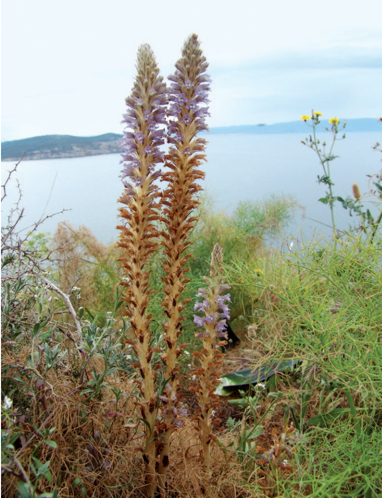
Abb. 25: Phelipanche schultzei , Sardinien.

Central, Imathia, Berg Vermion ( http://www.plantarium.ru/page/image/id/247139.html acc. 10.05.2016).