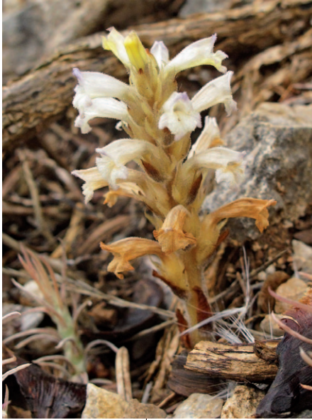
Abb. 17: Phelipanche dalmatica, Peloponnes: Arkadia, Parnon, ca. 1 km NNE Kosmas, an der Str. Leonidio nach Spartis.

mit unauffälligen, weißlich-hyalinen Stieldrüsen zerstreut besetzt, Mittelnerv deutlicher hervortretend. Krone (10) 12–18 (19) mm lang, schmalröhrig bis trichterig, an der Einschnürung ca. 2 mm Durchmesser, am Saum etwa 3,5–7 mm breit, wie die ganze Pflanze überwiegend (bräunlich) gelblich und nur zum Saum (dort vor allem auf den Innenseiten), am Kronenrücken und im Bereich der Oberlippe ± hell- bis trübblauviolett überlaufen, in diesen Bereichen Nerven z. T. dunkler violett, oder ganze Krone stärker schmutzig-trüblila, Krone innen – bis auf den Schlund – fast kahl, Oberlippe ausgerandet bis seicht zweilappig, Lappen vorgestreckt, seltener etwas abstehend, Unterlippe ± gleich dreilappig, Lappen breit-rundlich, stumpflich, auf der Innenseite im Bereich der Unterlippe durch große, weiße bis cremefarbene, reich behaarte Schlundfalten getrennt, Haare dort hyalin-weißlich, einfach, diese vorn stumpflich, Kronenrand unregelmäßig gezähnt, wie „ausgebissen“, außen und am Saum hyalin stieldrüsig. Staubfäden 6–9 mm lang, wenig