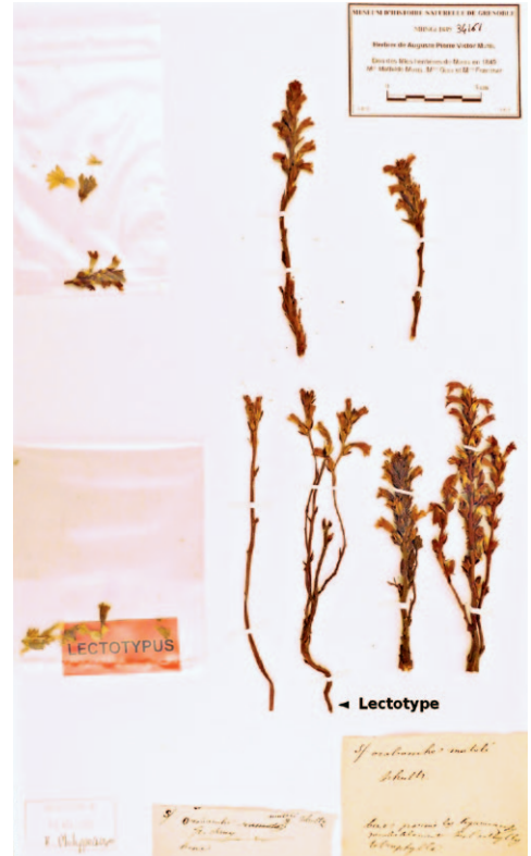
Abb 4: Lectotypus von Orobanche mutellii (MHNGR 1849_34161, untere Reihe 2. Pflanze von links, designiert durch Carlón et al. 2008).

unkonkret, in vielerlei Hinsicht vage bzw. wenig überzeugend oder widersprüchlich.