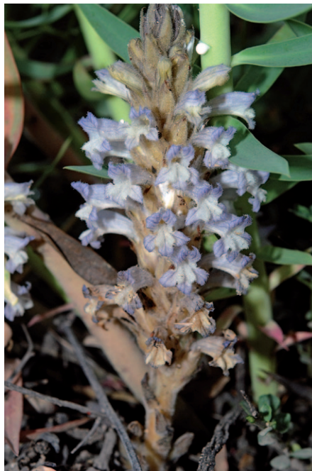
Abb. 16: Phelipanche dalmatica, auf Euphorbia rigida, Peloponnes, Arkadia, Parnon-Gebirge, Dipotamo nach Kastanitsa.