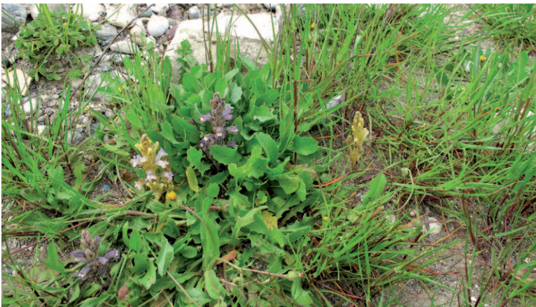
Abb 12: Phelipanche hedypnoidis, Bestand aus hellen und dunklen Farbmorphen, auf Hedypnois rhagadioloides, Rhodos, NE Kiotari, nahe Glystra Beach (loc. class.).