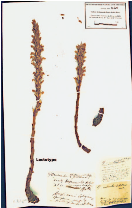
Abb. 5: Lectotypus von Orbanche schultzi (MHNGR 1849_34205, linke Pflanze, designiert durch Foley 2001).