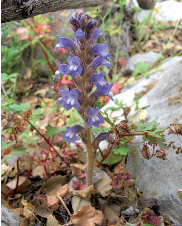
Abb. 24: Phelipanche mutellii var. oxyloba , auf Geranium lucidum , Rhodos, Attaviros. Foto: S. Rätzel, 05.2014