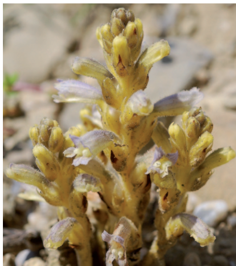
Abb. 14: Phelipanche hedypnoidis, Rhodos, WNW of Lardos.

Beschreibung: Pflanze (4) 6–10 (12) cm hoch, meist kompakt bzw. gedrunken erscheinend. Stängel ± kräftig, basal (2) 3–5 (7) mm dick, gelblich bis hellbraun, reich hell drüsenhaarig, i. d. R. schon basal (seltener in der Mitte des blütenlosen Stängelteils, ausnahmsweise unter dem Blütenstand) ästig, bis ca. 6 (10) Seitenäste, seltener unverzweigt, ± reich schuppig. Schuppen eilanzettlich, vorn abgerundet bis kurz bespitzt, locker anliegend bis etwas abstehend, ca. 5–8 (10) mm lang, (2,5) 3–4 (5) mm breit, etwas weniger als bis ca. halb so breit wie lang, frisch wie der Stängel gefärbt, trocken dunkelbraun, reich hell drüsenhaarig, zur Ansatzstelle verkahlend, vielnervig, Mittelnerv deutlich hervortretend. Blütenstand zu Beginn der Blüte pyramidal, in Vollblüte kurz zylindrisch, manchmal fast kopfig, oben abgerundet, (2) 4–7 (9) cm lang, ca. 3 cm breit (ohne Verzweigungen), ± dicht, zur Basis manchmal einzelne, etwas entfernte Blüten, länger oder etwa so lang wie der übrige oberirdische Stängel, selten kürzer, von