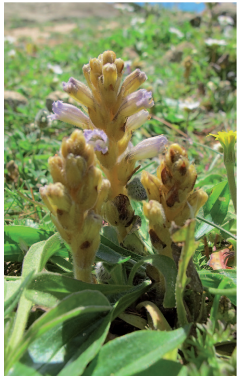
Abb. 9: Holotypus von Phelipanche hedypnoidis (B 10 0699408).