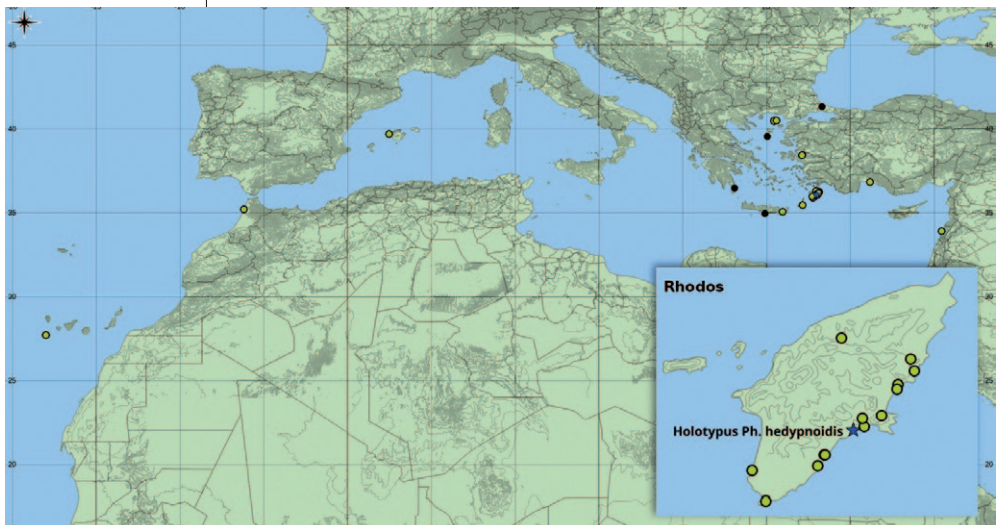
Karte 2: Verbreitung von Phelipanche hedypnoidis im Mittelmeerraum und – vergrößert – auf der Insel Rhodos (blauer Stern – loc. class.; gelb gefüllte Kreise – Herbar- belege; schwarze Punkte – sonstige Nachweise).

Habitat: Nach bisheriger Kenntnis bevorzugt Ph. hedypnoidis deutlich küstennahe, meist wenig über Meereshöhe gelegene Wuchsorte, und zwar in einem Streifen von ungefähr 10 km Breite, in Strandnähe auf Sand oder feinem Kies (z. B. Dünenränder). Weiter landeinwärts nutzt sie Wuchsstellen in niedriger Phrygana über Kalkgestein, auch an etwas gestörten, in der Regel beweideten Stellen bei ca. 5–200 m.s.m. Viele