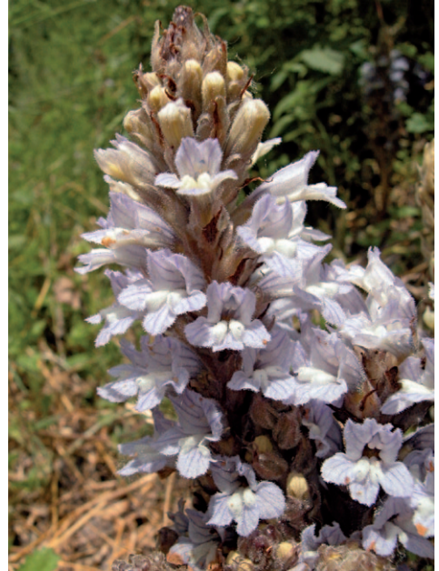
Abb. 21: Phelipanche schultzioides, Nahaufnahme, Zarouchla (loc. class.).

Gegenüber Ph. mutelii (Abb. 4, 23) mit den beiden Varietäten oxyloba (Abb. 2, 24) und nana (Abb. 3) unterscheidet sich Ph. hedyppnoidis farblich durch die gelblich bis trüblila-farbenen Blüten und den kompakten Habitus; bei jenen ist die Krone (außer den stets weißen Schlundfalten) +/- kräftig blau-lila bis lila-blau (sehr selten weiß). Die infragenerischen Sippen von Ph. mutelii sind zierlich, in Relation zur Höhe dünnstängelig und haben häufig deutlich auflockernde Blütenstände. Zur Abgrenzung der neuen Art vgl. außerdem Tabelle 2 .