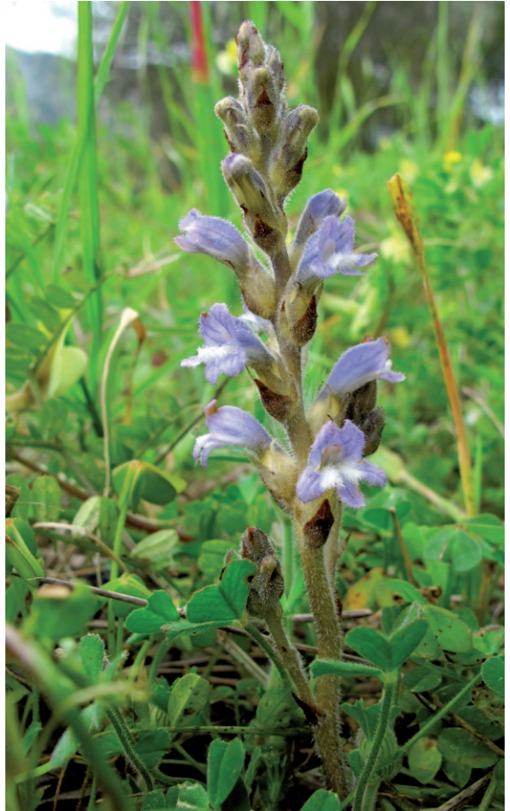
Abb. 23: Phelipanche mutelii var. mutelii , Rhodos, NE Salakos. Foto: S. Rätzel, 03.2013

• GRIECHENLAND: North Pindos : Trikalon, Ep. Kalambakas, Berg Kratsovon, Pefki (39°47'47,4" N / 21°22'49,08" E), nahe der Kapelle Agia Marina, felsiger und schottriger Hang entlang der Straße, 5. Juni 2000, A. Prescher & H. Uhlich s.n. (herb. Uhlich). North Central :