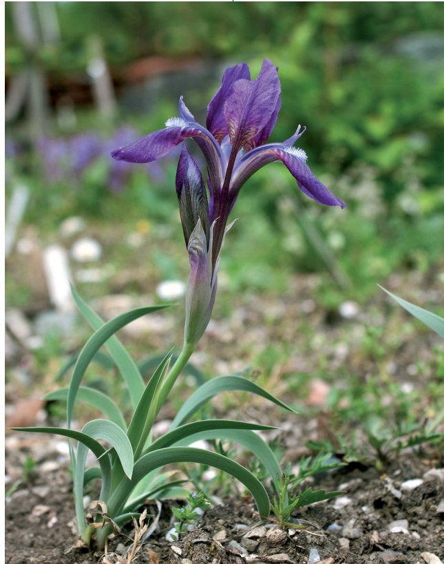
Abb. 7: Iris timofejewii blüht im Kaukasus- Quartier.

Die PlantSearch-Abfrage ergab für 143 der 206 Pflanzenarten ein Ergebnis von weniger als zehn Kulturen in botanischen Gärten. Aufgrund dieser Seltenheit in botanischen Sammlungen zählen diese Akzessionen zum besonderen Stolz des Botanischen Gartens Klagenfurt. Sie haben ihren Ursprung in insgesamt 46 Staaten der Erde, die