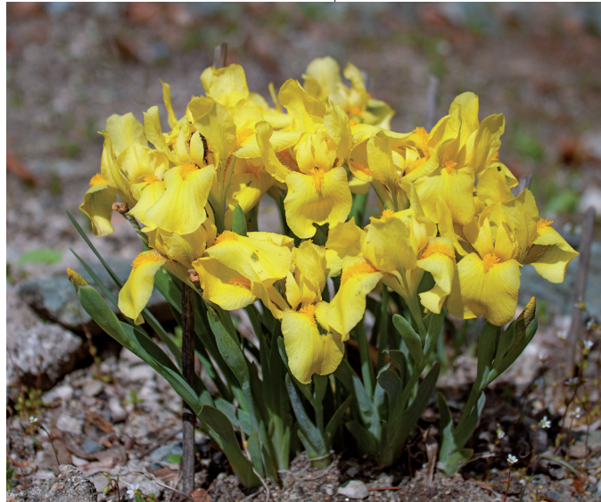
Abb. 4: Iris arenaria blüht im Pannonien-Quartier (Pannonikum).

Etwas mehr als ein Drittel, genau gesagt 71 der 206 Pflanzenarten, sind im Bundesland Kärnten vollkommen oder teilweise geschützt. Sie sind in der Tabelle mit einem „K“ gekennzeichnet. Der Erhalt dieser und anderer lokaler Sippen zählt zu den Kernaufgaben des Botanischen Gar-