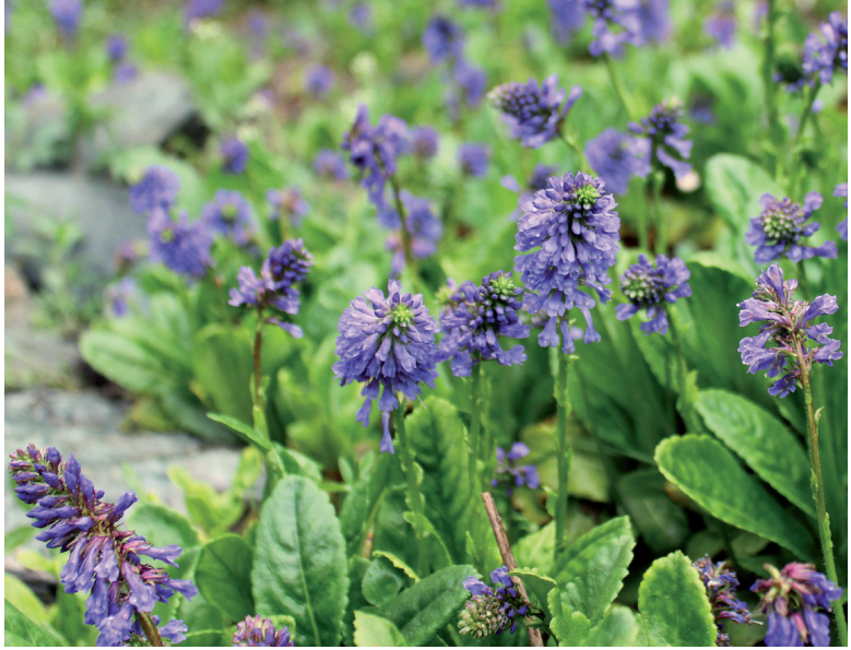
Abb. 5: Wulfenia carinthiaca im Quartier der Südlichen Kalkalpen. Die Art blüht im Botanischen Garten oft schon Ende April!

tens. Besonders schöne Beispiele regelmäßig blühender Bestände geben die Europa-Rosmarinheide ( Andromeda polifolia ), die Strauch-Birke ( Betula humilis ), der Weiß-Seidelbast ( Daphne alpina ), das Drachemmaul ( Horminum pyrenaicum ), die Schwarz-Küchenschelle ( Pulsatilla pratensis ssp. nigricans ) und natürlich die Kärntner Wulfenie ( Wulfenia carinthiaca ), die auch als „Kärntner Landesblume“ berühmt ist (Abb. 5). Zu den interessantesten Kulturen seltener und geschützter Arten gehören gleichfalls jene weniger geläufige Pflanzen, wie z. B. der Nordische Feld-Wermut ( Artemisia borealis ), die Flaum-Wolfsmilch ( Euphorbia villosa ) oder das Pfiemengras ( Stipa capillata ).