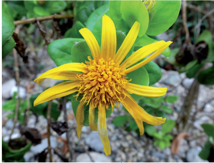
Abb. 9: Das Quartier „Sukkulente der Alten Welt“ wird durch einen kleinen Didelta spinosa -Strauch aus Südafrika bereichert.

Die Umsetzung zur „Globalen Strategie zum Schutz der Pflanzen“ ist eine Verpflichtung aller CBD-Vertragspartnerstaaten, darunter auch Österreich. Die Mitarbeiter des Botanischen Gartens des Landesmuseums für Kärnten bemühen sich redlich, dieser schönen und sinnvollen Aufgabe nachzukommen. So möchten wir es auch in Zukunft schaffen, alle schützenswerten Taxa der Sammlung zu erhalten und alljährlich neue, spannende Arten in das Gartenkonzept zu integrieren.