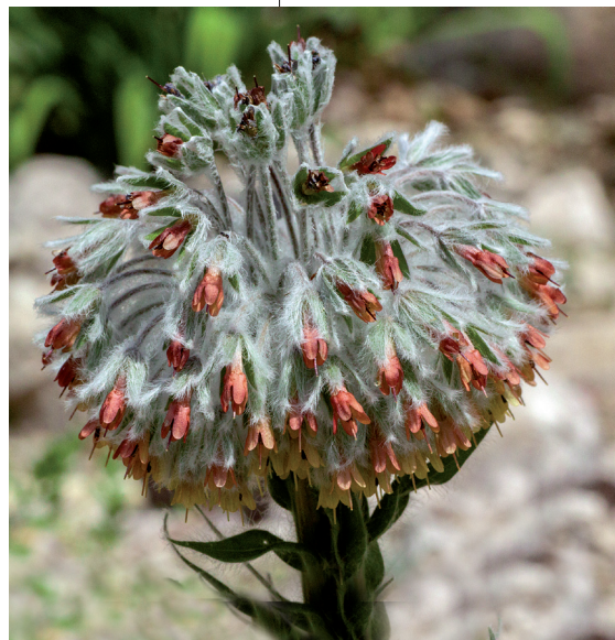
Abb. 1: Rindera umbellata (Boraginaceae) blüht im Balkan-Quartier.

Botanical gardens, Carinthian Botanic Center, conservation cultures, GSPC, PlantSearch, Regional Museum of Carinthia, wildlife conservation