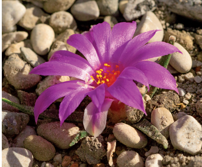
Abb. 3: Ariocarpus agavoides ist eine Kakteen-Art, die in Anhang I des Washingtoner Artenschutzabkommens (CITES) zu finden ist.

Auf der 6. Vertragsstaatenkonferenz der CBD in Den Haag (2002) verpflichteten sich die Teilnehmer zu einem Abkommen speziell zum