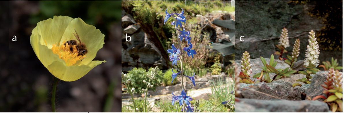
Abb. 8: Drei Beispiele für Pflanzen des Zen- tralasiens-Quartiers, die extrem selten zu sehen sind: Papaver chakassicum (8a), Delphinium dyctiocarpum (8b), Orostachys maximowiczii (8c).

sich über alle Kontinente verteilen. Überdurchschnittlich viele Akzessionen stammen aus Bolivien (7), Ecuador (6), Lesotho (10), Mexiko (10), Österreich (10), Peru (6), Russland (15) und Südafrika (9). Der Grund, weshalb österreichische Populationen nicht stärker hervortreten, liegt vor allem in der bereits erwähnten größeren Dichte an botanischen Sammlungen in Mitteleuropa.