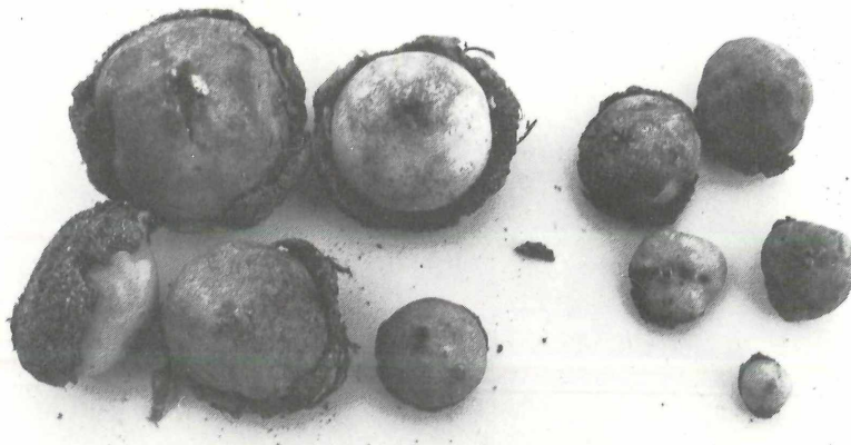
Abbildung 6. Disciseda bovista (links) und Disciseda candida (rechts) vom Wingertsbuckel.

Aus der Bundesrepublik wurde Geastrum melanocephalum von WOLF in BRESINSKY & DICHEL (1971) und WOLF (1975) bei Aschaffenburg angegeben. Das als Beleg in der Botanischen Staatssammlung München (M) aufbewahrte Exsikkat unterscheidet sich jedoch von Geastrum melanocephalum durch eine gut ausgebildete Endoperidie mit deutlicher Apophyse und durch peri-