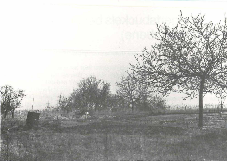
Abbildung 1. Brachfläche auf dem Wingertsbuckel mit Poa -Gesellschaft und alten Obstbäumen.

Gartenbäume, von denen viele tote Äste tragen oder zusammenbrechen.