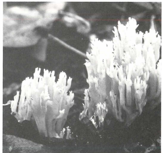
Abbildung 2. Ramaria decurrens im Fliedergebüsch auf dem Wingertsbuckel.

Diesen kleinen Trichterling, der in der deutschsprachigen Literatur noch nicht beschrieben ist, beobachte ich seit 1974 in Trockenrasen des nördlichen Oberrheingebietes. Die Bestimmung gelang dank Literaturhinweisen der Herren Dr. M. BON und Dr. J. KLÁN und der Nachbestimmung meiner Aufsammlungen durch Herrn Prof.