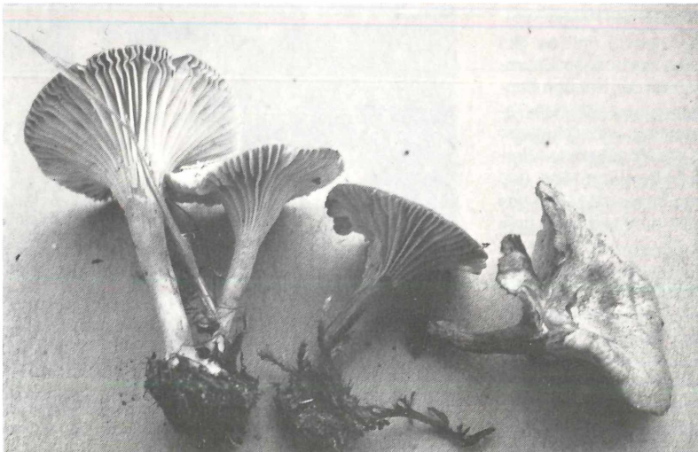
Abbildung 3. Clitocybe herbarum (Aufsammlung von Eisenberg/Pfalz).

Nach BON (1979, 1980) ist Clitocybe nitrophila charakteristisch für salzhaltige und stark gedüngte Böden. Die erst wenig bekannte Art ist vielleicht nicht sehr selten. Von BON revidierte Funde liegen vor von Bühl bei Ulm leg. ENDERLE und vom Galgenberg bei Sandhausen (WINTERHOFF 1977 als Clitocybe cf. metachroa ). ARNOLDS (1982) bezeichnete einen Pilz aus gedüngtem Grünland der Niederlande, dessen Beschreibung sehr gut mit Clitocybe nitrophila übereinstimmt, als Clitocybe cf. amarescens HARMAJA. Wie ARNOLDS hervorhebt, hat Clitocybe amarescens nach HARMAJA (1969) jedoch etwas größere Fruchtkörper und Sporen, schwach bitteren Geschmack und bewohnt nicht gedüngtes Grünland sondern Nadelwälder. Der letztgenannte Unterschied ist jedoch hinfällig, da HARMAJA den Typus von Clitocybe amarescens nach KUYPER (in ARNOLDS) nicht auf Wald-