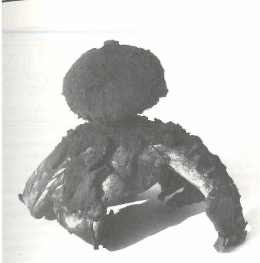
Abbildung 7. Geastrum melanocephalum vom Wingertsbuckel.

myzeliate Exoperidie, deren Myzelschicht allerdings außer an den Lappenspitzen abgefallen ist. Es handelt sich offenbar um Geastrum fornicatum . Eine Verwechslung dieser beiden Arten war selbst HOLLOS (1904) unterlaufen, der auf Tafel VIII, 11 einen Fruchtkörper von Geastrum melanocephalum als „ Geaster fornicatus “ abbildet, wie bereits RAUSCHERT (1963) bemerkt. Weitere Fundmeldungen aus Ostfriesland (PIRK in MICHAEL & HENNIG 1960), der Haardt und dem Saarland (Fundmeldungen an KRIEGLSTEINER) sind unbelegt und unglaubwürdig (vgl. GROSS, RUNGE & WINTERHOFF 1980). Der Wingertsbuckel ist somit der erste sicher nachgewiesene Fundort des Haarsterns in der Bundesrepublik.