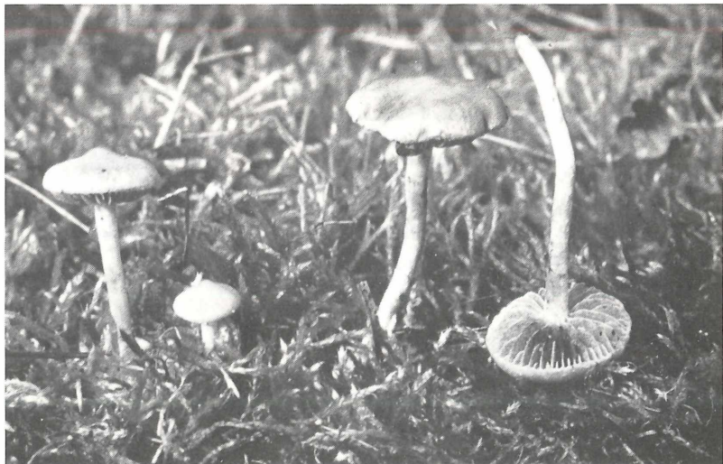
Abbildung 5. Psilocybe callosa in einer Obstgartenbrache bei Sandhausen.

Psilocybe callosa ist in der Bundesrepublik bisher nur von 13 Fundorten in der nördlichen Oberrheinebene und auf deren Randhügeln bekannt. (WINTERHOFF 1975, als „cf. Stropharia stercoraria “, WINTERHOFF 1977,