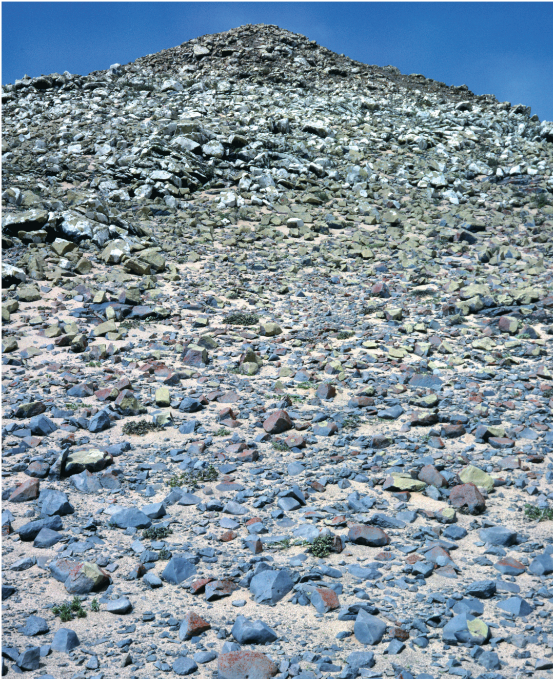
Abbildung 3: Von Doleritsteinen bedeckter Hang mit optisch unterscheidbaren Flechtenzonen aufgrund der Dominanz verschiedener Arten im hygrischen Gradienten: (1) Ausgedehnte Caloplaca elegantissima -Zone im Bereich Hangbasis und Mittellhang mit spärlicher Deckung von C. elegantissima (rot); es dominiert die bläuliche Eigenfarbe des Gesteins. – Darüber (2) schmale Lecanora substylosa -Zone. – Darüber (3) weiße Lecanora panis-erucae -Zone. – Bergkuppe (4) Teloschistes -Zone (orange). Hügelzüge SE Cap Cross.