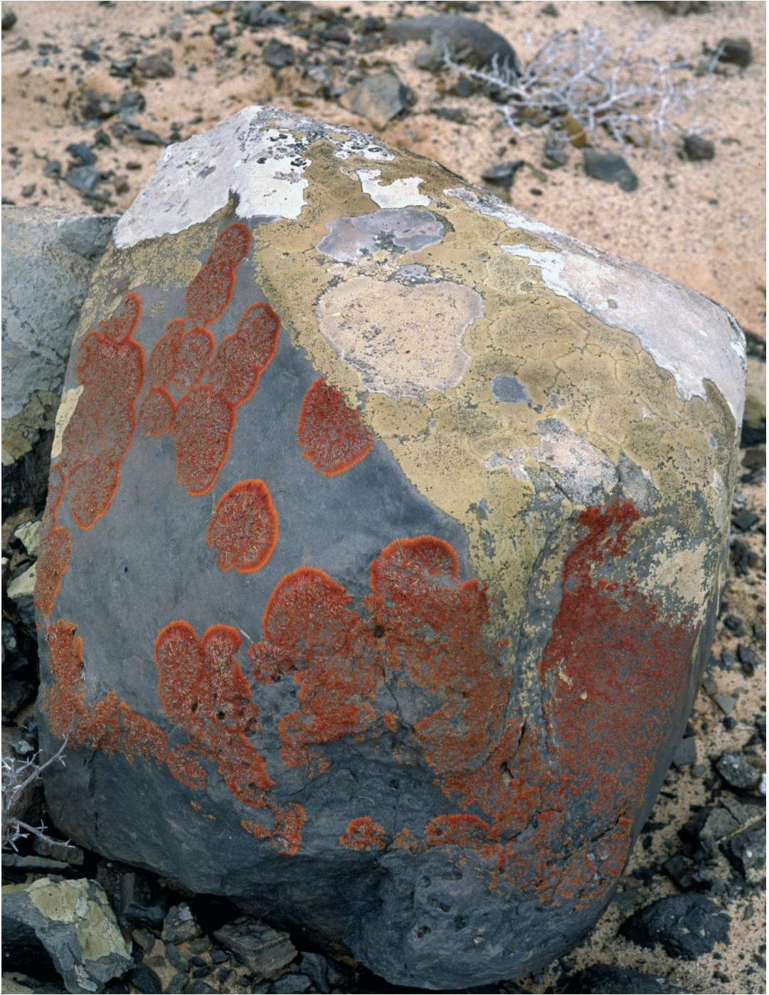
Abbildung 7: Doleritblock mit ausgeprägtem Luv-/Lee-Bewuchs: In Nebelzug-Lee Caloplaca elegantissima (rot), in Luv Lecanora substylosa und Lecanora panis-erucae .