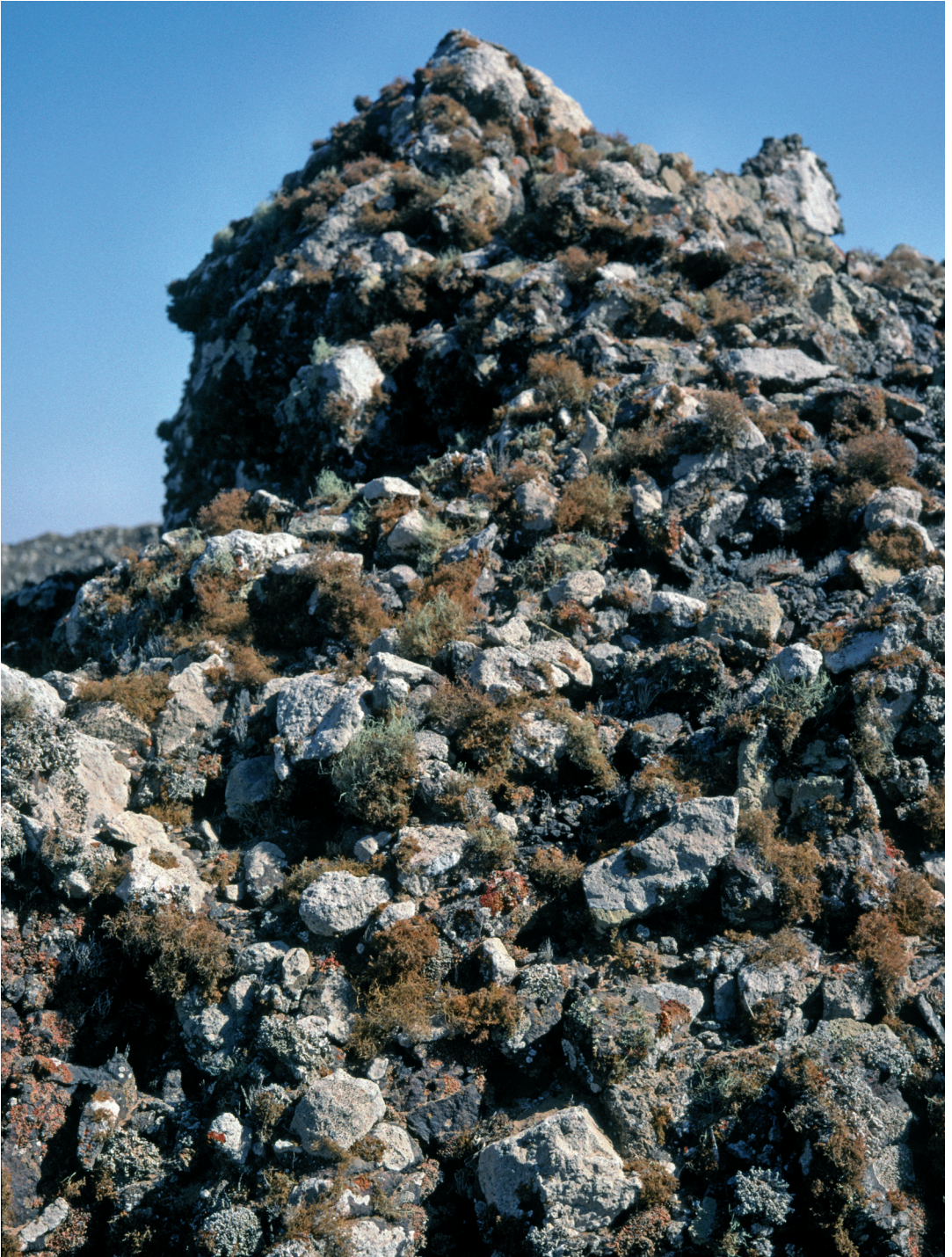
Abbildung 6: Teloschistes -Zone üppigster Ausprägung (Nähe Transekt B).