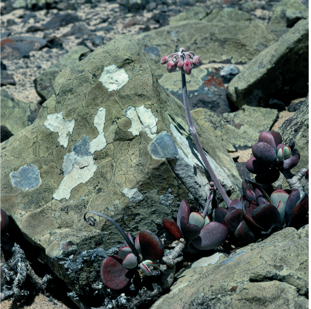
Abbildung 4: Steine im Bereich der Lecanora substylosa -Zone (Nähe Transekt A), mit L. substylosa (gelblich), L. panis-erucaae (weiß), Diploschistes diploschistoides (grau) und der Blattsukkulente Cotyledon orbiculata .