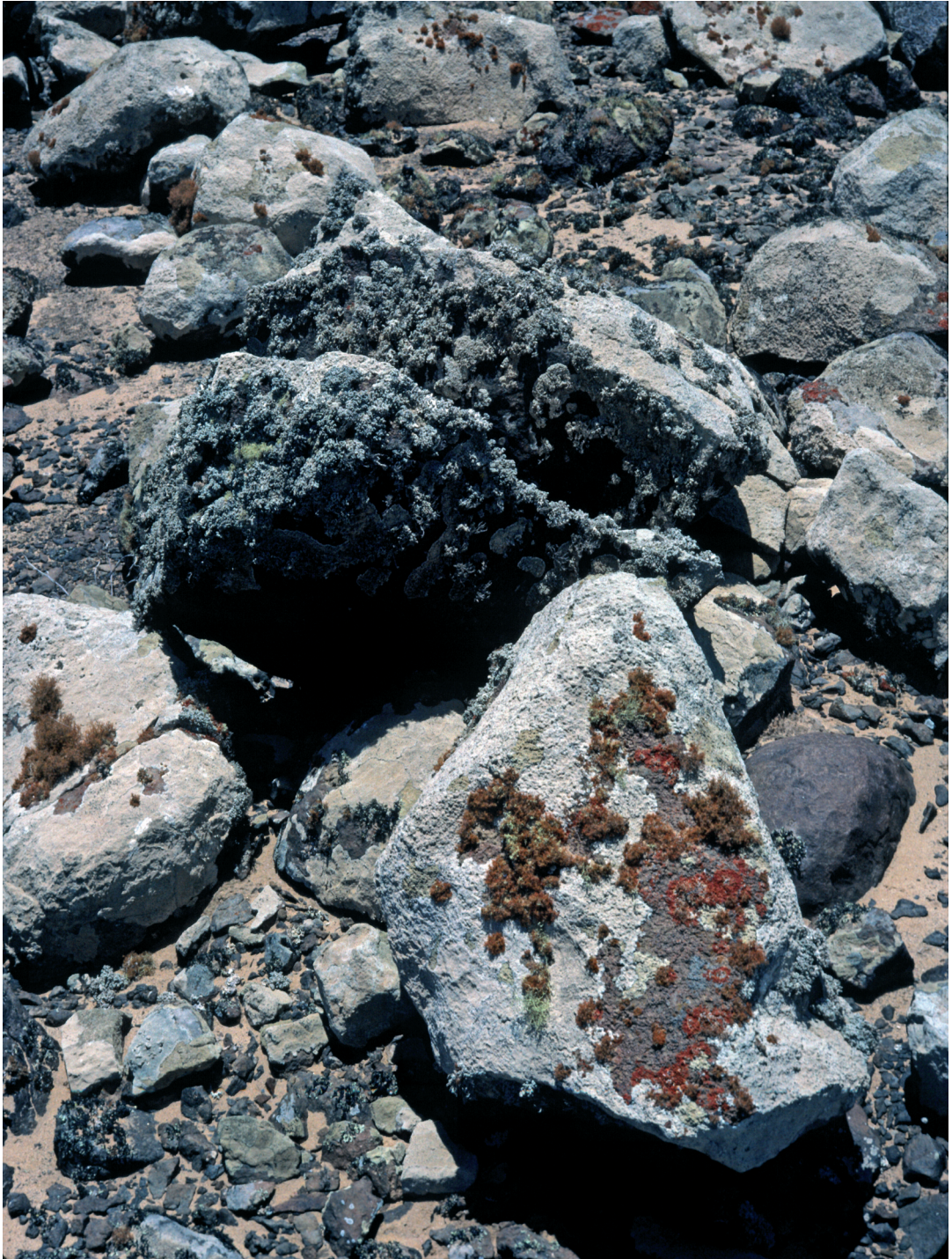
Abbildung 5: Lecanora panis-eruae -Zone, mit Xanthoria turbinata (rot) und Teloschistes capensis (orange).