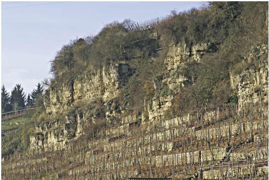
b) Wuchsort von Candelariella plumbea an südexponierten Muschelkalk-Felsen am Prallhang des Neckars inmitten von Weinbergen bei Benningen (Kreis Ludwigsburg).