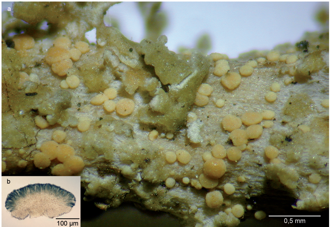
Abbildung 2. Micarea kemmleri , Holotypus; a) Apothecien auf dem Podetium von Cladonia squamosa ; b) Schnitt durch ein Apothecium nach Anfärbung mit Melzers Reagens (ohne Anfärbung erscheint der gesamte Schnitt völlig farblos).

Asci clavate, with a K/I+ blue outer layer and K/I+ blue apical dome penetrated by a narrow canal surrounded by a K/I+ dark blue tube, ca. 30–40 × 7–9 µm, (4–)8-spored. Ascospores irregularly biseriata in the asci, non-septate, hyaline, smooth, ellipsoid to slightly ovoid with one end rounded and the other slightly attenuated, (6.0–)6.6–8.1 (–9.0) × (2.5–)2.9–3.6(–4.0) µm, l/b = (1.7–)1.9–2.6(–3.2) (n = 50).