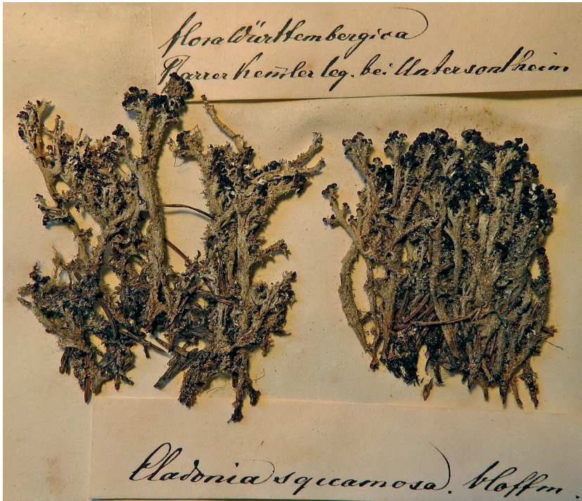
Abbildung 1. Originalbeleg Cladonia squamosa von C. A. KEMMLER aus dem Herbarium POLL. – Foto: W. VON BRACKEL.

et tholo caeruleo cum ductu et tuba K/l+ obscure coerulea, ca. 30–40 × 7–9 µm, (4–)8-spori. Ascosporeae irregulariter biseriatae, unicellulares, hyalinae, glabrae, ellipsoideae vel leviter ovoidae, (6,0–)6,6–8,1(–9,0) × (2,5–)2,9–3,6(–4,0) µm, l/b = (1,7–)1,9–2,6(–3,2) (n = 50).