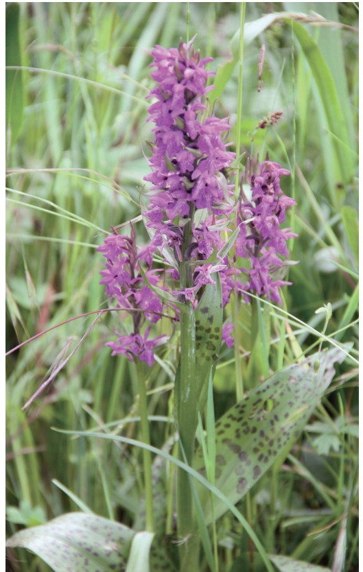
Abbildung 14. Das Breitblättrige Knabenkraut ( Dactylorhiza majalis ), welches auf feuchteren Wiesen zu finden ist.

Lineare Gehölzstrukturen im Offenland, wie der Auwald entlang der Pfinz, sind als Leitstrukturen für Fledermäuse von außerordentlicher Bedeutung und verbinden deren Teillebensbereiche miteinander.