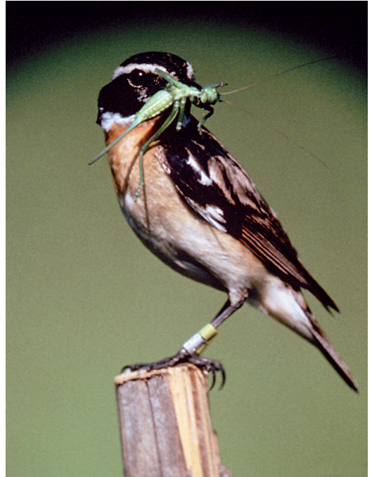
Abbildung 7. Das Braunkehlchen ( Saxicola rubetra ), ein seltener Brutvogel der Pfinzquellen.

Der Feldhase ( Lepus europaeus ) steht mittlerweile ebenfalls auf der Vorwarnliste Baden-Württembergs und ist deutschlandweit sogar gefährdet (BINOT et. al. 1998).