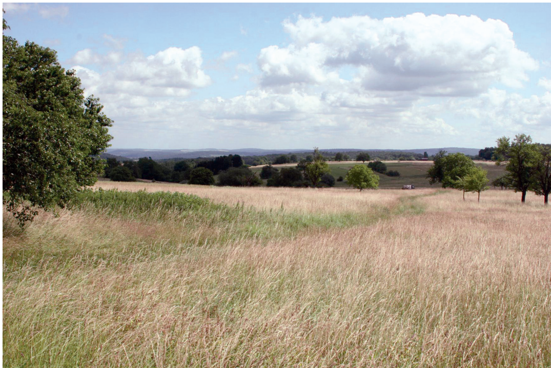
Abbildung 2. Blick in das Naturschutzgebiet Pfinzquellen.

Insgesamt wurden 21 nach § 30 BNatSchG / § 33 NatSchG geschützte Offenland- bzw. Waldbiotope kartiert. 420 verschiedene Arten von Farn- und Blütenpflanzen wurden nachgewiesen, von denen 22 auf der Roten Liste Baden-Württembergs stehen. Dreizehn dieser Arten sind nach § 44 BNatSchG besonders geschützt, zwölf sind darüber hinaus streng geschützt.