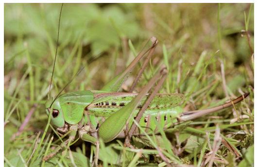
Abbildung 9. Der Warzenbeißer ( Decticus verrucivorus ) bevorzugt lückige, magere Wiesen. – Foto: P. ZIMMERMANN.

Lebensraum des Warzenbeißers waren ursprünglich die Streuwiesen. Hier konnten die Sonnenstrahlen im Frühjahr ungehindert auf den lückig bewachsenen Boden treffen, ihn aufheizen und so ideale Voraussetzungen für das Gelege und die Larven schaffen. Da Streuwiesen heutzutage nur noch eine historische Landnutzungsform darstellen, findet der Warzenbeißer immer weniger geeignete Lebensstätten. In gedüngten Wiesen wird die Vegetation zu dicht, der Boden