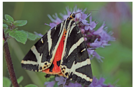
Abbildung 12. Die Spanische Flagge ( Callimorpha quadripunctaria ) bevorzugt Hochstaudenfluren mit Wasser-Dost ( Eupatorium cannabinum ).

In der im Jahr 2015 durchgeführten Untersuchung (DEUSCHLE 2015) konnten im Gebiet 41 Wildbienenarten nachgewiesen werden, darunter auch die stark gefährdete Späte Ziest-Schlüßbiene ( Rophites quinquespinosus ). Diese Art ist auf den spätblühenden Heilziest ( Stachys officinalis ) angewiesen. Die Tiere benötigen den eiweißreichen Pollen der Pflanze für die Larvenaufzucht. Sie finden diese Pflanzen nur auf entsprechend spät gemähten Wiesen, d.h. die Wie-