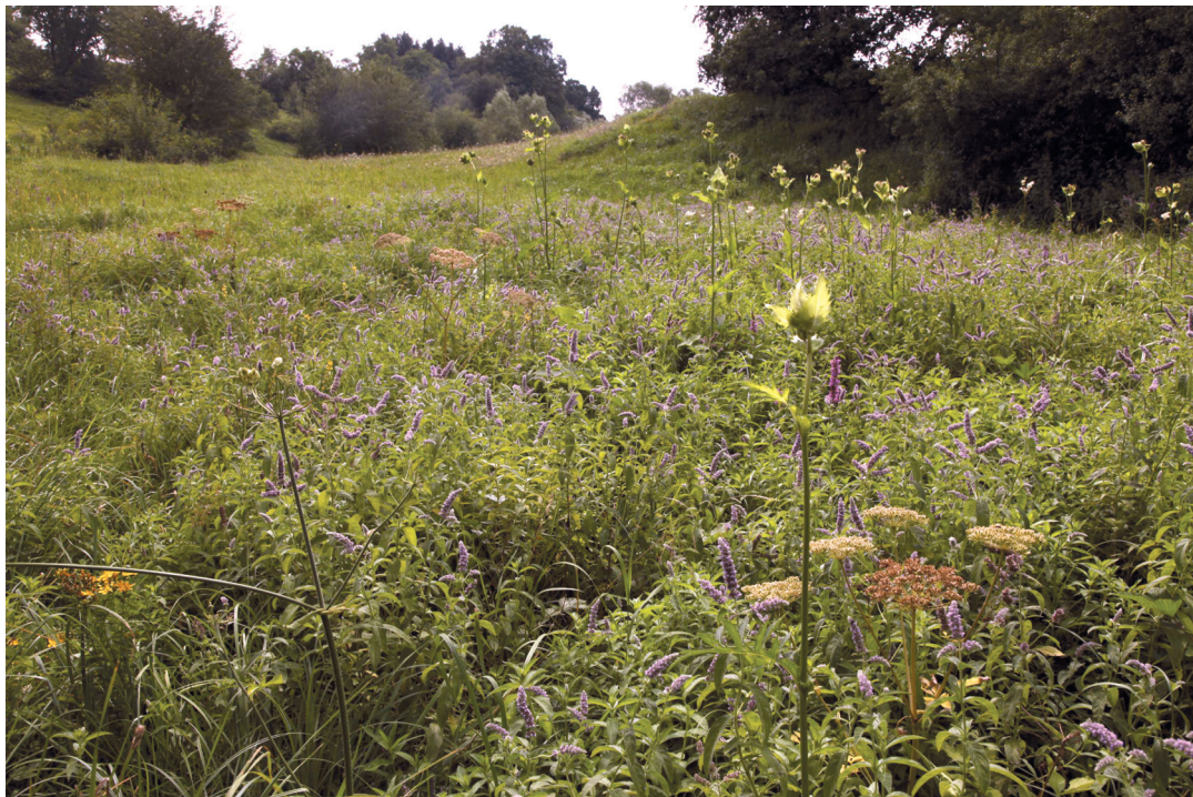
Abbildung 5. Hochstaudenflur im Gewann Wolfsgrube.

Waldes in galeriewaldartiger Struktur auf und ist meist pflanzensoziologisch nicht genau fassbar. Auch er ist ein nach § 30 BNatSchG gesetzlich geschütztes Biotop. Teilbereiche des Verlaufes der Pfinz wurden als FFH-LRT „Auenwälder mit Erle, Esche und Weide“ (Code 91 E0*) kartiert. Dieser im Sinne der FFH-Richtlinie prioritäre Lebensraum ist gekennzeichnet durch die Charakterarten Schwarz-Erle ( Alnus glutinosa ), Esche ( Fraxinus excelsior ) und Bruch-Weide ( Salix fragilis ). Des Weiteren findet man hier den Wald-Ziest ( Stachys sylvatica ), das Scharbockskraut ( Ranunculus ficaria ) oder auch das Gewöhnliche Pfaffenhütchen ( Euonymus europaeus ). Aufgrund der typischen Strukturvielfalt und den daraus resultierenden ökologischen Nischen bieten Auenwälder einer Vielzahl teils seltener Tierarten wichtigen Lebensraum und dienen aufgrund ihrer bandartigen Struktur der Biotopvernetzung.