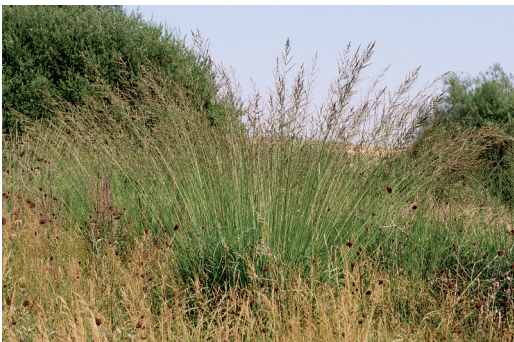
Abbildung 4. Pfeifengras ( Molinia caerulea ) im Gewann Langwiese/Hasselwiesen. – Foto: NATUR-Bildarchiv HAFNER.

( Saxicola rubetra ) angewiesen. Kennzeichnende Pflanzenarten sind Blaues Pfeifengras ( Molinia caerulea ; Abb. 4), Gewöhnlicher Teufelsabbiss ( Succisa pratensis ), Großer Wiesenknopf ( Sanguisorba officinalis ), Heilziest ( Stachys officinalis ) und Spitzblütige Binse ( Juncus acutiflorus ). Hohe Anteile an Seggen und Binsen weisen auf Nasswiesen basenarmer Standorte hin. Diese treten auf feuchten bis nassen, meso- bis eutrophen Böden auf und kommen in einigen Bereichen im Gebiet vor. Hier sind sie durch Kriechhahnenfuß-Gesellschaften charakterisiert und werden durch Waldsimen-Sümpfe ergänzt. Weitere charakteristische Arten sind das Hundstraußgras ( Agrostis canina ), die Spitzblütige Binse ( Juncus acutiflorus ) und das Wasser-Greiskraut ( Senecio aquaticus ).