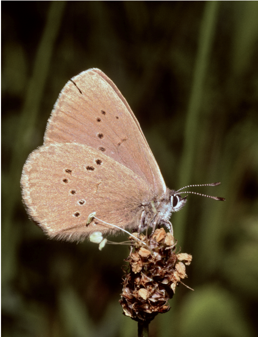
Abbildung 10. Der Dunkle Wiesenknopf-Ameisenbläuling ( Maculinea nausithous ) benötigt Wiesenknopf ( Sanguisorba officinalis ) und Ameisen für seine Larvalentwicklung.

kühlt aus und geht als Lebensraum für die Art verloren.