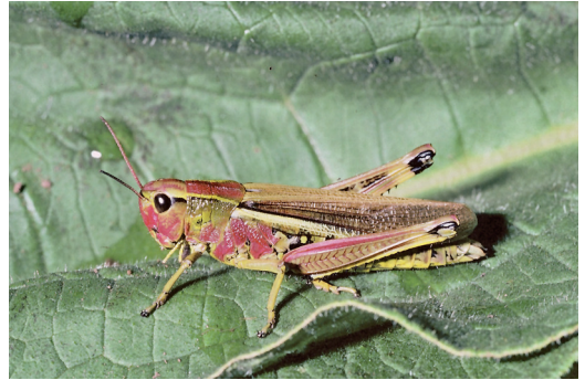
Abbildung 8. Die Sumpfschrecke ( Stethophyma grossum ) findet man in frischen bis feuchten Wiesen.

Die Sumpfschrecke bevorzugt als Lebensraum feuchte Grünlandstandorte wie Seggenriede und vor allem Nasswiesen. Durch die Trockenlegung und Intensivierung von Feuchtlebensräumen ist die ehemals verbreitete Art heute sehr selten geworden. Im Bereich des NSG „Pfinzquellen“