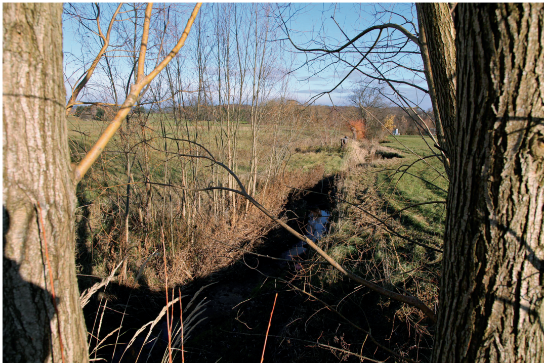
Abbildung 6. Naturnaher Bach auf Feldrennacher Gemarkung.

schaft Rückzugsräume für eine große Anzahl von einheimischen Tier- und Pflanzenarten dar. Sie sind daher als Elemente der Biotopvernetzung ebenfalls sehr wichtig und wertgebend, da viele heimische Vogelarten hier sowohl einen Lebensraum als auch einen Brutplatz finden, so z.B. die Dorngrasmücke ( Sylvia communis ) oder die Heckenbraunelle ( Prunella modularis ). Die im Nordosten des Gebietes gelegenen Wälder bestechen durch ihren alten Baumbestand aus Eichen und Buchen. Sie lassen sich als Hainsimsen-Buchenwälder ansprechen, deren bestandsbildende Art hier die Rotbuche ( Fagus sylvatica ) ist. In den alten Laubbaumbeständen finden auch einige seltenere Vogelarten einen Lebensraum. So konnten hier der streng geschützte Waldkauz ( Strix aluco ), der Pirol ( Oriolus oriolus ) und der nach Anhang I der Vogelschutzrichtlinie geschützte Mittelspecht ( Leiopicus medius syn. Dendrocopos medius ) nachgewiesen werden. Diese Vogelarten unterstreichen die naturschutzfachliche Wertigkeit dieser Waldbereiche. Gerade die alten Eichen sind als Brutbaum für den Mittelspecht sehr wichtig. Ebenfalls auf alte