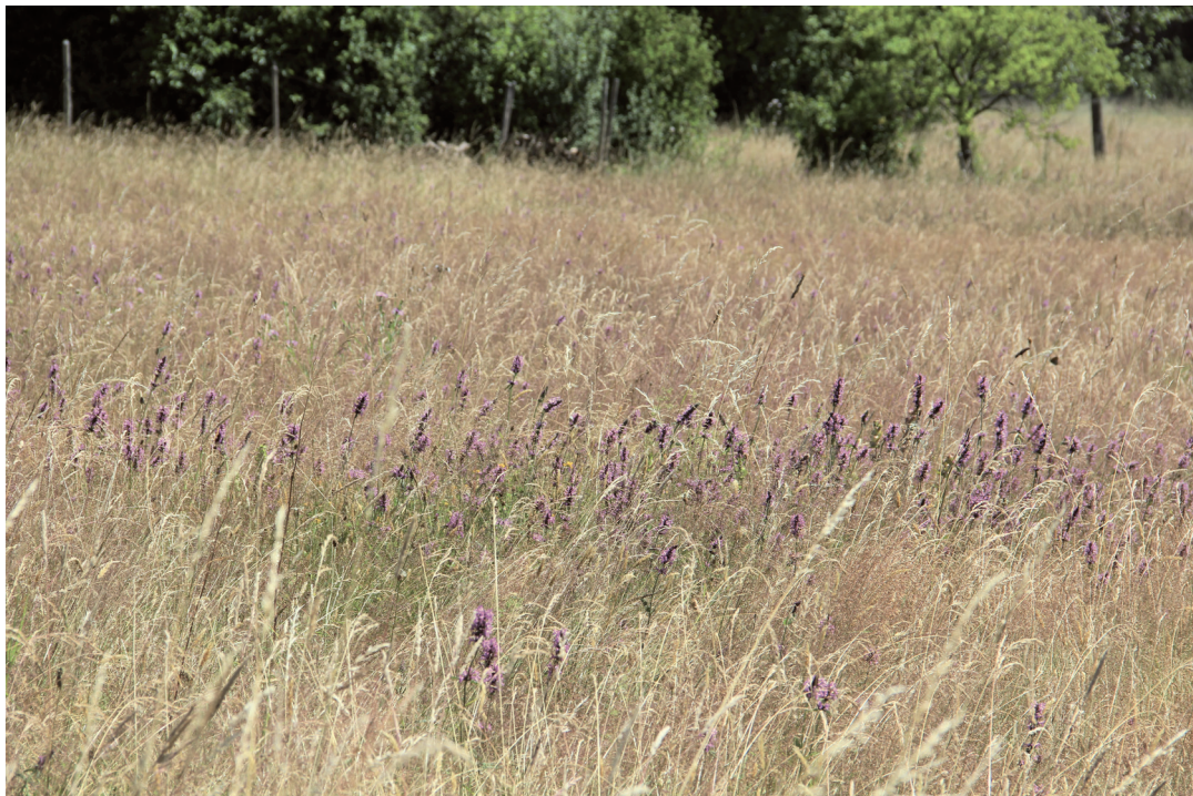
Abbildung 15. Blühender Heilziest ( Stachys officinalis ), die Nahrungspflanze der stark gefährdeten Späten Ziest-Schlürfbiene ( Rophites quinquespinosus ). Der späte Blühzeitpunkt ist am abgetrockneten Gras sehr gut zu erkennen.