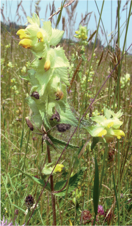
Abbildung 3. Detailaufnahme einer artenreiche Magerwiese mit Ruchgras ( Anthoxanthum odoratum ) und Klappertopf ( Rhinanthus alectorolophus ).