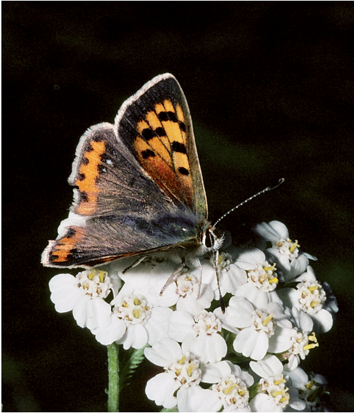
Abbildung 11. Der Kleine Feuerfalter ( Lycaena phlaeas ) ist an niedrigwüchsige Vorkommen des Kleinen Sauerampfers ( Rumex acetosella ) gebunden.

Abb. 11) und Brauner Feuerfalter ( Lycaena tityrus ). Sie zählen zwar zur Familie der Bläulinge, besitzen aber eine orange Färbung oder zumindest orange Elemente auf den Flügel-Oberseiten und Vorderflügel-Unterseiten. Der Braune Feuerfalter ( Lycaena tityrus ) ist in Baden-Württemberg zwar weit, aber mit großen Lücken und nur in kleinen Populationen verbreitet. Die Art, wie auch der Kleine Feuerfalter, steht in Baden-Württemberg auf der Vorwarnliste und ist nach BNatSchG besonders geschützt.