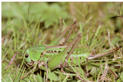
Abbildung 9. Der Warzenbeißer ( Decticus verrucivorus ) bevorzugt lückige, magere Wiesen.

Lebensraum des Warzenbeißers waren ursprünglich die Streuwiesen. Hier konnten die Sonnenstrahlen im Frühjahr ungehindert auf den lückig bewachsenen Boden treffen, ihn aufheizen und so ideale Voraussetzungen für das Gelege und die Larven schaffen. Da Streuwiesen heutzutage nur noch eine historische Landnutzungsform darstellen, findet der Warzenbeißer immer weniger geeignete Lebensstätten. In gedüngten Wiesen wird die Vegetation zu dicht, der Boden