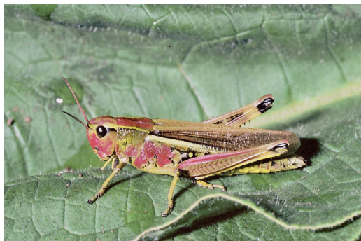
Abbildung 8. Die Sumpfschrecke ( Stethophyma grossum ) findet man in frischen bis feuchten Wiesen.

Die Sumpfschrecke bevorzugt als Lebensraum feuchte Grünlandstandorte wie Seggenriede und vor allem Nasswiesen. Durch die Trockenlegung und Intensivierung von Feuchtlebensräumen ist die ehemals verbreitete Art heute sehr selten geworden. Im Bereich des NSG „Pfinzquellen“