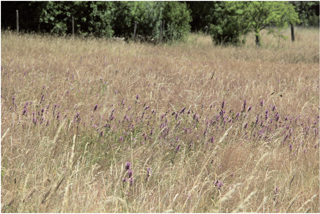
Abbildung 15. Blühender Heilziest ( Stachys officinalis ), die Nahrungspflanze der stark gefährdeten Späten Ziest-Schlürfbiene ( Rophites quinquespinosus ). Der späte Blühzeitpunkt ist am abgetrockneten Gras sehr gut zu erkennen.