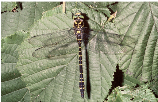
Abbildung 13. Die Zweigestreifte Quelljungfer ( Cordulegaster boltonii ) nutzt selbst kleinste Quellrinnale zur Eiablage.

In dem Naturschutzgebiet leben elf Libellen-Arten. Alle sind nach BNatSchG besonders