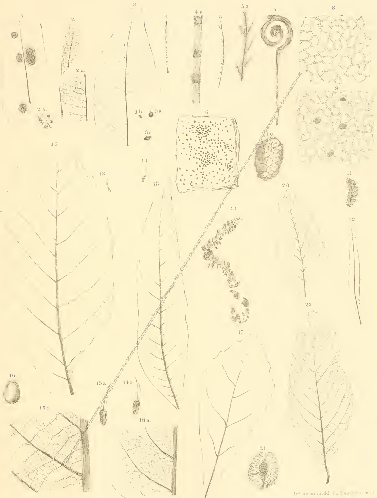
1 Rhytisma grande . 2 Sphaeria minutissima . 3, 5 Fici tenuinervis . 4 Equisetum repens . 5 Muscites sayinensis . 6 Chara Meriani . 7 Farnwedelknospe . 8 Smilax Haudingeri . 9 S. sp. 10 Sequoia Conitziac . 11 Pinus Palaeo Tarda . 12 Podocarpus cocconii . 13, 14 Pasuarina sp. 15 Quercus Nympharum . 16 Q. Lonchitis . 17 Q. tephroides . 18 Castanopsis sagoriana . 19, 20 Carpinus Heeri .