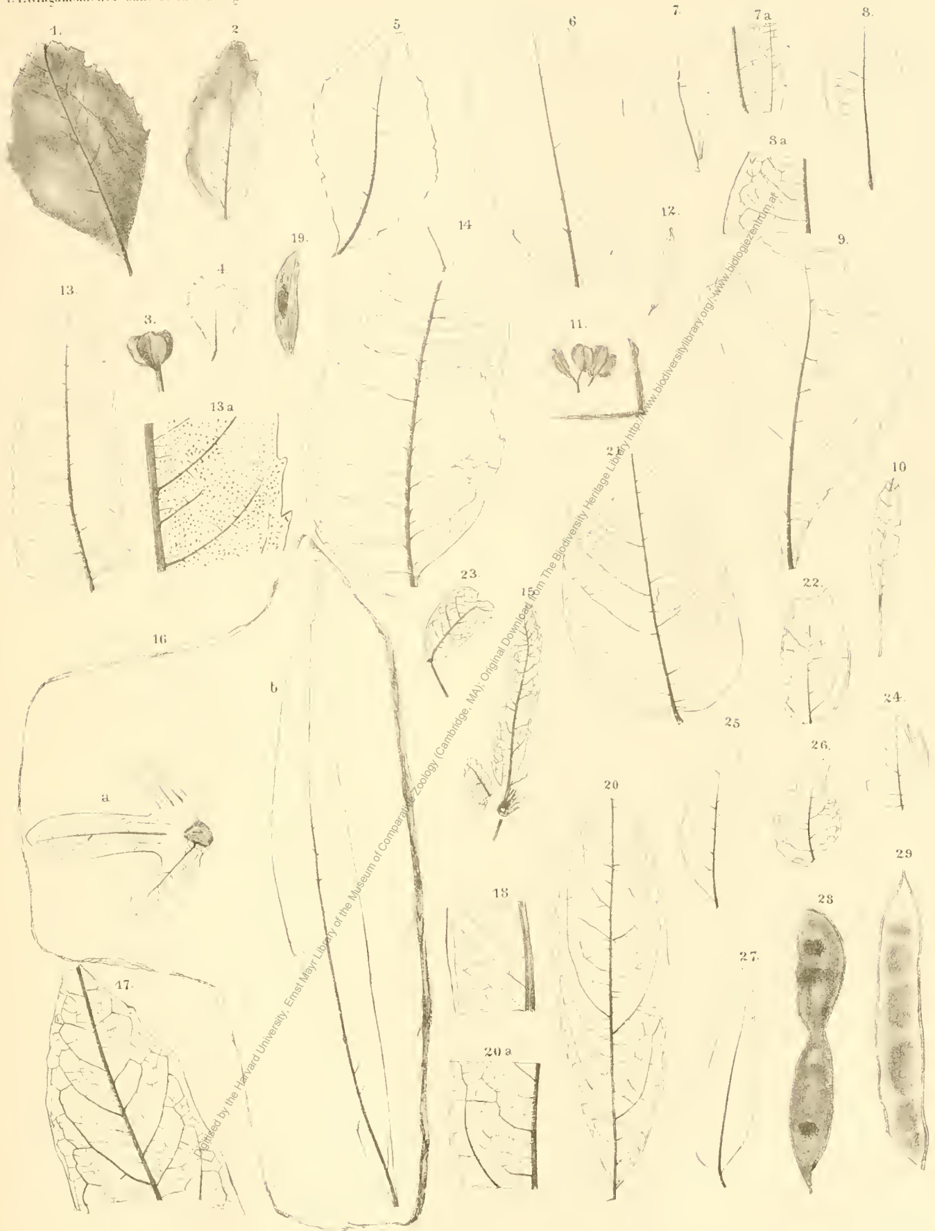
1 Celastrus oxyphyllus ? 2 C. Platanis . 3, 4 C. sagoriana 5 Elaeodendron Persii 6 E. degeneri . 7 Zizyphus savinensis . 8 Rhus obovata . 9 R. Latoniae . 10 R. sagoriana . 11, 12 Bursaria radobynjuna 13 Carya tritallonensis . 14 Juglans rechneris . 15 Engelhardtia Brongniartii . 17 Mex. sagoriana 18 Eucalyptus oceanica . 19 Ailantus Orionis . 20 Carya prue-olivaeformis 21, 22 Erythrina Fageri 23 Kennedia Phaseolites . 24 R. orbicularis . 25, 26 Glycyrrhiza Blandusiae . 27 Cassio. Memnonia . 28 Robinia Drnidum . 29 Acacia solziana .

Lith. u. gedr. in d. Hof-u. Staatsdruckerei