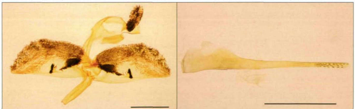
Abb. 1: S. aistleitneri ♂, Spanien, Prov. Granada, Sierra Arana, 2000 m, 9.7.2000, leg. Pühringer & Pöll (a Genitale; b. Aedoeagus; Messbalken: 1 mm)

Aus dieser Liste suchten wir dann einen Berg aus, der mit dem Auto relativ gut erreichbar schien. Unsere Wahl fiel auf die Sierra Arana, 25 km nördlich der Sierra Nevada, aber mehr als 100 km von der Sierra de Guillimona entfernt. Die Anfahrt mit dem Auto (vom Norden