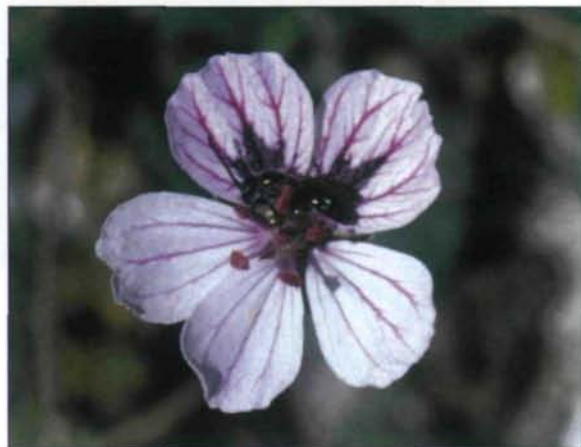
Abb. 5: Erodium petraeum (potenzielle Futterpflanze von S. aistleitneri ), 9.7.2000, Sierra Arana, 2000 m.

auf, mit der der Weg abgesperrt war. Doch die Mühe war vergebens, nicht ein S. aistleitneri -Exemplar bekamen wir noch zu Gesicht.