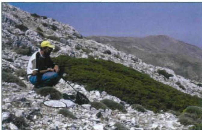
Abb. 4: Biotop von S. aistleitneri , 9.7.2000, Sierra Arana, 2000 m.

her) am 9.7. war eher ein Albtraum, 15 km über erbärmliche Straßen, einmal sind wir aufgesessen. Als wir am Ziel angekommen waren, stellten wir fest, dass mittlerweile von Süden her eine hervorragend befahrbare Straße auf die Arana gebaut worden war, die in unserer Karte aber noch nicht eingezeichnet war. Wir waren aber trotzdem froh, nicht mehr denselben Weg zurückfahren zu müssen. Nach Überwindung der letzten 300 Höhenmeter zu Fuß fanden wir insbesondere im unmittelbaren Gipfelbereich eine relativ starke Population von Erodium petraeum vor (Abb. 5). Der Pheromonfang im Bereich des Gipfelplateaus – abseits des unmittelbaren Gipfelbereichs (Abb. 4) – erbrachte (wiederum am BASF-Pheromon) 30♂ von S. aistleitneri , 2 davon frisch (Abb. 3). Die Suche nach Fraßspuren in den Wurzelstöcken von Erodium und 2 Helianthemum -Arten blieb aber wieder erfolglos. Armeria sahen wir auf der Sierra Arana nicht.