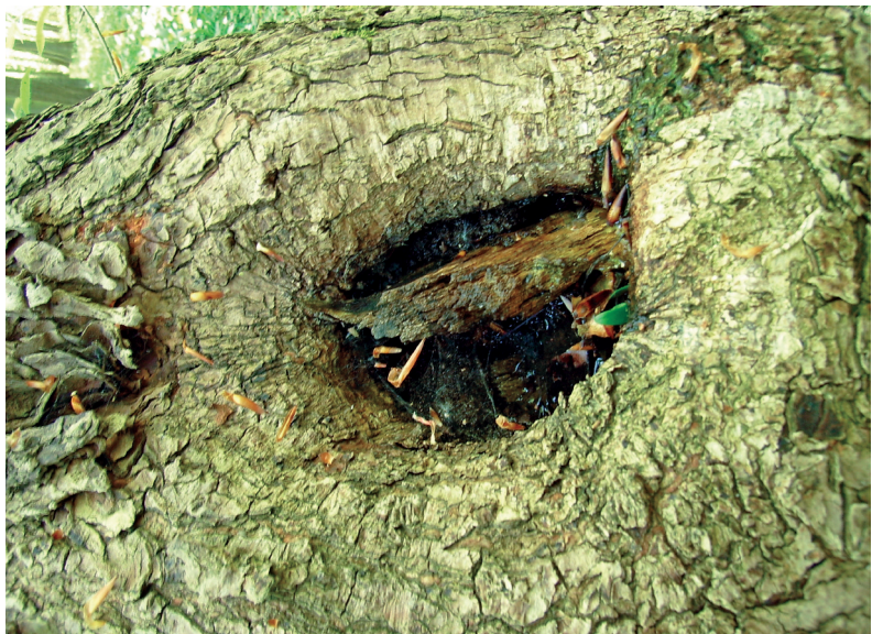
Abb. 8: Bruthabitat Phytothelme, Nationalpark Hainich, Thüringen, Deutschland.

ausgezeichnet, weshalb eine Verwechslung mit Zuckmückenlarven (Fam. Chironomidae) möglich ist. Eine Art Zwischenstellung nehmen die Larven der Gattung Dasyhelea ein. Ihnen fehlen die vorderen Fußstummel, und die Nachschieber des letzten Segments sind einziehbar. Die Arten dieser Gattung leben vorwiegend terrestrisch, jedoch sind einige Vertreter an die aquatische Lebensweise gebunden.