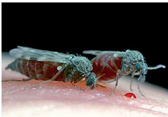
Abb. 11: Vollgesogene Culicoides sp. beim Saugakt am Menschen, Einstichstelle mit und ohne Blutaustritt.