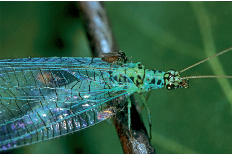
Abb. 2: Forcipomyia eques (JOHANNSEN, 1908) an einer Chrysopa perla LINNAEUS, 1758 (Familie Chrysopidae, Gattung Chrysopa ) saugend (Foto: BELLMANN 1974).