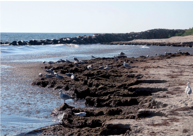
Abb. 5: Bruthabitat Meeresspülsaum, Ostseeinsel Rügen, Deutschland.

Die adulten Mücken halten sich nach dem Schlupf hauptsächlich in der Nähe der larvalen Entwicklungshabitate auf. Mit Windunterstützung können sie jedoch weit verdriftet werden. SELLERS (1992) wies eine Verbreitung über diesen Weg von bis zu 700 km nach. An definierten Landmarkern, wie Bäumen, Büschen und Ufervegetation, sind die Männchen vieler Arten in Schwärmen zu finden. Zur Partnerfindung senden die Weibchen Pheromone aus, die besonders bei jungfräulichen Weibchen anziehend und paarungsinduzierend auf die Männchen wirken. Die Kopulation findet im Flug statt. Sie kann ein- oder mehrmalig vollzogen werden (LINLEY & ADAMS 1972). Die Lebensdauer der Imagines