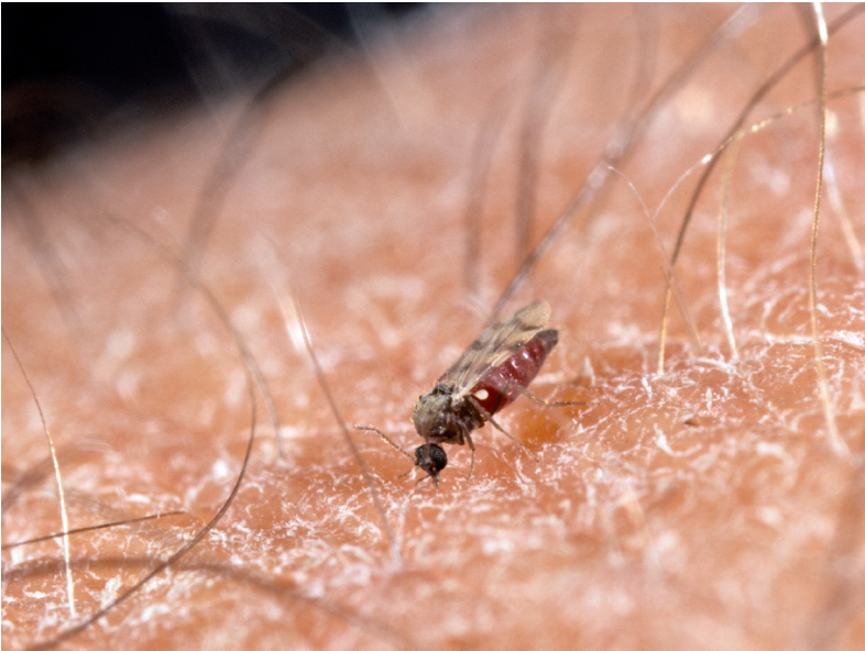
Abb. 9: Culicoides sp. beim Saugakt am Menschen.

Bei Tieren, vorrangig Pferden, aber auch Schafen und Rindern, sind die Symptome einer Dermatitis nach Gnitzenbefall unter der Bezeichnung “Sommerekzem”