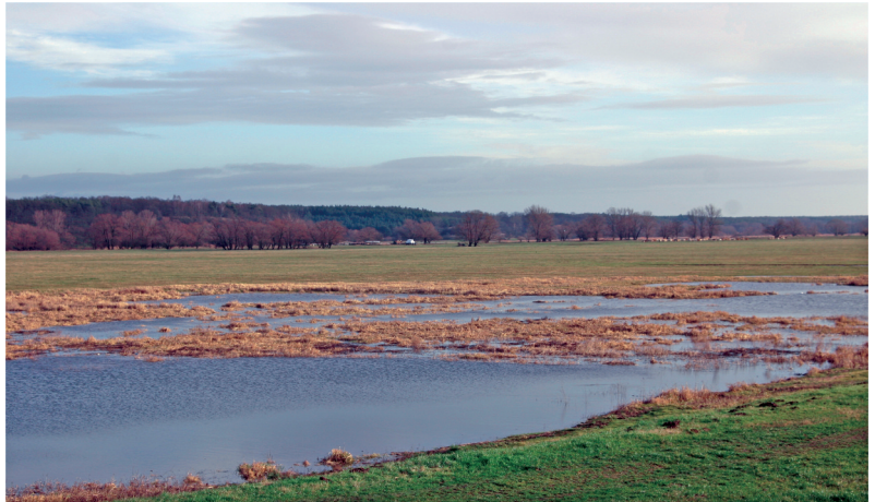
Abb. 7: Bruthabitat Überflutungsbereich von Flüssen, Brandenburg, Oder, Deutschland.

Die Präimaginalstadien der einzelnen Arten sind vielfach ungenügend bearbeitet und z. T. sogar unbekannt. Nur von ca. 15 bis 20 % des globalen Arteninventars liegen hierzu umfassendere Angaben vor (MEISWINKEL pers. Mitt.). Da Gnitzen nahezu alle Arten von Feuchtbiotopen besiedeln können, ergeben sich erhebliche Schwierigkeiten hinsichtlich einer flächendeckenden Erfassung und wissenschaftlichen Bearbeitung der Entwicklungsstadien. Nach der larvalen Lebensweise lassen sich grob drei Gruppen der Ceratopogonidae unterteilen, die sich auch morphologisch unterscheiden. In einer Gruppe werden die aquatischen Formen mit den lästigen Culicoides -Arten zusammengefasst. Die langen schlanken Larven, denen klassische Atmungsorgane fehlen, verfügen über ein schmales Kopfsegment. Sie sind gute Schwimmer und bewegen sich im Wasser schlängelnd vorwärts. In einer weiteren Gruppe werden die rein terrestrisch lebenden Formen zusammengefasst. Die bekannteste und artenreichste Gattung ist die Gattung Forcipomyia , deren Larven unter Baumrinde, modernem Holz, in Stubben, verrottendem Laub, Mulm, Humus, faulenden Früchten, in Baumausscheidungen sowie in Weidetierdung gefunden werden können. Die Larven sind durch das Vorhandensein von fußähnlichen Fortsätzen am ersten Brust- und letzten Körpersegment