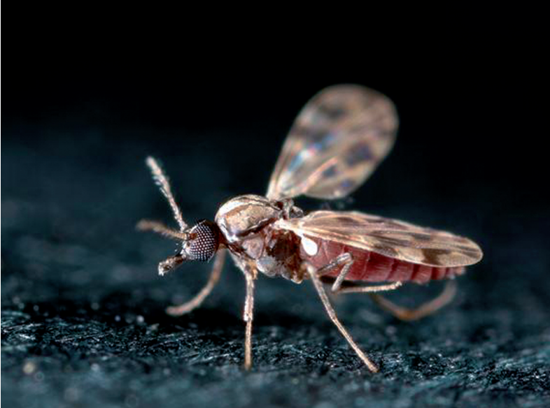
Abb. 1: Culicoides sp..