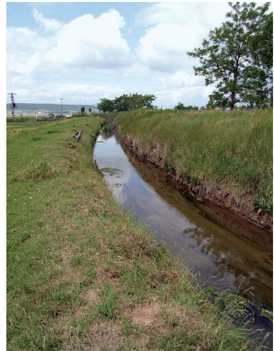
Abb. 6: Bruthabitat Salzquelle, Solgraben Espenstedter Ried, Thüringen, Deutschland.