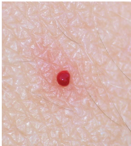
Abb. 10: Frische Einstichstelle mit austretendem Blutropfen am menschlichen Bein (Foto: WERNER 2006).