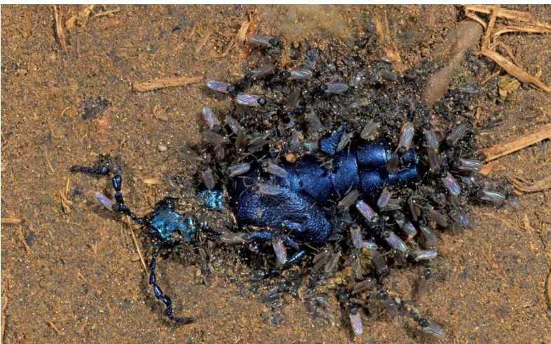
Abb. 3: Atrichopogon sp. auf dem Erdboden an einem zertretenen Meloe violaceus MARSHAM, 1802 (Ölkäfer, Familie Meloidae) saugend.

morphen Komplexarten charakteristisch. Dieses Phänomen tritt insbesondere innerhalb der Gattung Culicoides und der Unterfamilie Forcipomyiinae auf. Die Trennung solcher Komplex- oder Zwillingsarten ist vielfach nur unter Einbindung zytogenetischer, biochemischer oder molekularbiologischer Techniken möglich. Es ist allgemein akzeptiert, dass diese Zwillingsarten nach der klassischen Definition "richtige" Arten darstellen, die sich hinsichtlich ihrer Einnischung im Ökosystem und vieler anderer biologischer Charakteristika voneinander unterscheiden können.