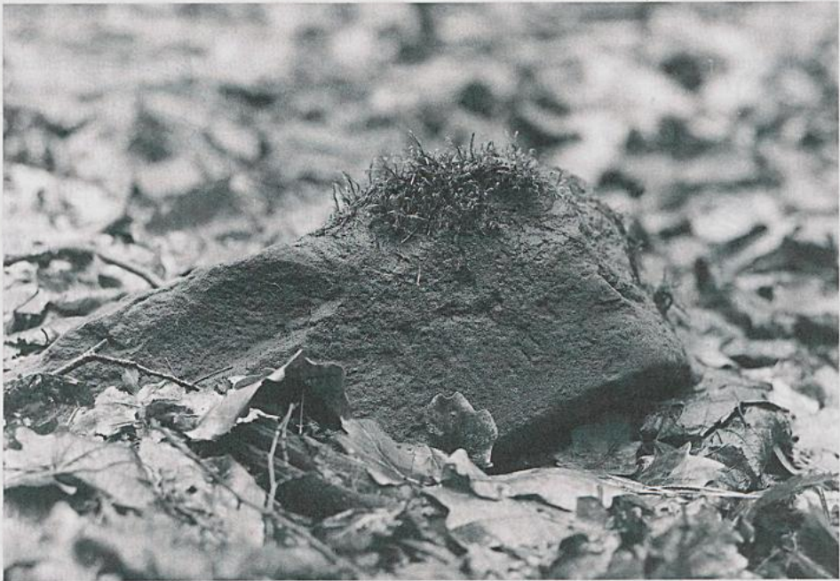
Abbildung 5. Dichelyma capillaceum an seinem Standort in der Ville.

forme, Lophocolea heterophylla , Calliergonella cuspidata und Eurhynchium praelongum , an weiteren Steinblöcken Homalia trichomanoides , Tortula muralis , Fissidens bryoides , F. taxifolius , Bryum capillare , Brachythecium rutabulum und velutinum , epiphytisch Platygyrium repens , Hypnum cupressiforme und Dicranoweisia cirrata .