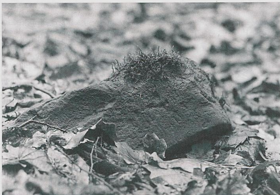
Abbildung 5. Dichelyma capillaceum an seinem Standort in der Ville.

forme, Lophocolea heterophylla , Calliergonella cuspidata und Eurhynchium praelongum , an weiteren Steinblöcken Homalia trichomanoides , Tortula muralis , Fissidens bryoides , F. taxifolius , Bryum capillare , Brachythecium rutabulum und velutinum , epiphytisch Platygyrium repens , Hypnum cupressiforme und Dicranoweisia cirrata .