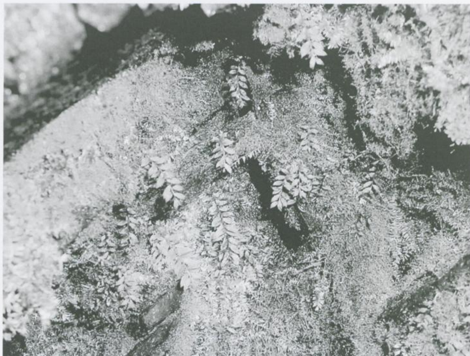
Abbildung 1. Gametophyt von Trichomanes speciosum , Gelbachtal G3 – 23.6.2006