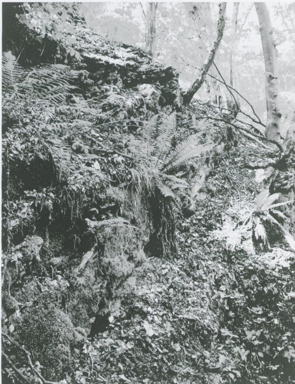
Abbildung 2. Wuchsort von Trichomanes speciosum , Gelbachtal G3 – 23.6.2006