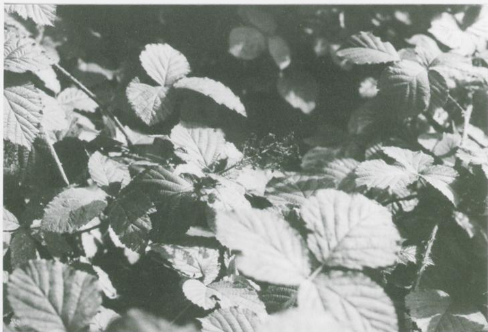
Abbildung 10. Rubus echinosepalus H. E. WEBER. Fruchtstand. Figure 10. Rubus echinosepalus H. E. WEBER. Fruit.