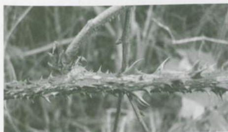
Abbildung 8. Rubus schleicheri WEIHE ex TRATTINNIK. Schösslingsabschnitt mit Stacheln.