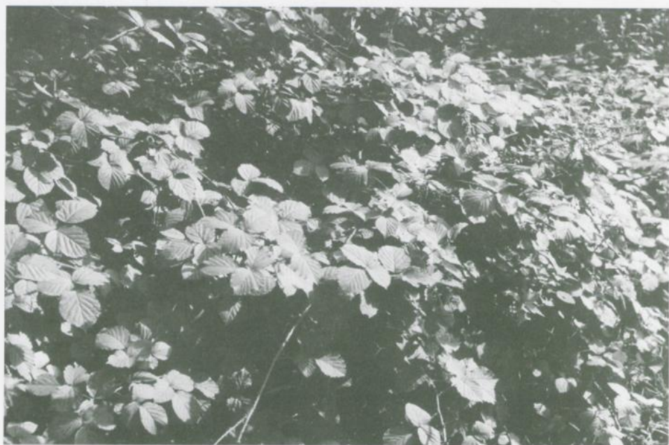
Abbildung 9. Rubus echinosepalus H. E. WEBER. Busch. Figure 9. Rubus echinosepalus H. E. WEBER. Shrub.