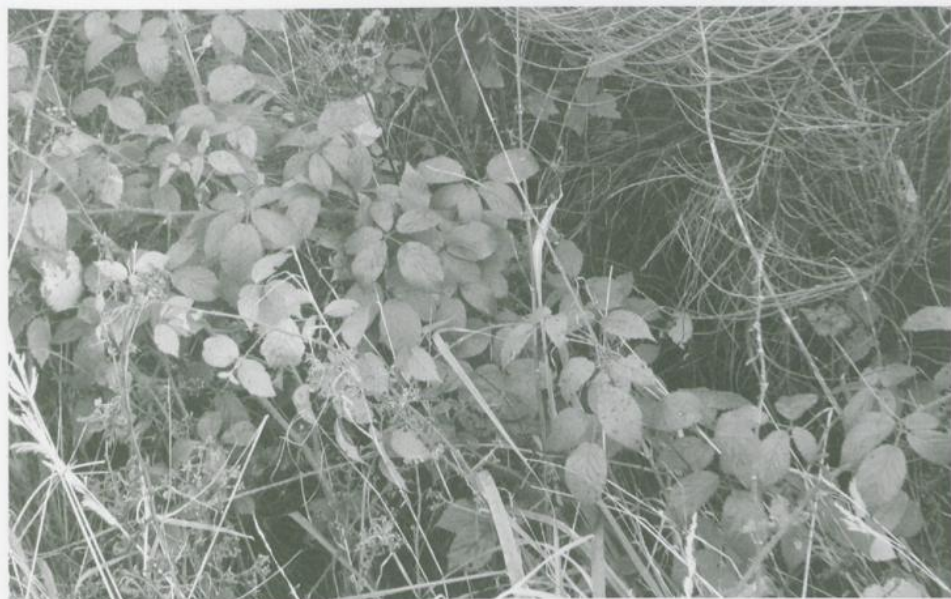
Abbildung 3. Rubus loehrüi WIRTGEN. Busch.