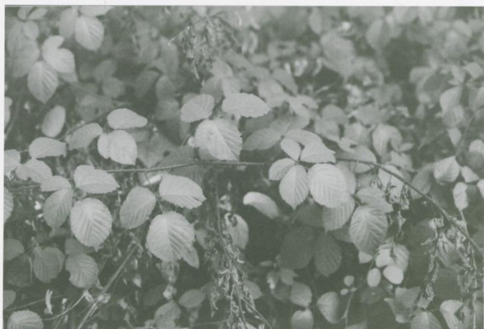
Abbildung 5. Rubus transvestitus MATZKE-HAJEK. Busch.

Figure 5. Rubus transvestitus MATZKE-HAJEK. Shrub.