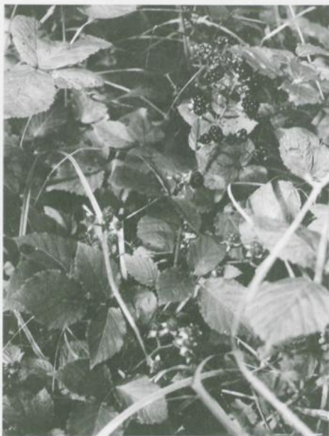
Abbildung 2. Rubus klimmekianus MATZKE-HAJEK. Fruchtstand.

Figure 1. Rubus klimmekianus MATZKE-HAJEK. Leaf.