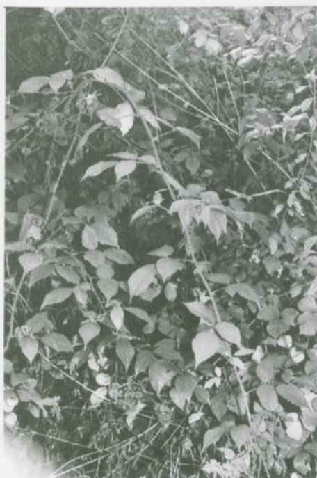
Abbildung 7. Rubus schleicheri WEIHE ex TRATTINNIK. Busch.