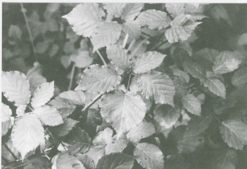
Abbildung 1. Rubus klimmekianus MATZKE-HAJEK. Blatt.

Figure 1. Rubus klimmekianus MATZKE-HAJEK. Leaf.