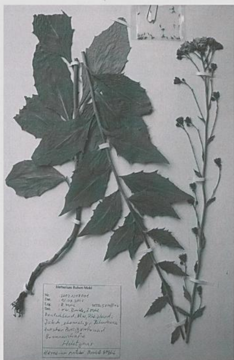
Abbildung 3. Holotypus von Hieracium patzkei BOMBLE & MOHL.