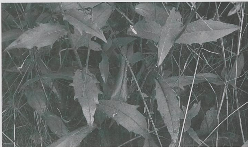
Abbildung 1. Blätter von Hieracium flagelliferum s. str. (Aachen, nahe Waldfriedhof – 5202.41), 13.08.2010.