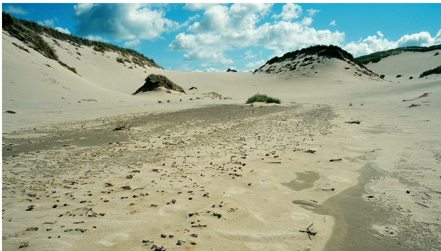
Abb. 5: Sekundäres Dünenental in der Initialphase im August 1995. Zehn Jahre später war die im Text beschriebene Pionier-Vegetation entwickelt.

Stellenweise ist der Dünen sand im Listland durch starke Winderosion in jüngerer Zeit bis auf eine verfestigte, dunkel gefärbte, permanent durchfeuchtete „Bodenplatte“ (vermutlich Diluvialkern) ausgeweht, sodass eine von hohen Dünen umrahmte Ausblasungs-