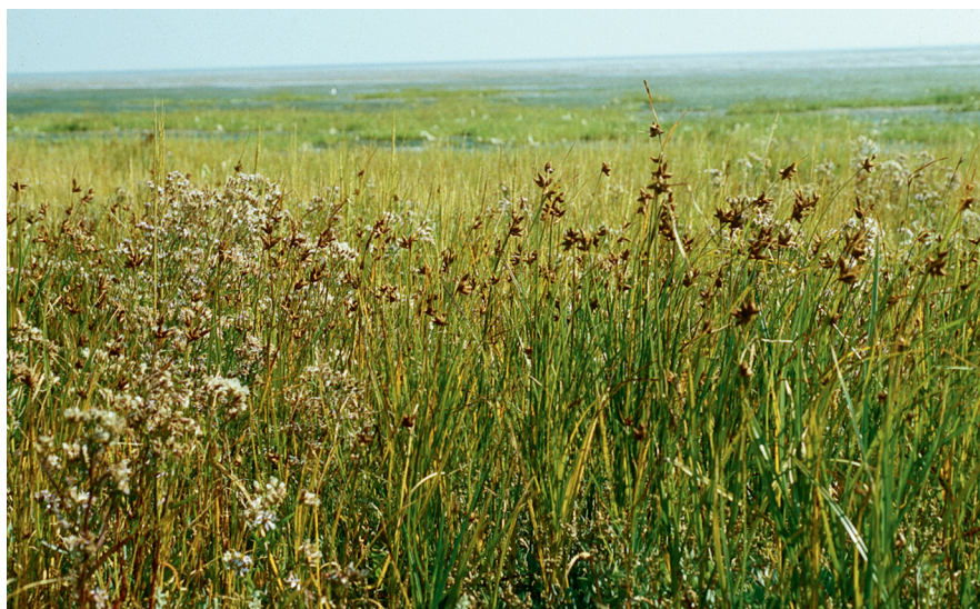
Abb. 9: Strandsimse und Strandaster südlich Puan Klent.

Die Raupen minieren von März bis Mai in den Blättern der Strandsimse sowie der Bottenbinse ( Juncus gerardii ) und der Zusammengedrückten Binse ( Juncus compressus ) (TRAUGOTT-OHLSSEN & SCHMIDT-NIELSEN 1977, BLAND 1996).