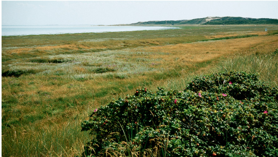
Abb. 10: Salzwiese südlich Puan Klent, im Vordergrund Kartoffelrosen-Busch.

Am 15.5.2005 wurden an diesem Fundort Raupen in den Herztrieben der Wirtspflanze Strandwegerich gefunden. Sie leben ab August überwiegend bis Juni. In Nordeuropa und in den hohen Gebirgen Europas ist die Art univoltin, im übrigen Europa einschließlich Großbritannien bivoltin (HUEMER & KARSHOLT 2010). Für Sylt ist die Anzahl der Generationen ungeklärt.