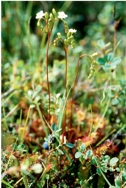
Abb. 7: Sonnentau und Moor-Heidelbeere in einem Dünental.

Die Raupen leben von Juli bis September zwischen versponnenen Blättern an den Triebspitzen der Moor-Heidelbeere. Sie verursachen einen netzartigen Schabefraß an den Blättern. Stellenweise waren sehr viele Pflanzen der hier niedrig wachsenden Moor-Heidelbeere von den Raupen besiedelt.