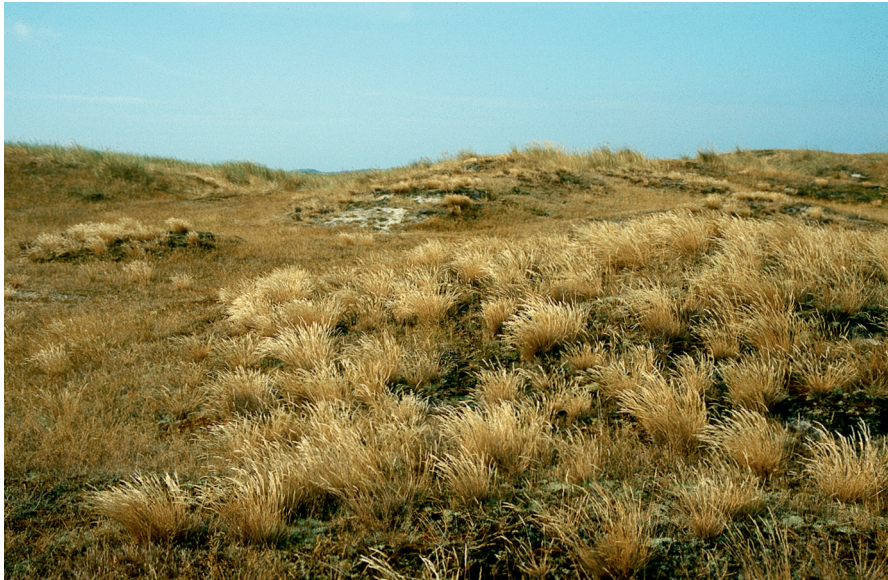
Abb. 2: Graudüne auf dem Ellenbogen.