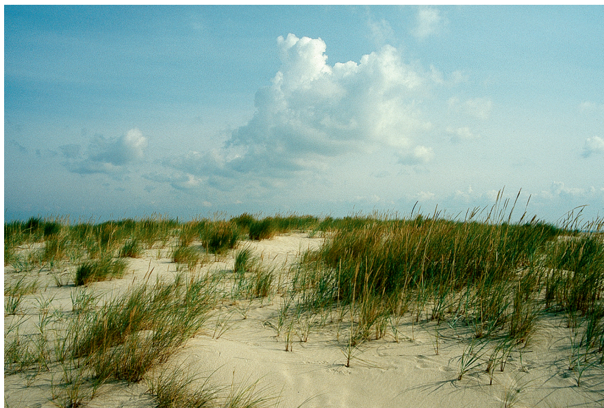
Abb. 1: Weißdüne auf dem Ellenbogen.

Die univoltine Art ist in Deutschland aktuell nur aus Schleswig-Holstein bekannt (WEGNER & KAYSER 2006). Früher kam dieser Zünsler auch auf den Ostfriesischen Inseln in Nieder-