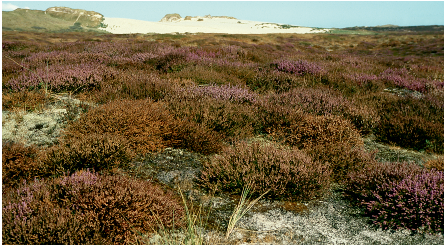
Abb. 4: Dünenheide mit Lücken, in denen Moose und Flechten wachsen.