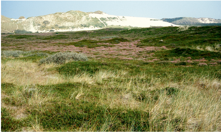
Abb. 6: Feuchtes Dünental mit flächig entwickelter „Erica-Moorheide“ im Mittelgrund.