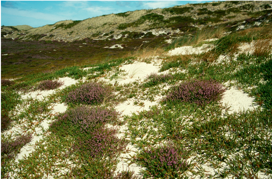
Abb. 3: Übersandete Krähenbeere und Besenheide in der Dünenheide.

Die Raupen minieren im Mai in einer langen Gangmine in den Rosettenblättern von Arnika (Gregersen mdl.).