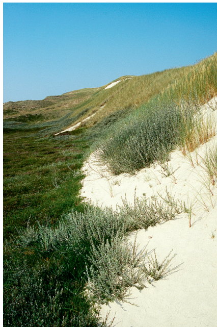
Abb. 8: Übersandendes Kriechweiden-Gebüsch.

Die Raupen leben von August überwintert bis Mai an moderndem Stammholz und an verrottenden Pflanzenteilen von Laub- und Nadelhölzern (TOKAR et al. 2005).