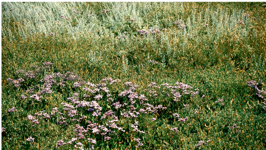
Abb. 11: Obere Salzwiese mit Strandflieder im Vordergrund und Strandbeifuß im Hintergrund.

Die Falter der halotopophilen Art sind auf den Vorderflügeln variabel gezeichnet und leben im Juni und Juli sowie in einer partiellen 2. Generation im August und September (RAZOWSKI 2002).